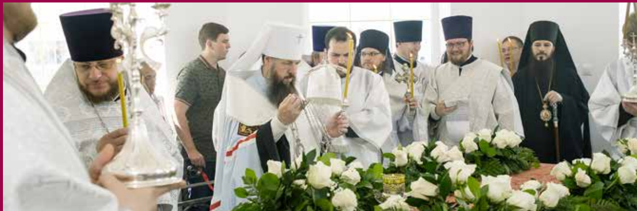
В день 220-летия со дня рождения великой благотворительницы литию в усыпальнице