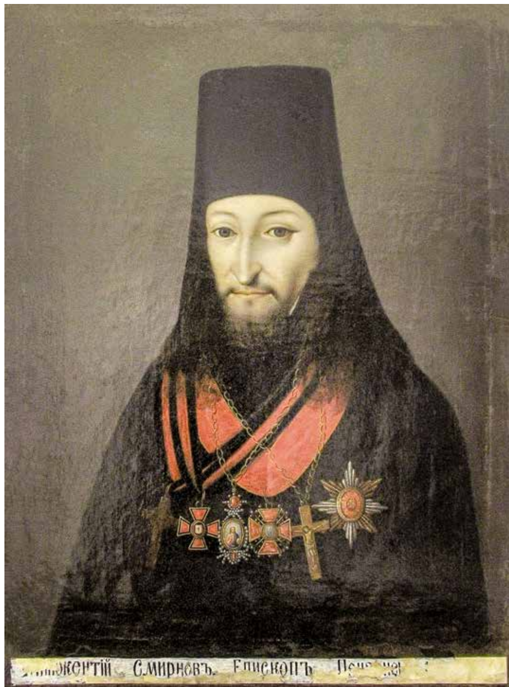
Иннокентий, епископ Пензенский и Саратовский. Портрет. 1819 год