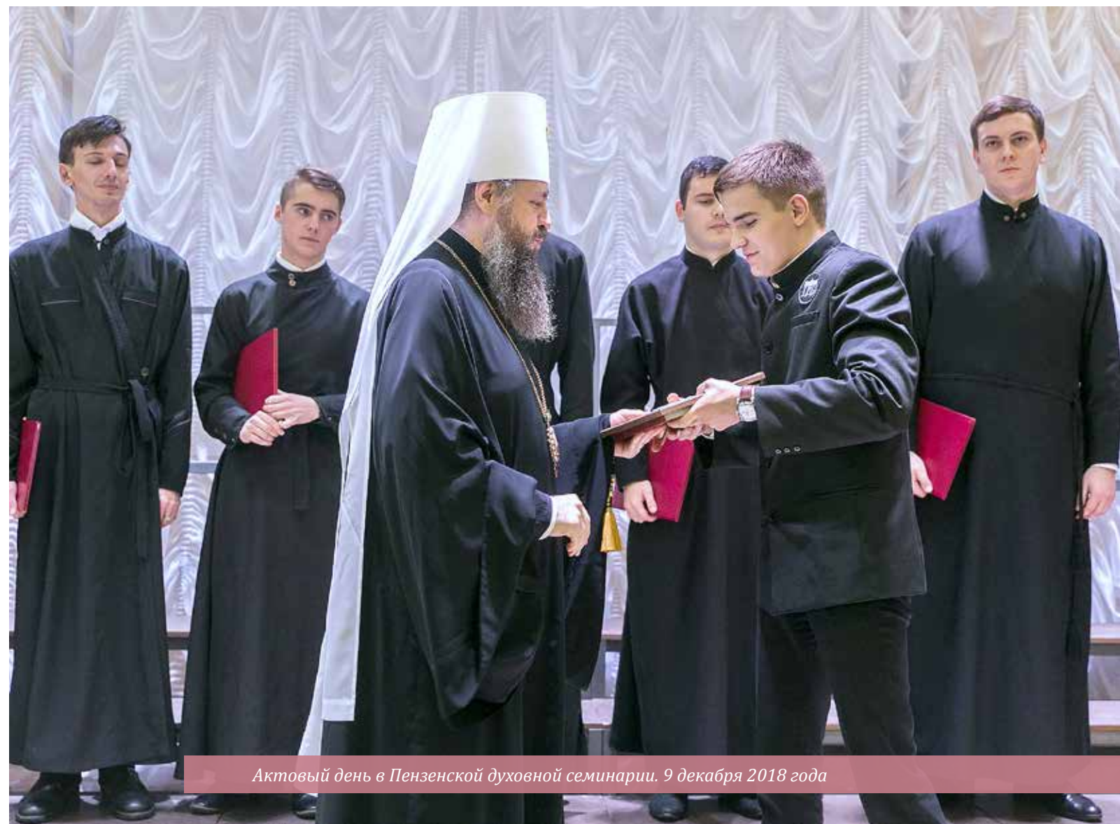
Актовый день в Пензенской духовной семинарии. 9 декабря 2018 года

– Отец Николай – это еще и один из самых выдающихся выпускников Пензенской семинарии. Сейчас она снова готовит кадры для Пензенской епархии, снова входит в число знаковых для города вузов, несмотря на небольшое число студентов, по сравне-