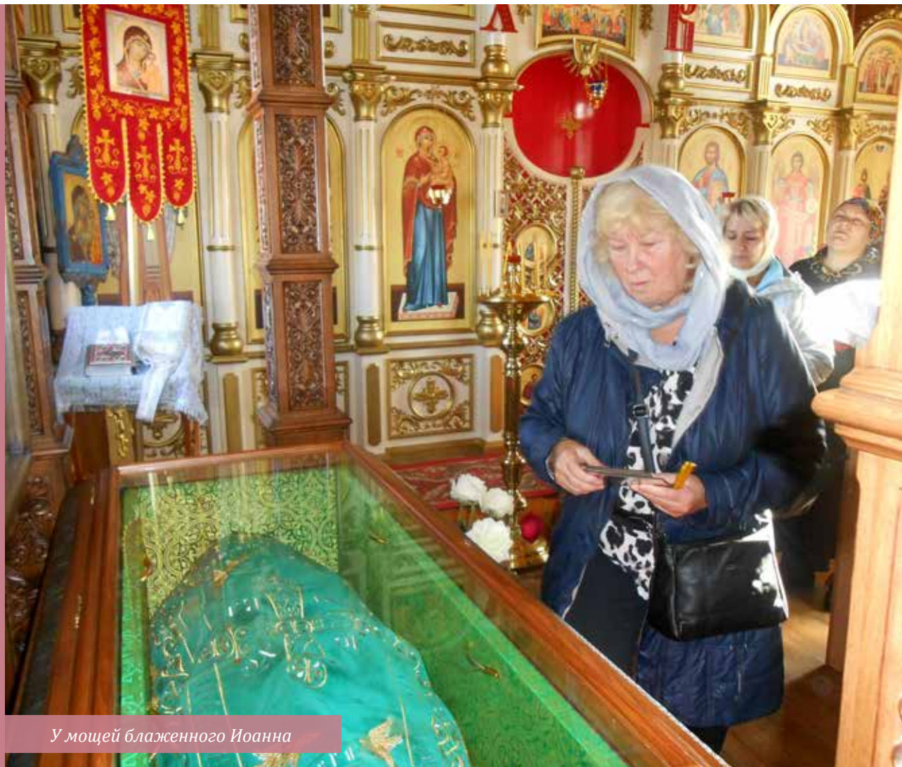
У мощей блаженного Иоанна

ным мощам Иоанна Кочетовского, помолиться в небольшом сельском храме, – получают особую благодатную поддержку. И сейчас уже есть масса свидетельств о том, что именно прославление этого святого подвигло многих людей к новому взгляду на подвижников благочестия, которые прославлены и не прославлены у нас в Пензенском регионе. Я хотел бы сказать, что у нас есть еще работа в этом направлении, и мы надеемся, что это – первая канонизация за два десятилетия, но не последняя.