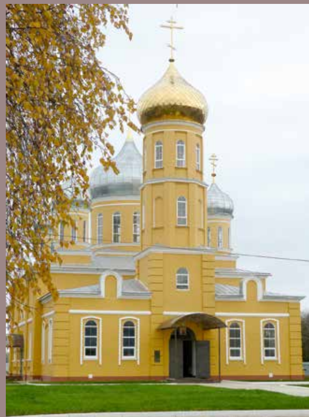
Нижнеломовский Успенский монастырь, в котором отец Константин служил последние шесть лет своей жизни

17 сентября 2000 г. епископом Майкопским и Армавирским Филаретом (Карагодиным) за