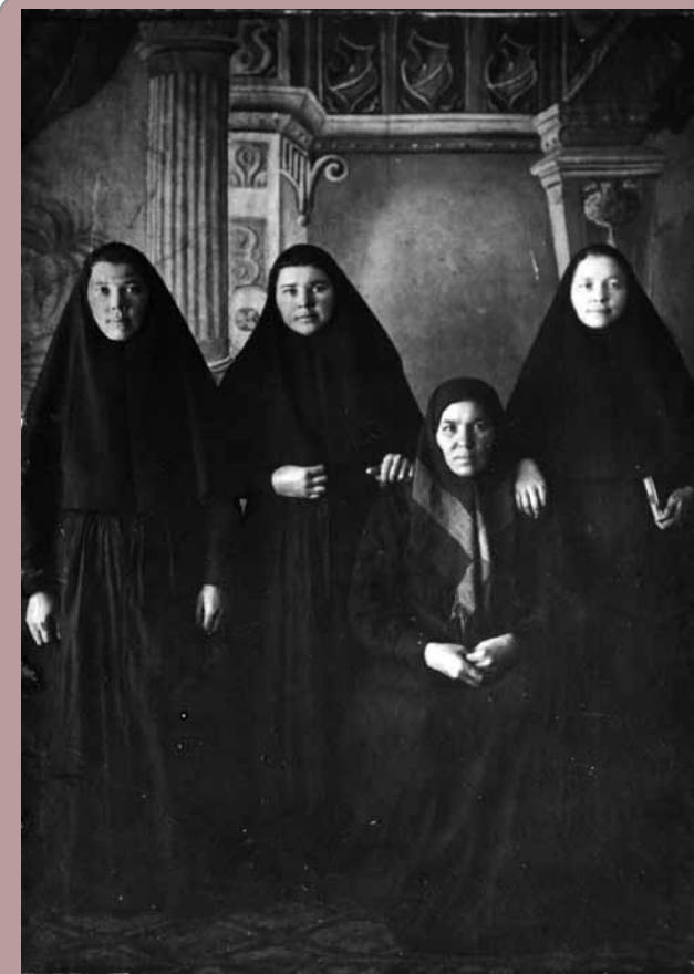
Монахини Керенского женского монастыря

Далее тов. Шуваев указывает, что в монастыре найдено [нрзб] «спрятанной мануфактуры». Да мануфактура эта не [нрзб] и была спрятана в обыкновенный сундук, который [нрзб] 200 арш[ин] разной мануфактуры, принадлежащей 500 сестрам. Из этого видно, что на каждую из нас приходилось далеко не много.