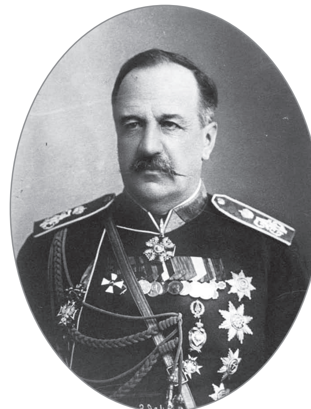
Граф Илларион Воронцов-Дашков

В заключение представленных здесь материалов о пребывании наследника цесаревича в Пензенский губ. в 1891 г. не лишним будет привести полный текст всеподданнейшего рапорта пензенского губернатора, тем более что документ этот интересен, бесспорно,