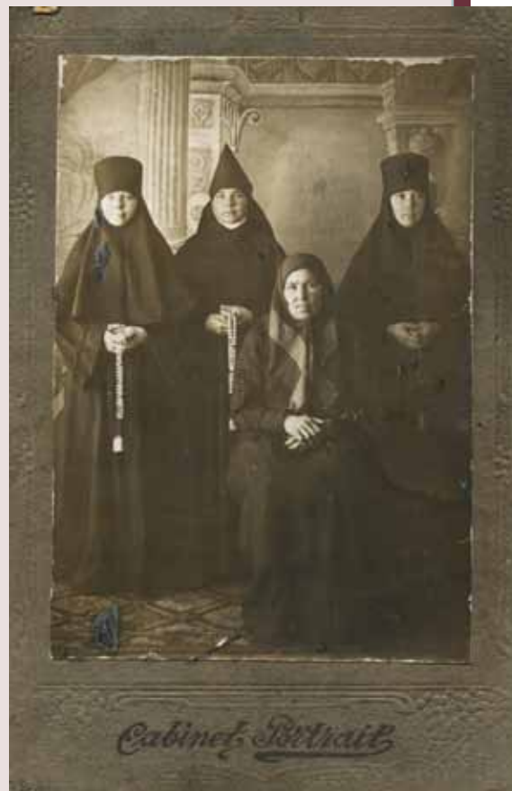
Монахини Керенского женского монастыря

Вследствие изложенного и пользуясь правом, предоставленным ст. 17 означенного декрета, Совет монастыря покорнейше просит Всероссийский Центральный Исполнительный Комитет во имя человеческой справедливости отменить постановление Керенского Уисполкома и возвратить монастырю вышеозначенное отобранное имущество и двух лошадей, и дать нам беззащитным людям возможность жить под кровом нашего монастыря и личным трудом добывать себе пропитание, ибо мы все дети трудового народа. В Рос[сийской] Соц[иалистической] Фед[еративной] Респ[ублике] существует свобода совести, и каждый гражданин ее может верить и молиться так, как он желает, и гонению за это не подвергается,