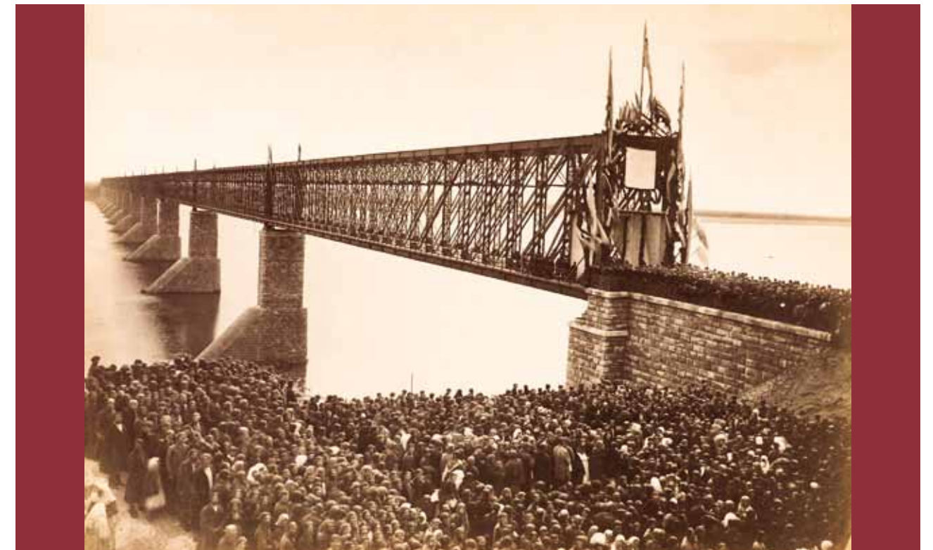
Сызранский Александровский мост

«По своей длине (до 1,5 верст) он занимает первое место на европейском континенте и шестое в мире. <...>. Проект этого сооружения принадлежит проф. Белелюбскому <...>. Металлические части поставлены из железа бельгийских заводов и отчасти Брянского. Вся каменная кладка в опорах моста, за исключением облицовки ледорезов и подферменных камней, которые сделаны из Выборгского гранита, выведены из местного жигулевского известняка. Постройка