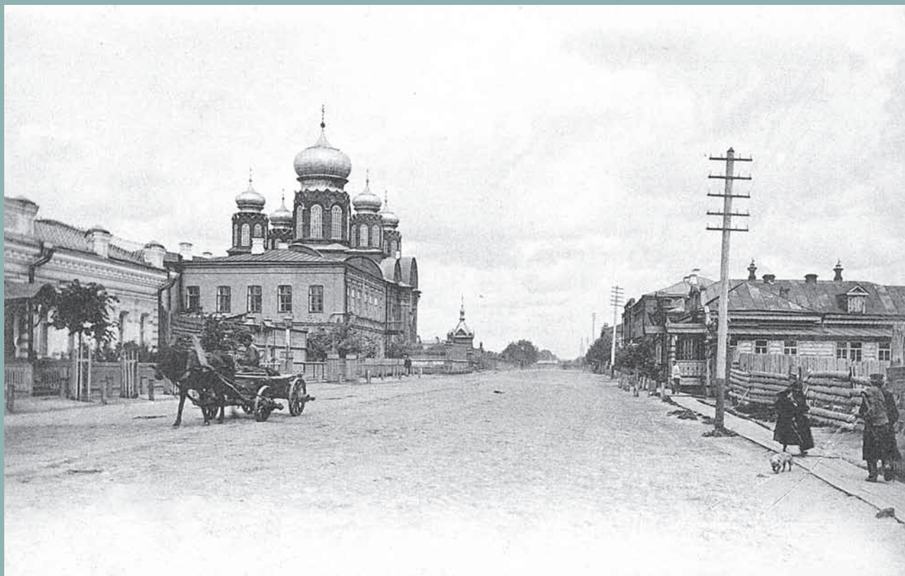
Вид на Богоявленскую церковь; справа от нее видна часовня в память пребывания в Пензе наследника цесаревича Николая Александровича. Фото 1910-х гг.

Печатается по публикации: Пензенский временник любителей старины. 2000. Вып. 9.