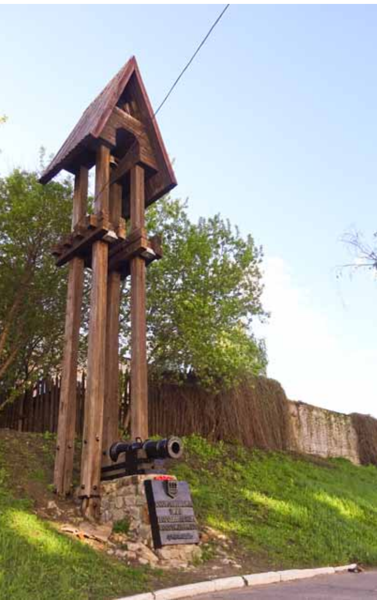
Остатки крепостного вала в Пензе на улице Кирова. Здесь триста лет назад и стояло войско кочевников

род всеми силами, увидели пред своими полчищами Прекрасную, но Грозную Деву, выехавшую из Пензы на белом коне, в сопровождении двух благолепных старцев, одного плешивого, а другого брадатого, и светоносными паче солнца лучами, как пламенным мечем, поражающую нападавших, от чего они объаты были страхом и бежали. Так крепким заступлением Царицы Небесной спасен был город, а вера в чудотворную силу Казанской иконы Божией Матери между жителями умножилась и распространилась!»