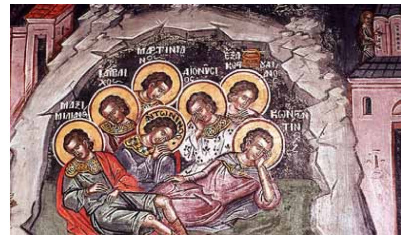
Семь спящих отроков Эфесских. Византийская фреска. В день их памяти, 4/17 августа, началась осада Пензы кочевниками

Все последующие описания Казанской-Пензенской иконы и чуда спасения Пензы восходят к работе Бурлуцкого и записке 1817 г. Потому-то и закрепилась в итоге в церковном календаре 4/17 августа – дата начала осады Пензы – как дата спасения города.