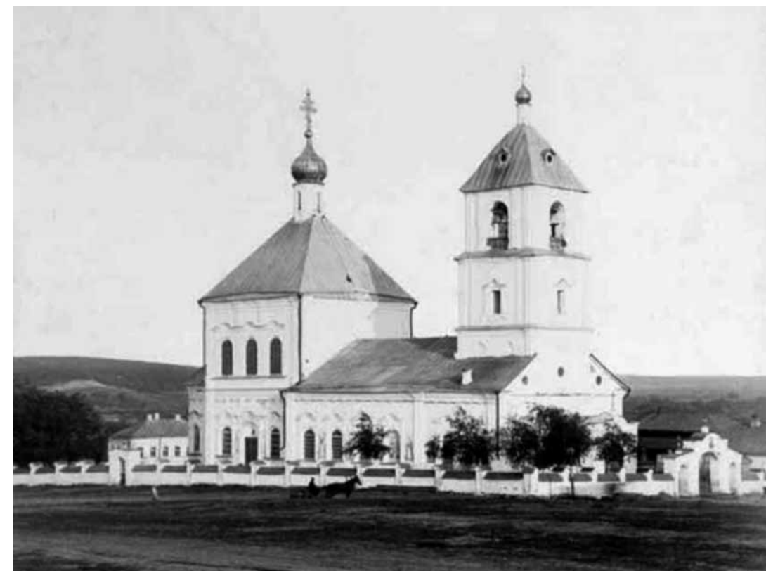
Успенский собор Керенска