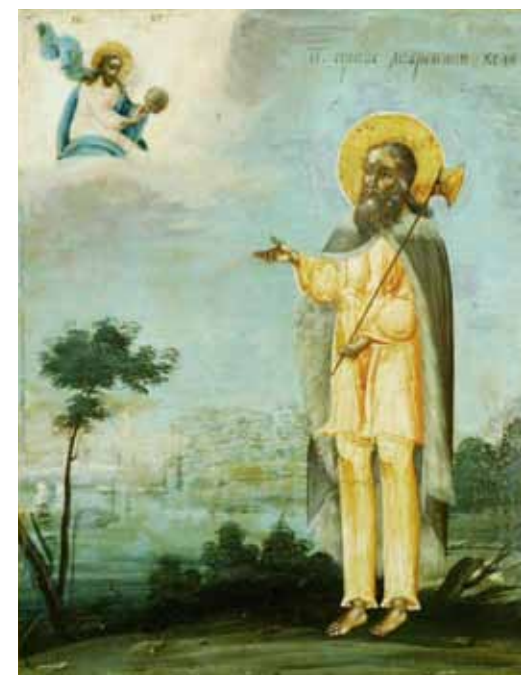
Блаженный Лаврентий Калужский