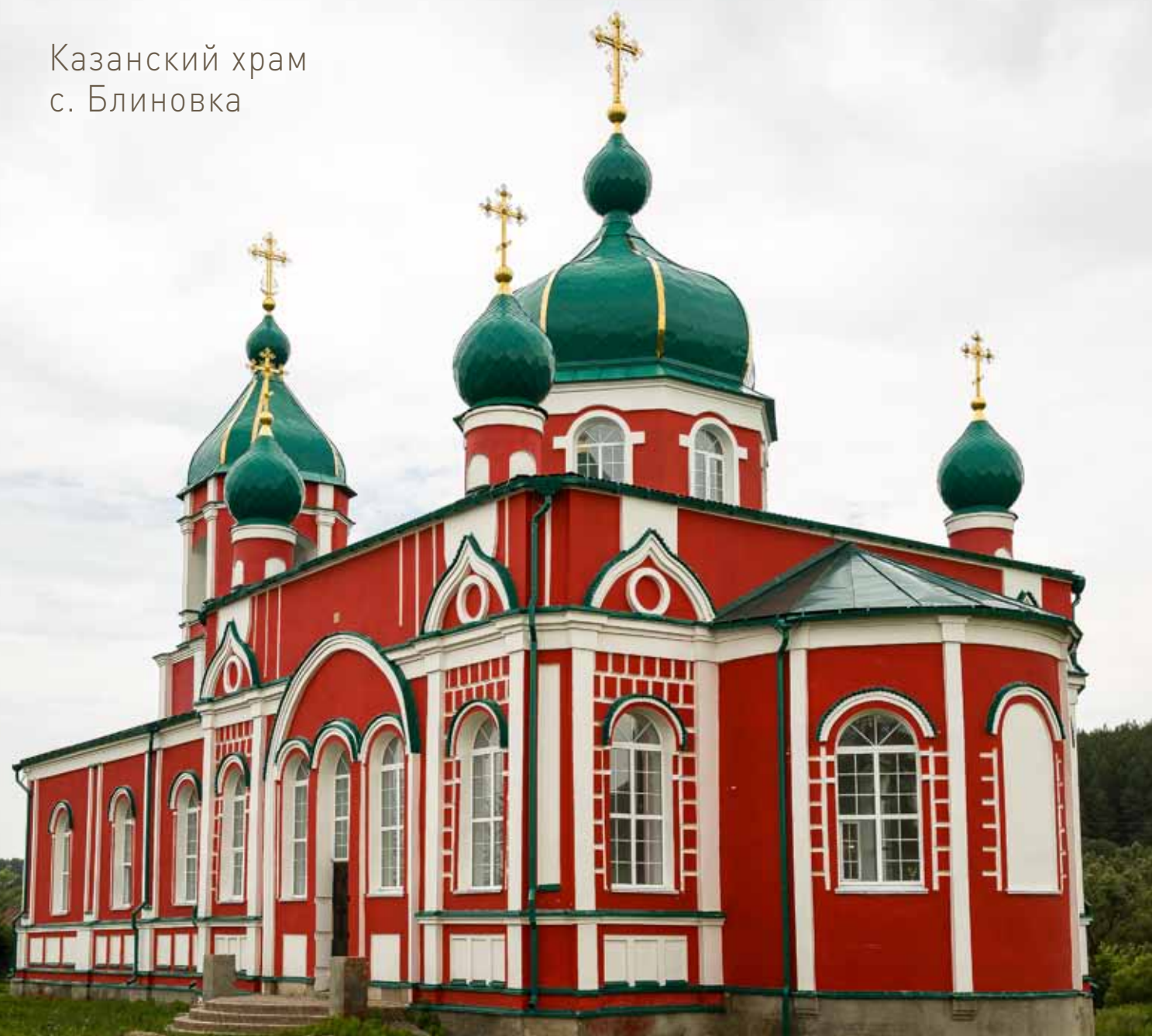
ПОДРОБНЕЕ О ХРАМЕ НА СТР. 48