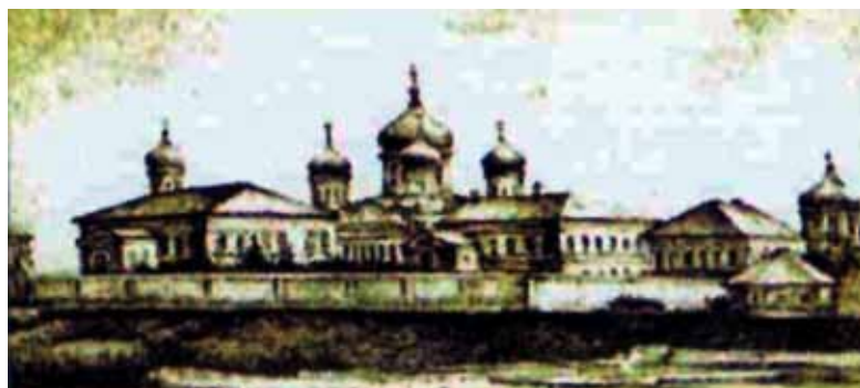
Чуфаровский монастырь. Вид начала XX в.