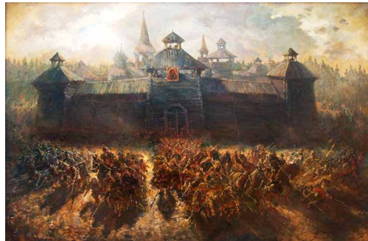
«Чудо Казанской иконы Божией Матери». Картина Дениса Санталова. 2010. Художник взял за основу тот вариант предания, по которому святой образ вынесли на крепостную стену

А вот башня в восточной стене, напротив Преображенской церкви (или памятника Первопоселенцу) была глухой, ворот в ней не было. Конечно, может быть, на нее и установили Казанскую икону для общегородской молитвы (она была ближе всего к соборной церкви). Но всё же, если только у Бурлуцкого не было каких-то дополнительных сведений, – думаем, что он ошибается, отождествляя башню с Никольскими воротами и башню на восточной стороне, напротив Преображенского