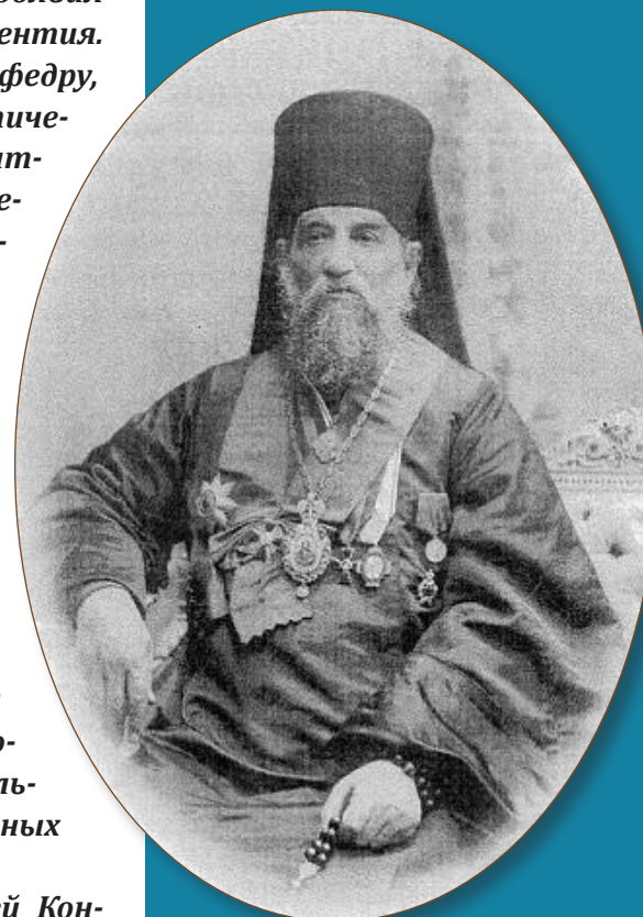
Митрофан II (Симашкевич)

8 ноября 1911 г. членам Синода были разосланы из его канцелярии копии с «Представления» пензенского преосвященного. На нем же расписались в получении Флавиан (Городецкий; 1841-1915) – митрополит Киевский и Галицкий с 1903 г.; Иннокентий (Беляев; 1862-1913) – архиепископ Карталинский и Кахетинский, экзарх Грузии с 1909 г.; Гермоген (Долганёв; 1858-1918) – священномученик, епископ Саратовский и Царицынский в 1903-1912 гг., позже епископ Тобольский и Сибирский; Евлогий (Георгиевский; 1868-1946) – епископ Холмский и Люблинский в 1905-1914 гг., позже митро-