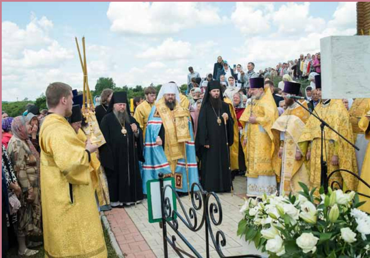
Панихида на могиле старца Иоанна Кочетовского в с. Кочетовка. 25 июня 2017 г.

бор. Если мы, например, прославляем Вселенские Соборы, где было 300 святых участников, то здесь не меньше святых, которые уже прославлены Церковью, причем в основном это – мученики.