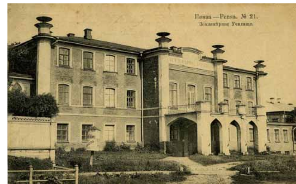
Пензенское землемерное училище, начальником которого был В.П. Ларионов