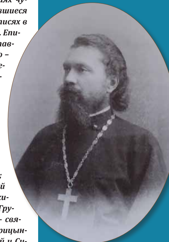
Протоиерей Константин Ручимский