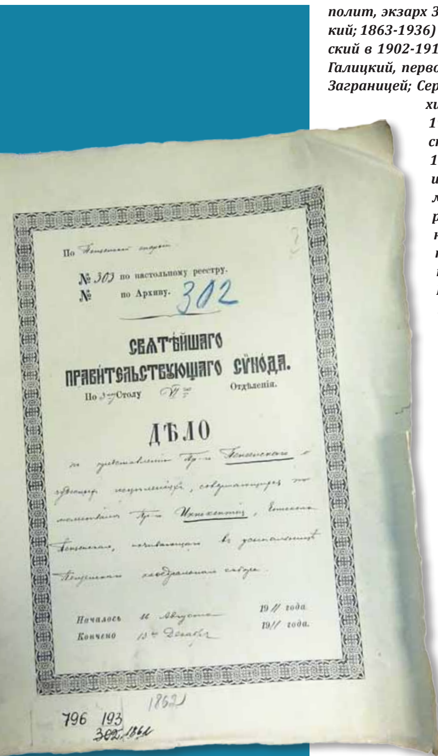
Дело из архива Синода по «Представлению» епископа Митрофана

полит, экзарх Западной Европы; Антоний (Храповицкий; 1863-1936) – архиепископ Волынский и Житомирский в 1902-1914 гг., позже митрополит Киевский и Галицкий, первоиерарх Русской Православной Церкви Заграницей; Сергей (Страгородский; 1867-1944) – архиепископ Финляндский и Выборгский в 1905-1917 гг., позже Патриарх Московский и всея Руси; Назарий (Кириллов; 1850-1928) – архиепископ Полтавский и Переяславский в 1910-1913 гг., позже митрополит Курский и Обоянский; Серафим (Чичагов; 1856-1937) – священномученик, епископ Кишиневский и Хотинский в 1908-1914 гг., позже митрополит Ленинградский и Гдовский. Кроме того, в этот список неизвестным лицом были вписаны имена Антония (Вадковского; 1846-1912) – митрополита Санкт-Петербургского и Ладожского с 1898 г., первенствующего члена Синода; и Владимира (Богоявленского; 1848-1918) – священномученика, митрополита Московского и Коломенского в 1898-1912 гг., позже митрополита Киевского и Галицкого. Митрополит Флавиан датировал свою подпись 12 ноября, архиепископ Сергей – 22 ноября, остальные иерархи дат не поставили.