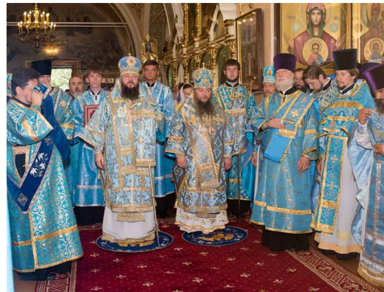
17 августа 2016 г., в день чествования Казанской-Пензенской иконы, литургию в Митрофановском храме совершили митрополит Пензенский и Нижнеломовский Серафим и епископ Сердобский и Спасский Митрофан