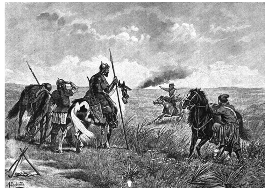
«Тревога на пограничном карауле (XVI в.)». Художник А.П. Сафонов. Репродукция из журнала «Нива». XIX в.

банцы Пензенской уезд, в Завальном и Узинском станах, монастырские и помещиковы, и вотчинниковы, и яшашные села и деревни разорили и выжгли, и людей в полон побрали, а других порубили. А что сел и деревень числом разорено и выжжено и людей в полон побрано и побито, – о том де подлинно сведомиться ему невозможно для того, что де они и ныне Пензенский уезд разоряют. И того де августа 3-го числа в начале дня первого часа оные кубанцы многочислом пришли к городу Пензе и приступают, и пензенские всяких чинов