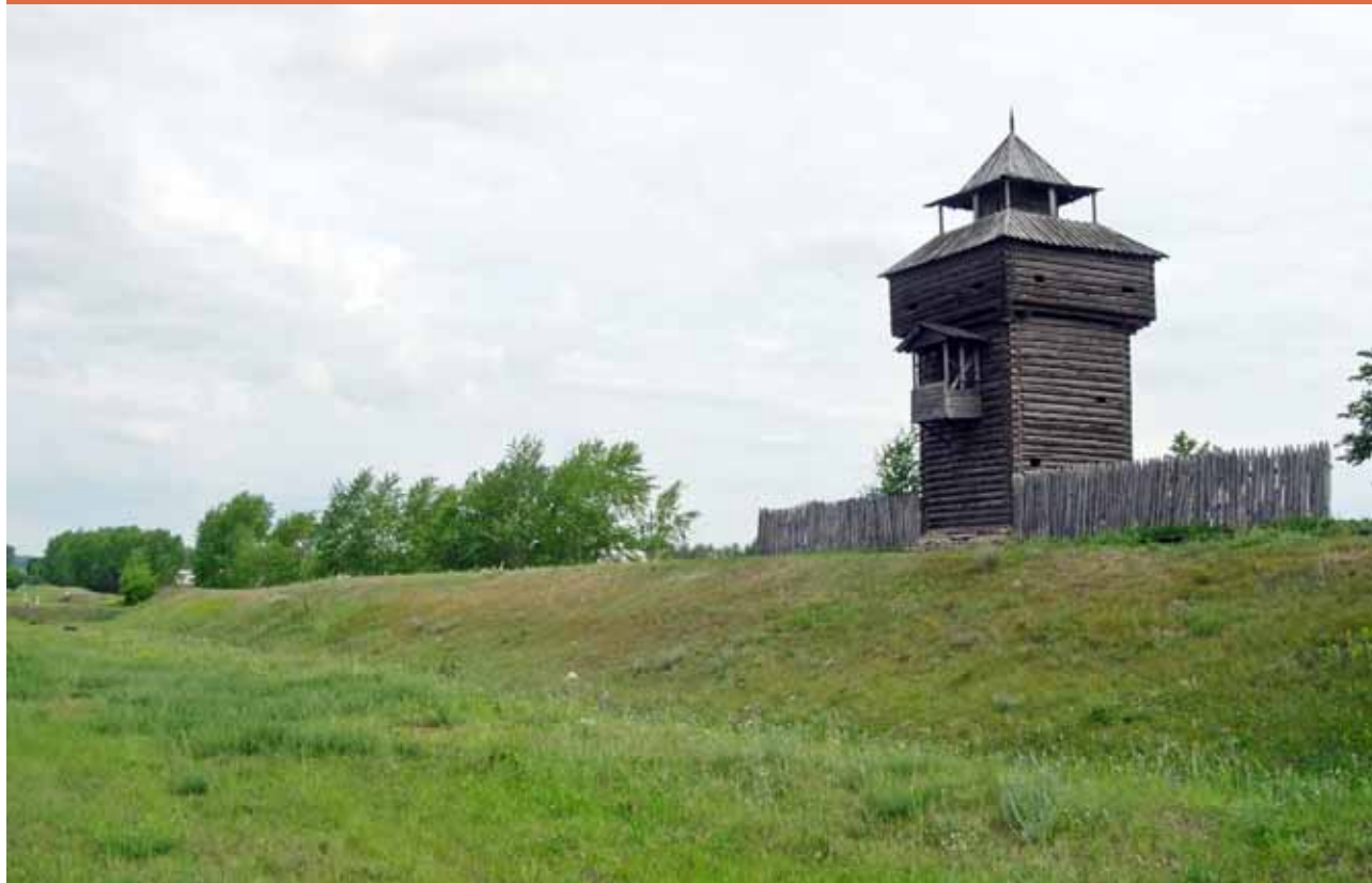
Оборонительный вал под Мокшаном

густа 4-го числа, на память Святыя Преподобномученицы Евдокии и седми отроков спящих, стоя под градом Пензою несколько дней, будучи отбиваемы по земляному валу, с четырех деревянных башен, называемых: Саратовскою, Петровскою и которая была в Нижней Засеке, Красной и Глухою, пушками, ружьями, пищалами и стрелами и прочими подобными по тогдашнему обычаю орудиями, сколько от граждан, а паче от съехавшихся из уездов со всякими орудиями, благородных дворян со своими людьми».