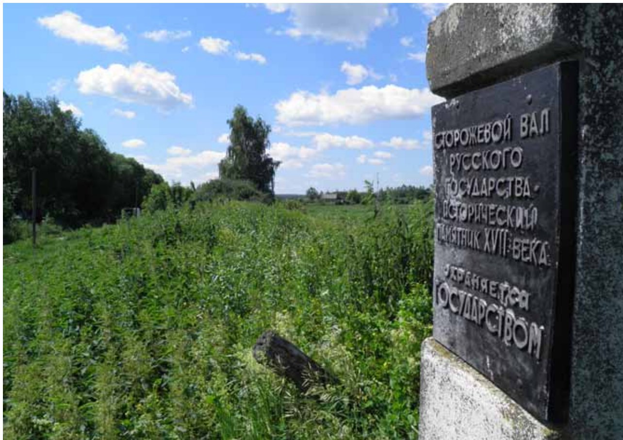
Остатки Шишкеевского острога. Крепостной вал.