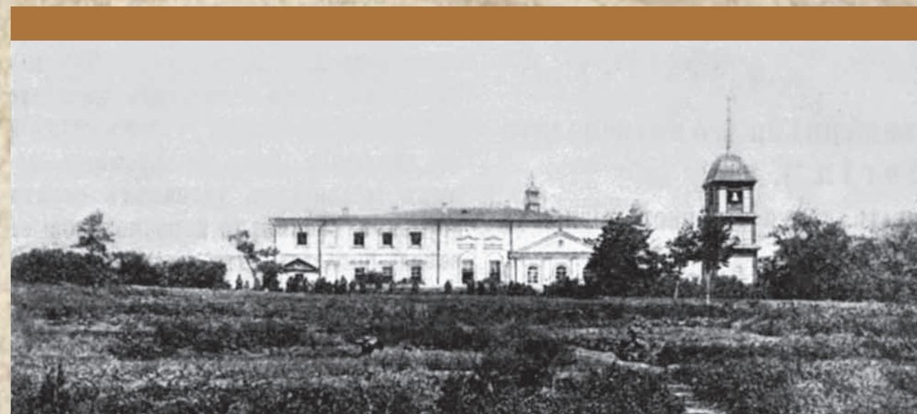
Пановская Троицкая община до строительства собора. Фото конца XIX в.

тись в 47,073 рубля с копейками, а обитель имела в то время только десять тысяч, и Господь помог игуменье с сестрами построить храм. Хлопотливая и энергичная игуменья с благословения архипастырей и с их разрешения посылала по сбору сестер с двумя сборными книгами по своей епархии и по чужим, и добрые православные русские люди не отказывали в жертвах, подаяниях на святое дело, оправдывая слова народного писателя, что из лепты трудовой вырастают храмы Божии по лицу земли родной; сборы, подаяния текли на храм и от богатых людей и бедных, всякое даяние и большое и малое принималось с благодарением, со слезами радости и крестным знаменем. Всероссийский молитвенник, высокочтимейший пастырь отец Иоанн Кронштадтский пожертвовал в разное время более 300 рублей на построение храма, Преосвященный Николай сто рублей, саратовский губернатор сто рублей, среди жертв были крупные жертвы, что и помогло достроить храм. Постепенно и сообразно весьма скудным средствам общины, заготавливался материал для храма. Дальность расстояния монастыря от города и железной дороги тормозили дело построения храма. Бут, камень был куплен в количестве 60 кубических сажень по 3 рубля за 180 рублей, а пришлось отдать за провоз по 20 рублей за куб, за 60 саж. 1200 рублей. Да при этом качество глины на монастырской земле для кирпича не годилось, почему кирпич вырабатывал-