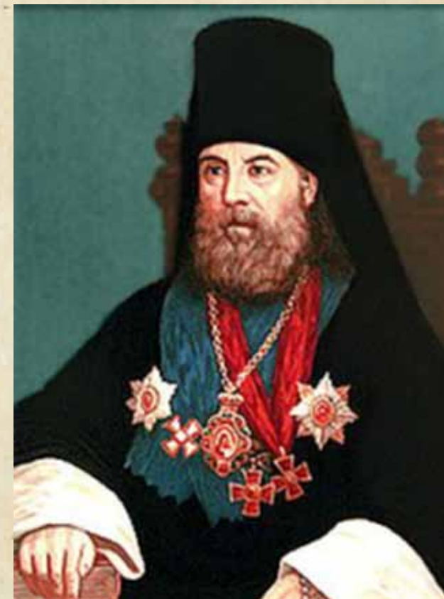
Епископ Симеон (Линьков)

10 марта 1875 г. архимандрит Симеон навсегда уехал из Пензы: он стал наместником Александро-Невской лавры в Петербурге. Здесь он пробыл восемь лет. Как и практически всех лаврских наместников, отца Симеона ждало архиерейство. 13 февраля 1883 г. в лавре он был хиротонисан во епископа Орловского и Севского, а 3 июня 1889 г. был назначен епископом Минским и Туровским. 15 мая 1894 г. владыка Симеон был награжден бриллиантовым крестом для ношения на клобуке. А спустя пять лет, 30 июля 1899 г., скончался в Минске. Митрополит Мануил (Лемешевский) пишет, что незадолго до своей кончины, перед тем, как ему выехать в Петроград, он видел сон, предвещавший ему близкий его исход из юдоли земной в небесные обители.