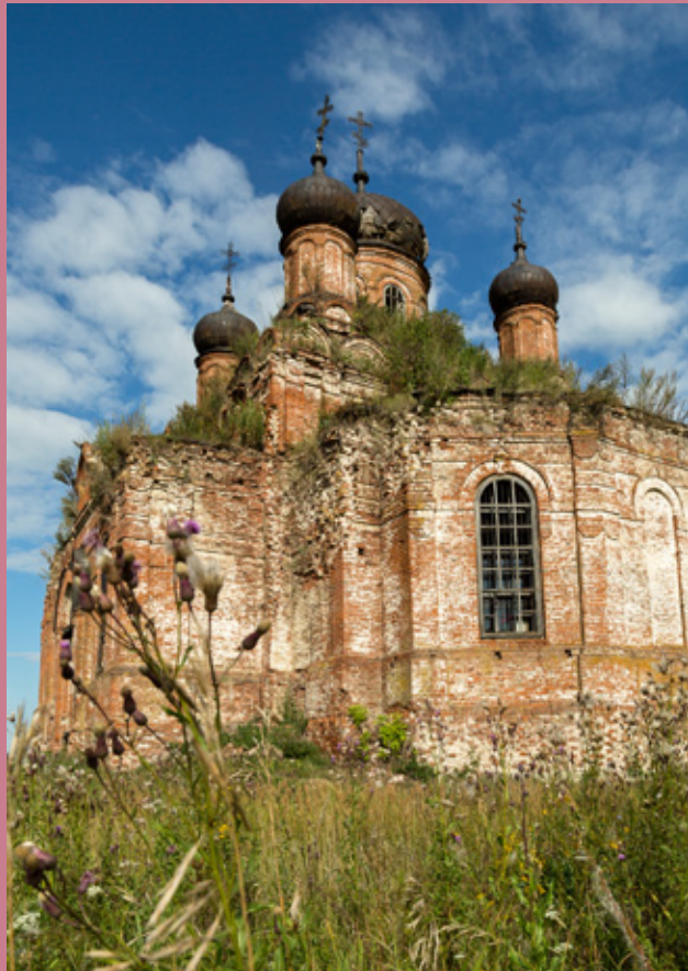
Архиерейское богослужение в с. Юлово Мокшанского района. 23 августа 2015 г.