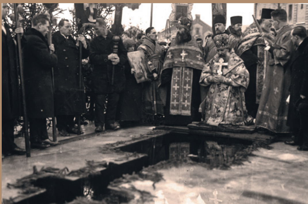
Освящение владыкой Иоанном Иордани на реке Даугава.