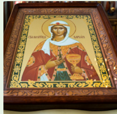
Митрополит Серафим освятил левый Никольский придел Троицкой церкви с. Кевдо-Мельситово

17 декабря , в день памяти великомученицы Варвары, митрополит Серафим совершил Литургию в Троицкой церкви с. Кевдо-Мельситово Каменского района и освятил левый придел восстанавливаемого храма в честь Свт. Николая Чудотворца.