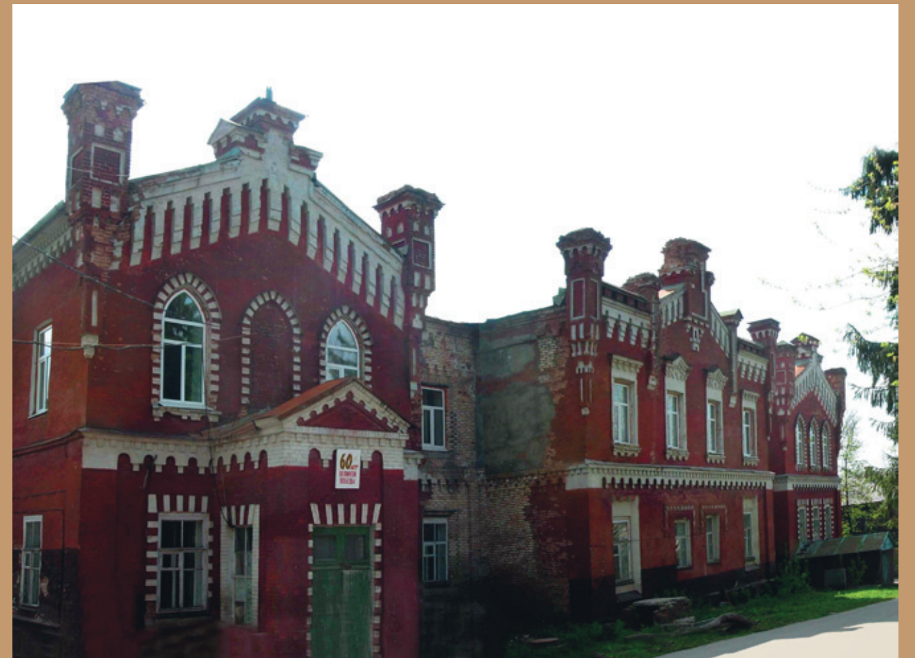
Киселевская богадельня. Западный фасад. Вид до реставрации. Фото 2006 г.