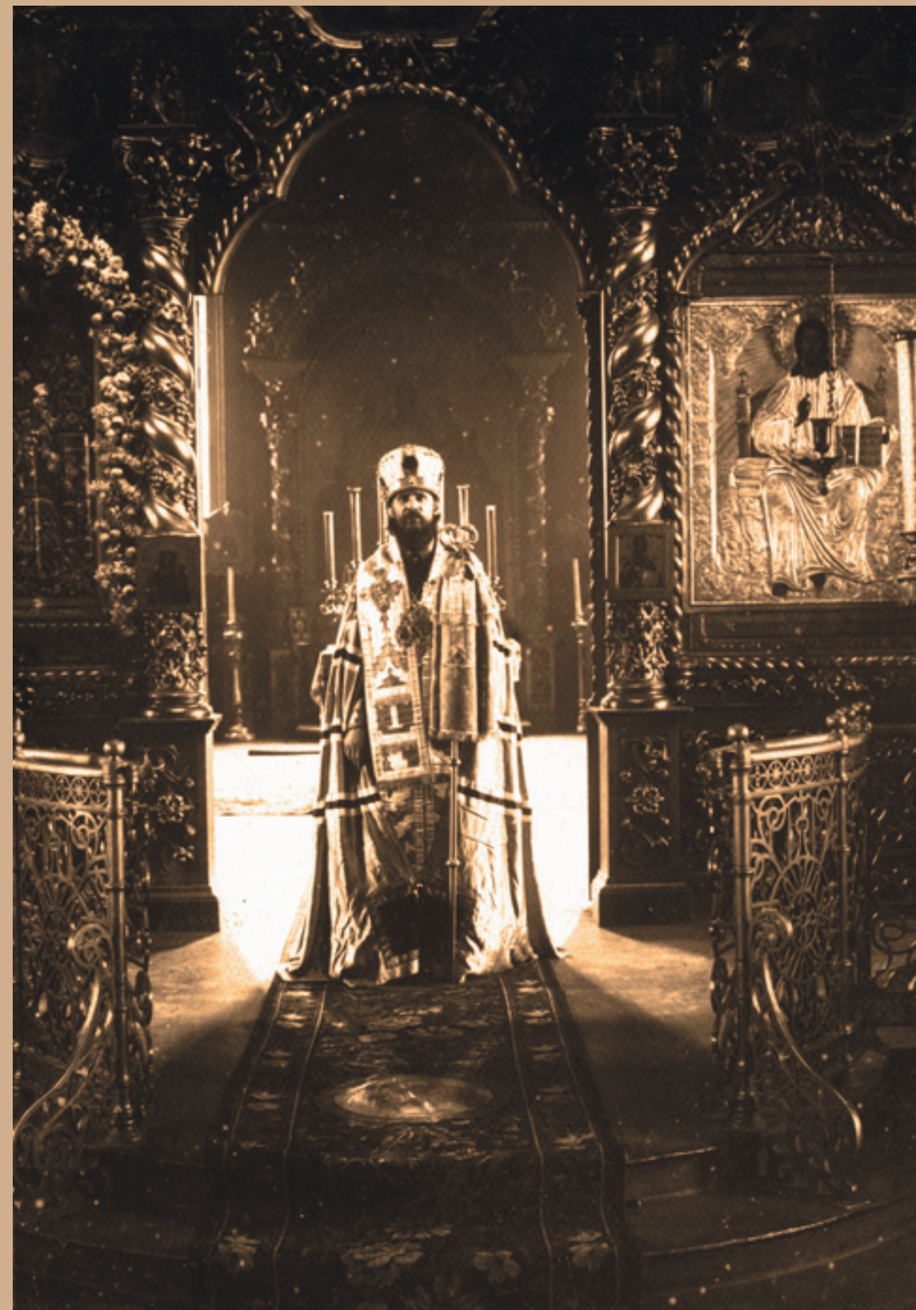
Епископ Августин на Ивановской кафедре. 1920-е гг.

Видя оскудение и запустение духовной жизни в Пензе, отец Александр просил забрать архиепископа Рижского Иоанна к себе, но воля Божия была иной.