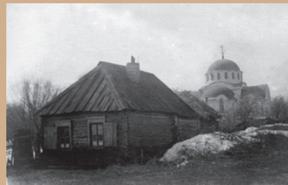
Троицкий храм в Соловцовке. Фото рубежа XIX-XX вв. из коллекции И. Соколовой