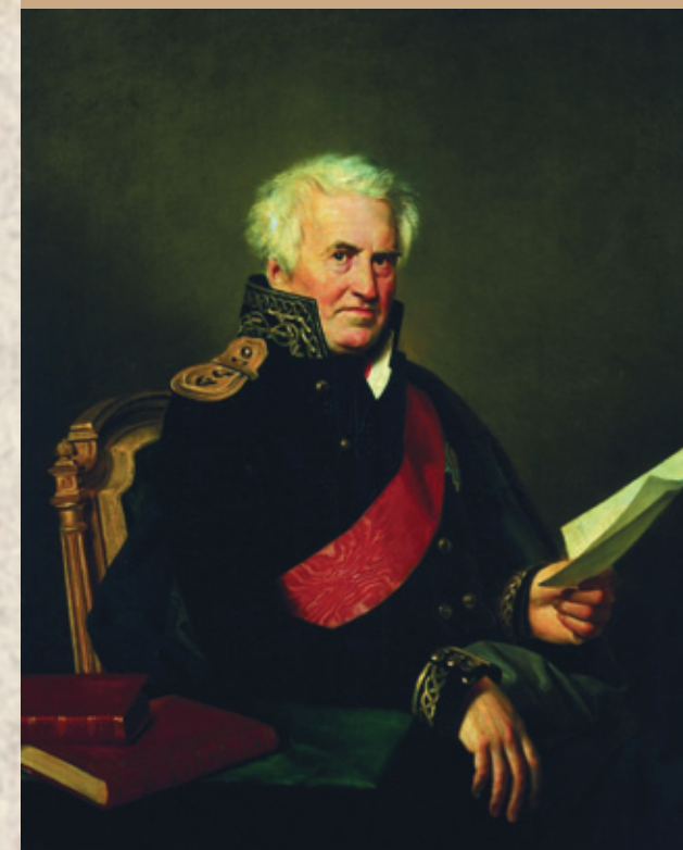
Александр Семенович Шишков (1754-1841)