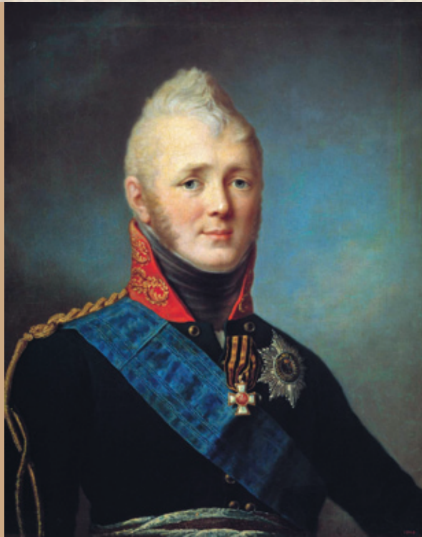
Александр I (1777-1825)