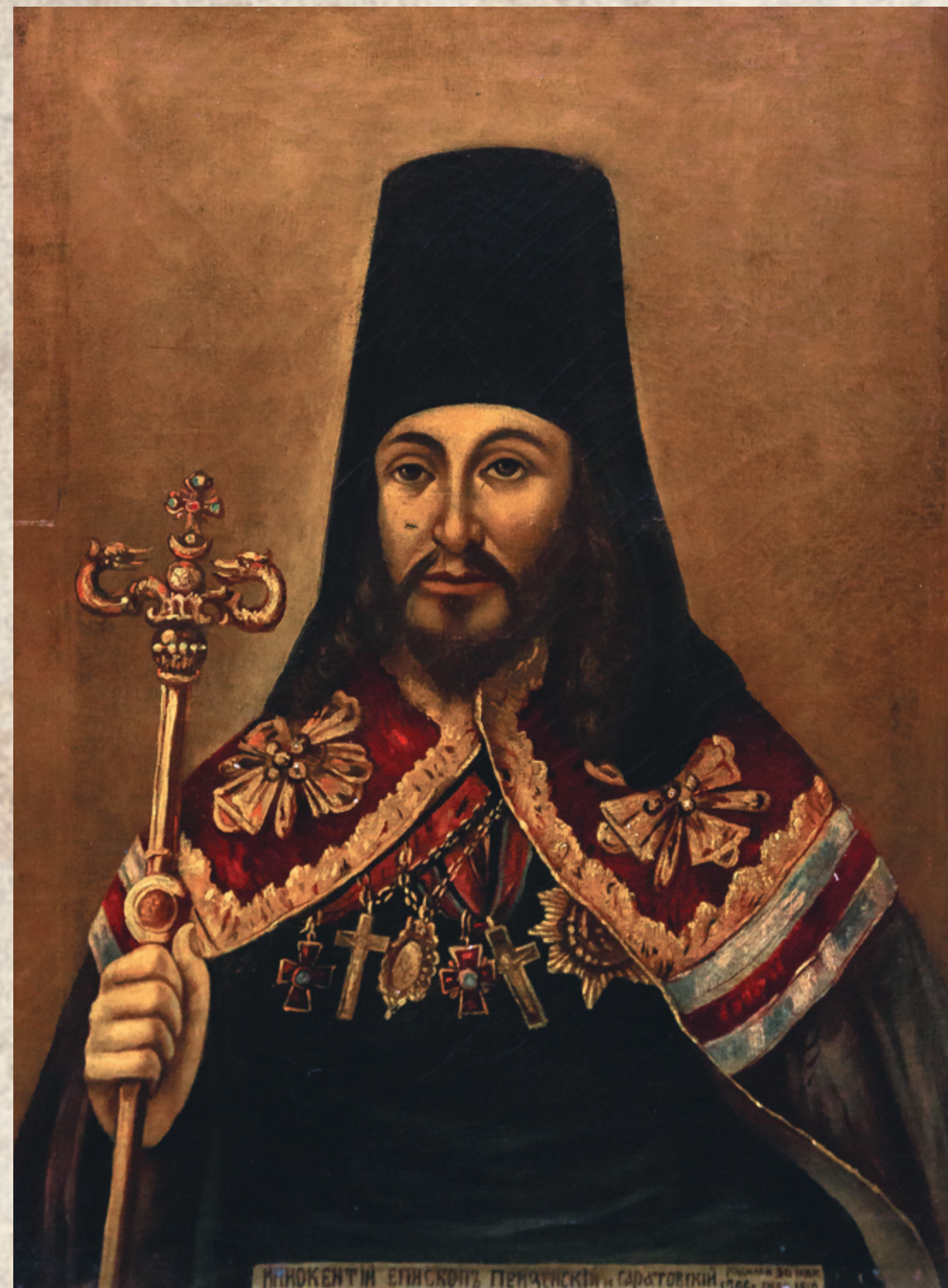
Портрет Преосвященного Иннокентия из собрания Пензенского Троицкого женского монастыря. Предположительно, копия с прижизненного портрета. Рубеж XIX-XX вв. Холст, масло. 41 x 56. Публикуется впервые.