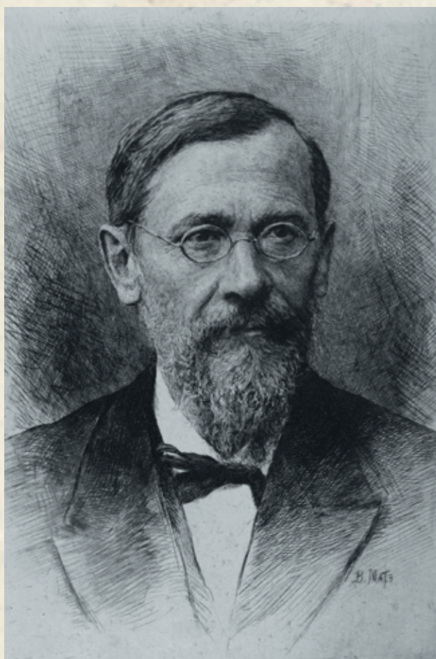
Василий Осипович Ключевский

Святитель Иннокентий Пензенский и историк Василий Ключевский – такую тему, насколько известно, никто еще не рассматривал. И вроде бы точек соприкосновения между ними немного – по сути, лишь одно упоминание в «Курсе русской истории». Однако именно точка зрения Ключевского помогает переосмыслить «петербургский» период жизни святителя.