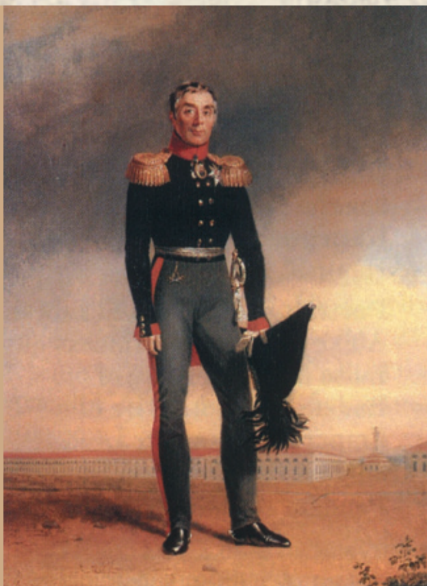
Граф Алексей Андреевич Аракчеев (1769-1834)

Во-первых, из этого следует, что великий историк считал этот эпизод действительно показательным, знаковым для рубежа 1810-20-х гг. В целом, заметим, в «Курсе русской истории» Ключевский уделяет очень мало внимания истории Русской Православной Церкви (не по причине своей неосведомленности, но четко следуя поставленной себе задаче). К примеру, митрополита Платона (Левшина) Василий Осипович упоминает лишь раз, в связи с его знаменитой речью у гробницы Петра Великого; а митрополита Филарета (Дроздова) – тоже лишь однажды, в связи с завещанием Александра I, в подробности которого святитель был посвящен. И опала архимандрита Иннокентия также упоминается именно в контексте светской истории.