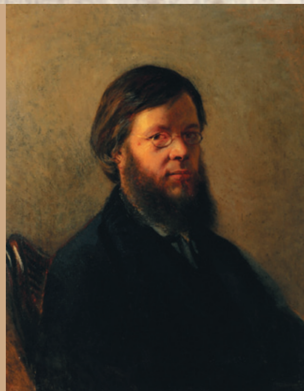
Александр Николаевич Пыпин (1833-1904)