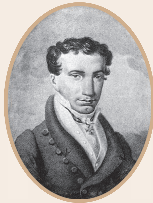
Александр Скарлатович Стурдза. Фототипия 1820-х годов. Неизвестный автор

Сам Стурдза так описывает этот эпизод: «Министр горячо вступался за мысли Лабзина, старался придавать им благоприятный смысл; но преткновения час от часу становились виднее и опаснее. Смирнов обличал, а я – наста-