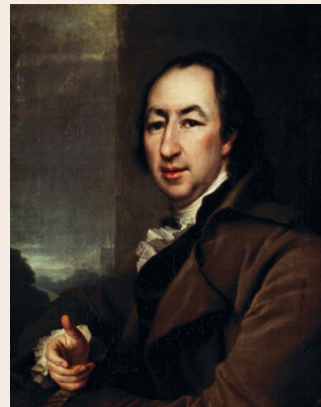
Николай Новиков – учитель Лабзина. Художник Д.Г. Левицкий

Невозможно предположить, что архимандрит Иннокентий сразу противопоставил себя всему этому кругу. Хотя, заметим, Сушков и не упоминает его в числе лиц, увлекавшихся упомянутыми модными авторами.