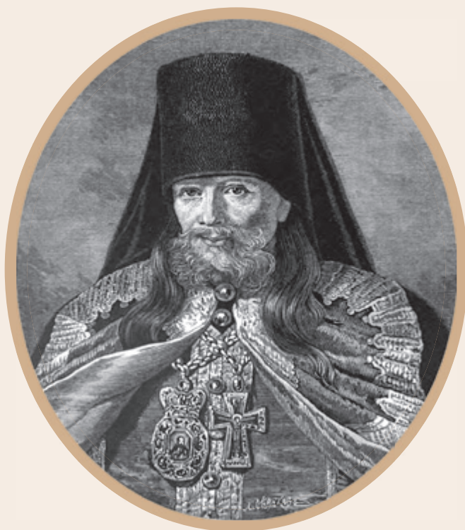
Архимандрит Фотий (Спасский)

Жмакин сомневается: точно ли Иннокентий мог адресовать Лабзину проклятия, да еще передавать их через его родственника? Скорее всего, содержание и стилистика приведенных цитат остаются на совести Фотия. Но сам факт общения на подобные темы Иннокентия и Лабзина представляется истинным.