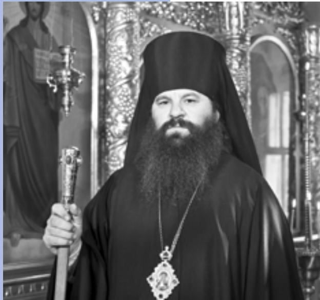
Епископ Саранский и Мордовский Варсофий в Иоанно- Богословском кафедральном соборе. 1991 г.

С владыкой Варсофием познакомились мы в 1988 г., когда праздновалось тысячелетие Крещения Руси. Я тогда снимал для свода памятников истории и культуры – в том числе, монастыри, храмы, а еще интересовался документальной фотосъемкой. И подумал, что просто обязан снять этот праздник. Но как попасть в церковь? Она была достаточно обособлена от общества. Тогда я через уполномоченного по делам религий при облизполкоме познакомился с епископом Серафимом (Тихоновым).