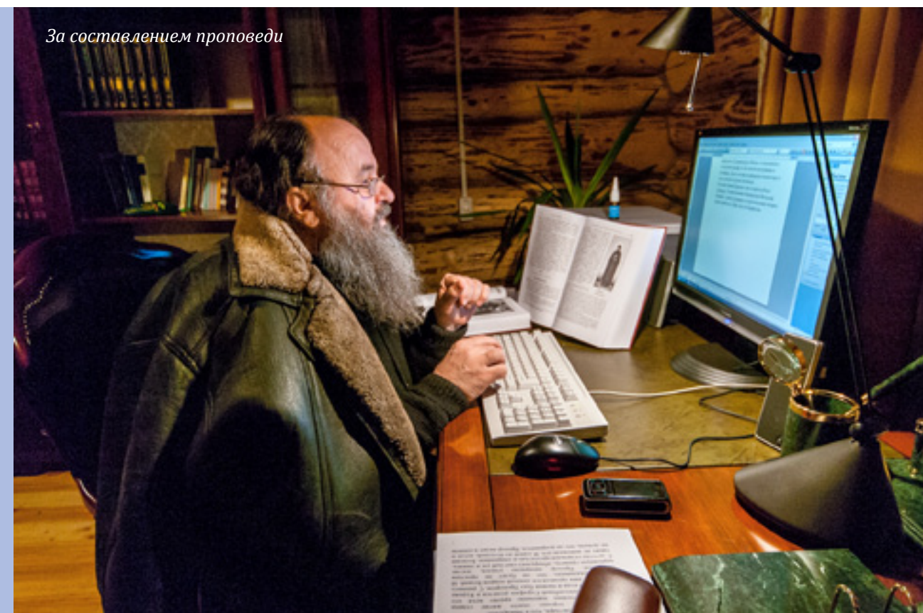
За составлением проповедей

Он любит посидеть с удочкой в редкие минуты отдыха. На его малой родине, в Малиновке Саратовской области, каждый год мы все после службы выезжаем на берег Хопра, а он один уплывает на лодочке порыбачить в тишине.