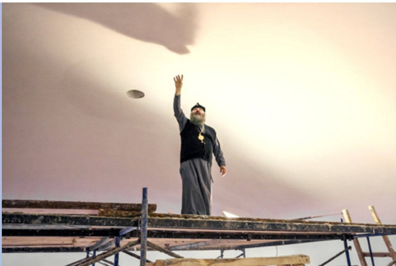
В строящемся Свято-Феодоровском кафедральном соборе Саранска. Под самыми сводами

нием иконостаса, приобретением церковной утвари. От Пензы до Саранска – всего 140 километров, и я иногда гонял туда на пару часов, одним днем. Когда приезжал, мы с владыкой первым делом шли на стройку. Вспоминается один случай: в 2005 г., когда коробка храма уже стояла, мы полезли наверх: поднимаемся выше и выше, сопровождающие нас батюшки один за другим отсеиваются, и на самой верхотуре остаемся только мы с владыкой. Последняя лесенка – шириной 40-50 сантиметров, прикрученная проволокой, и справа никаких ограждений – а вниз 30-40 метров. Архиерей полез – ну, а мне куда деваться? Сумку оставил, повесил на себя один фотоаппарат, и тоже полез!