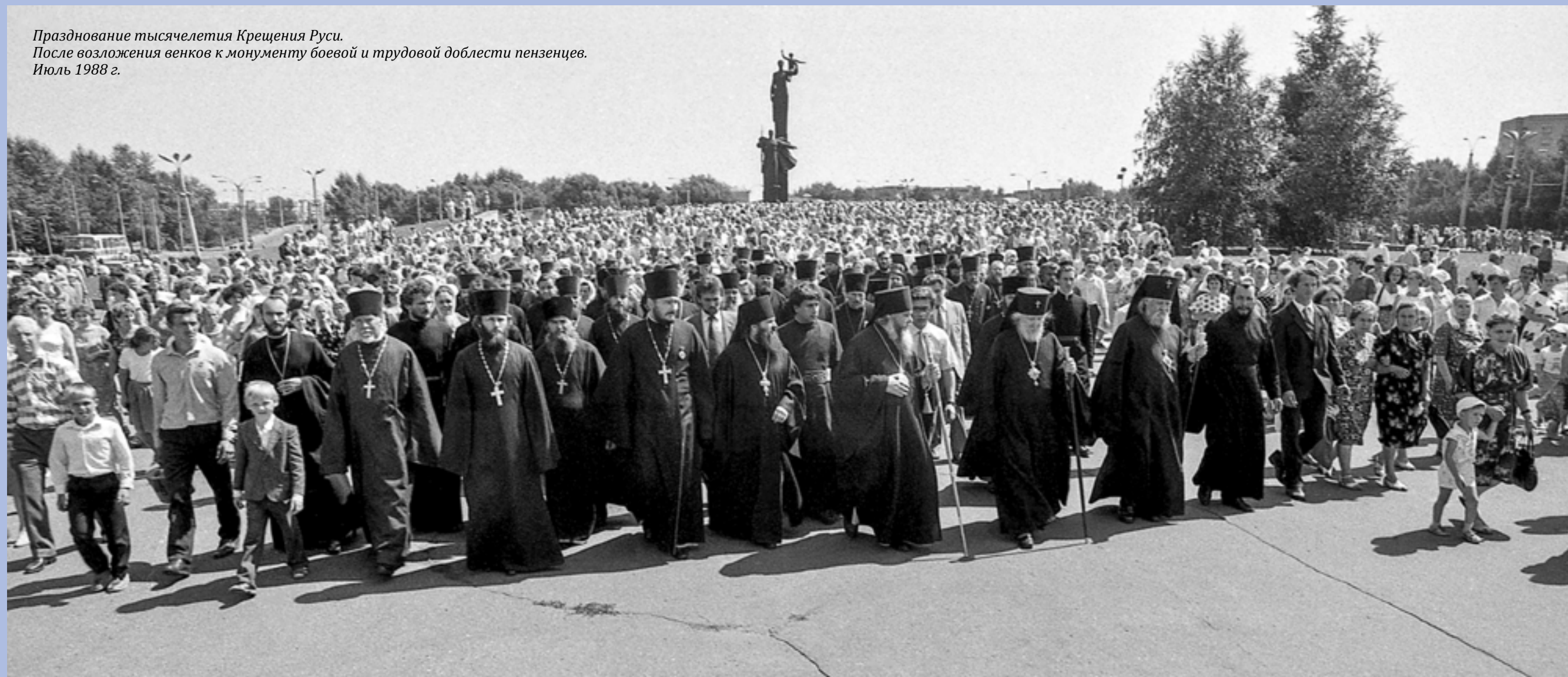
Празднование тысячелетия Крещения Руси. После возложения венков к монументу боевой и трудовой доблести пензенцев. Июль 1988 г.