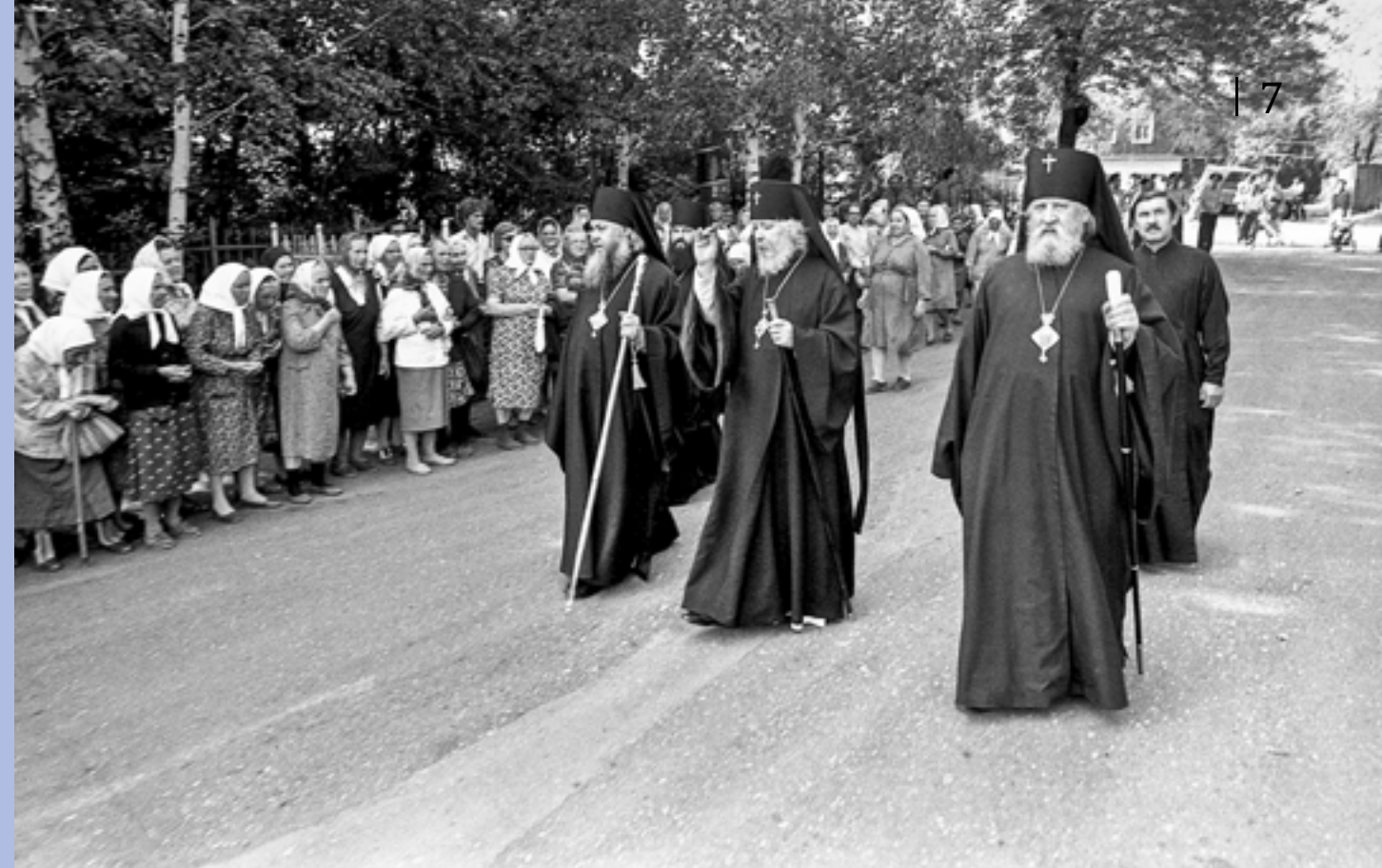
Празднование тысячелетия Крещения Руси. Архиепископ Куйбышевский и Сызранский Иоанн (в центре), епископ Пензенский и Саранский Серафим (слева), архиепископ Чебоксарский и Чувашский Варнава (справа) у Митрофановской церкви. 20 июля 1988 г.