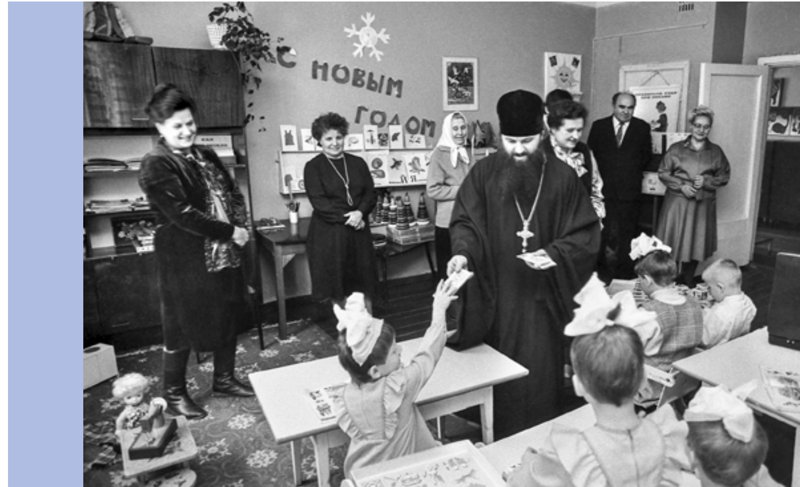
В пензенском детском доме. Рубеж 80-90-х гг.

чатал, утром владыке Серафиму привозил готовые фотографии – и так все несколько дней торжеств.