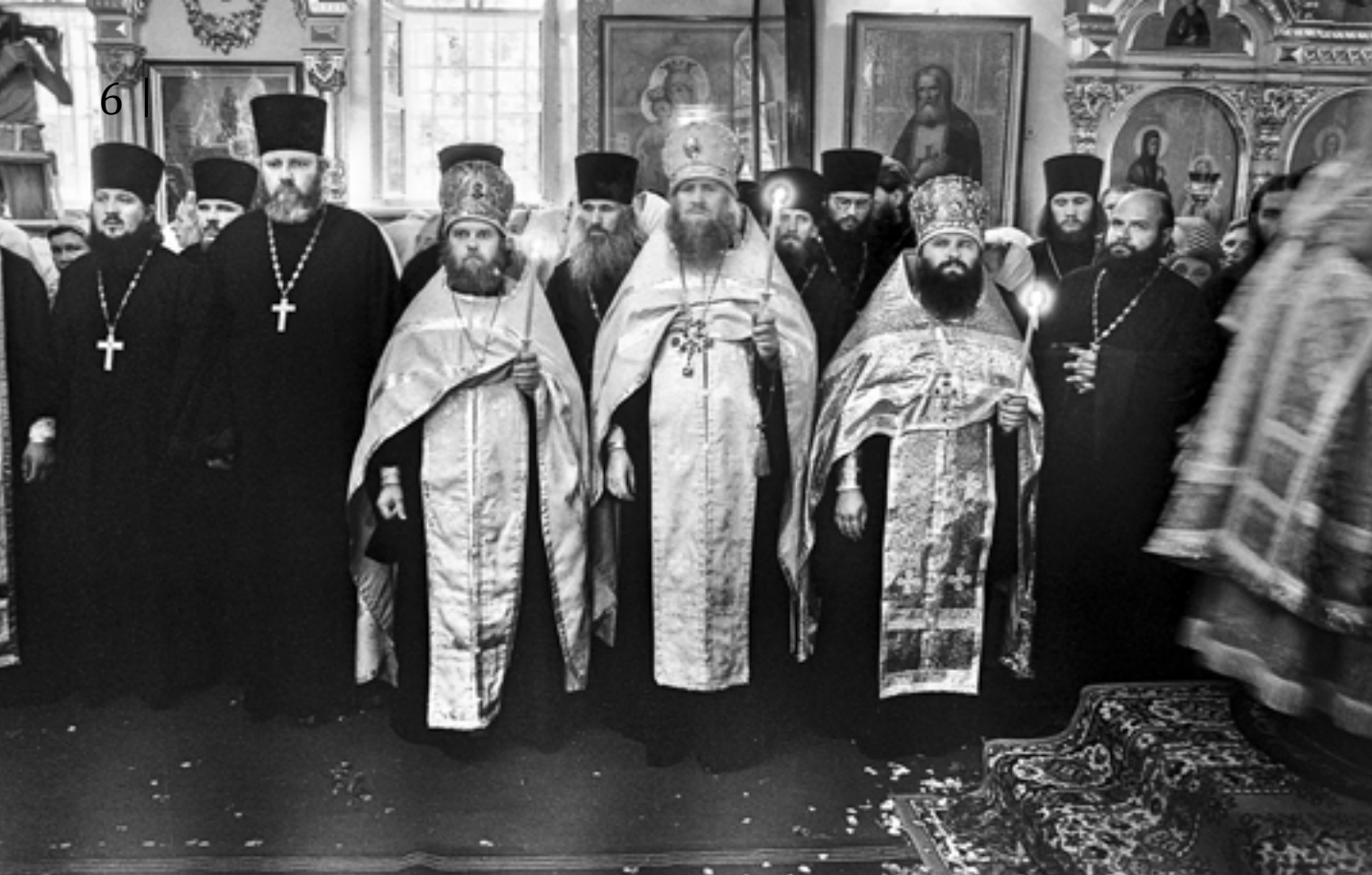
Архимандрит Варсонофий (в митре справа) за всеобщим бдением в Митрофановском храме Пензы. По правую руку от него – архимандрит Модест (Кожевников). Празднование тысячелетия Крещения Руси. 20 июля 1988 г.