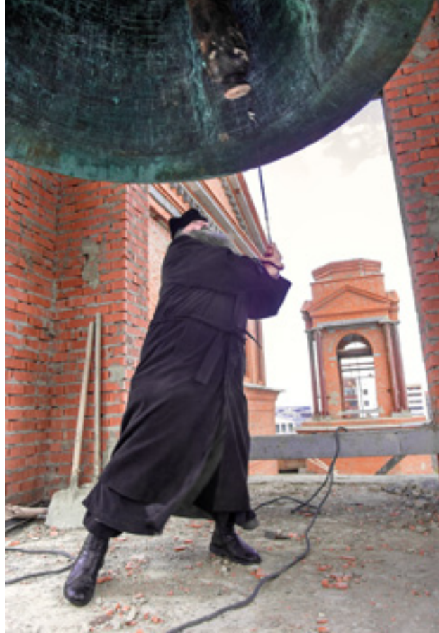
Строительство Свято-Феодоровского кафедрального собора Саранска. Первый удар колокола