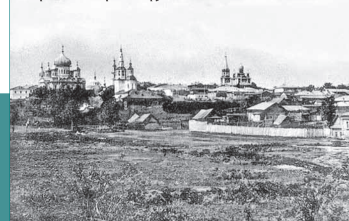
Саранск. Открытка рубежа XIX-XX вв.