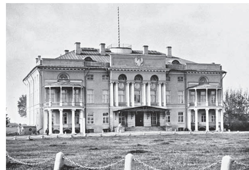
Александровский дворец в Москве, в Нескучном. Здесь, у графини Орловой-Чесменской, в мае-июне 1819 года останавливался свт. Иннокентий. Ныне – основное здание Российской Академии наук. Фото рубежа XIX-XX вв.