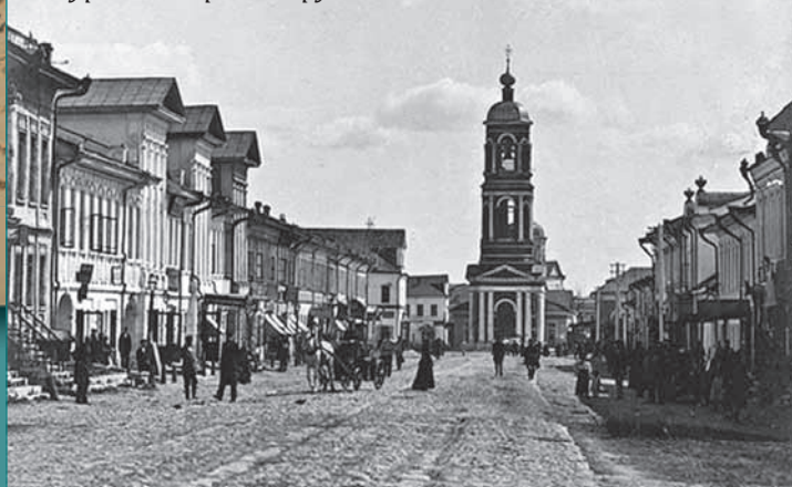
Муром. Открытка рубежа XIX-XX вв.