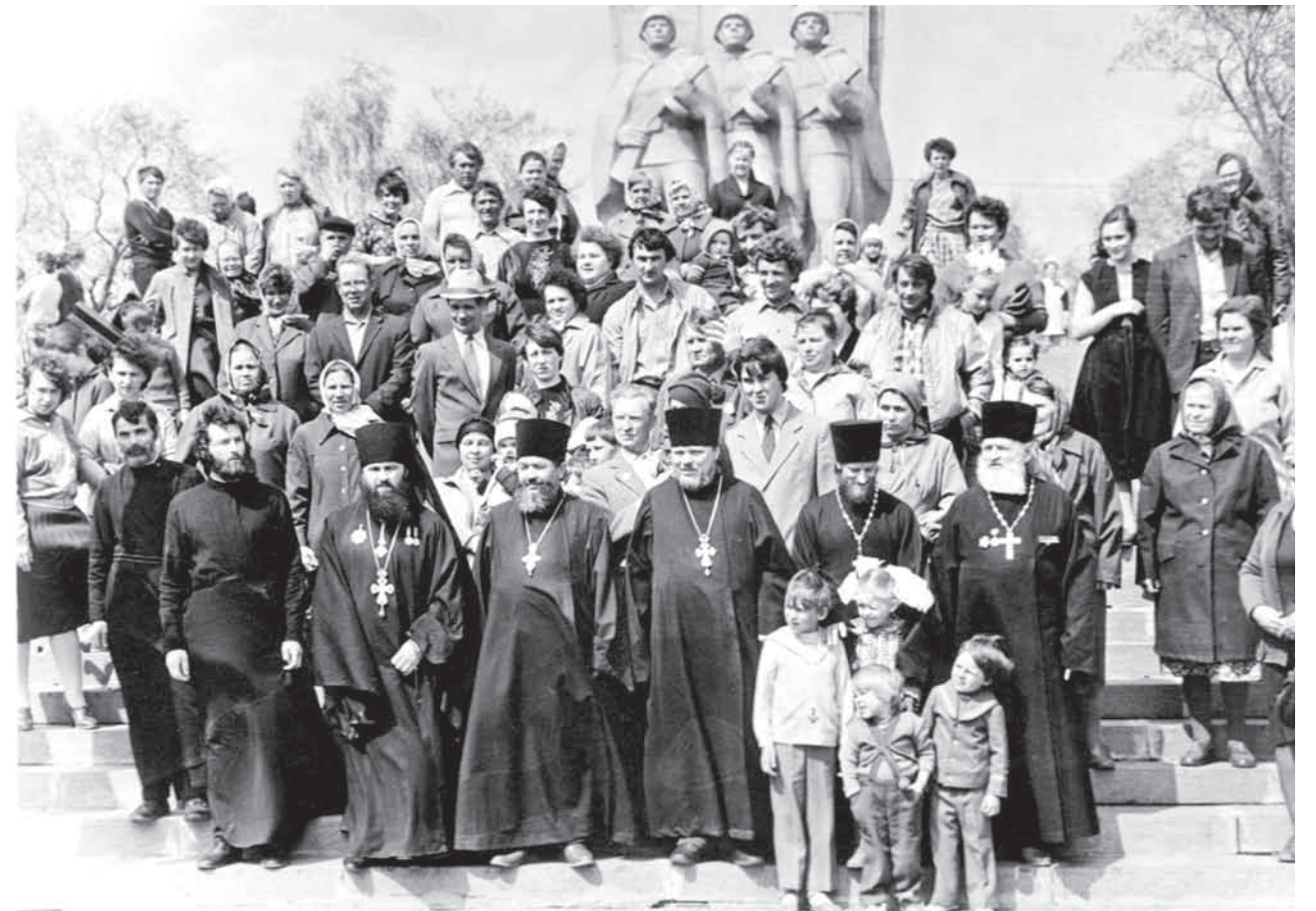
На Холме Славы в Кузнецке. Второй слева в первом ряду, в клобуке, – архимандрит Варсонофий (Курганов), настоятель Казанской церкви Кузнецка, ныне – митрополит Санкт-Петербургский и Ладужский. 1987 или 1988 год