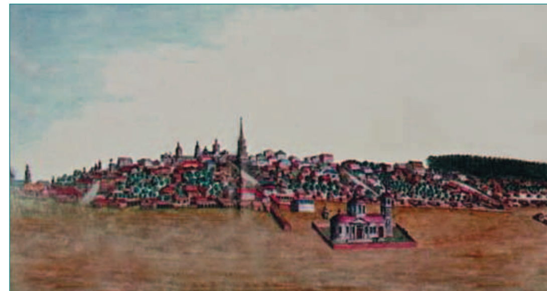
Вид на Пензу с севера. Рисунок Филиппо Пизани, 1814. Выявлено и впервые опубликовано в Пензе С.В. Белоусовым

Дорогою очень много утешения доставила мне псалтирь ваша! О любезная псалтирь! Как мне с нею расставаться, чтобы возвратить Вашему сиятельству!