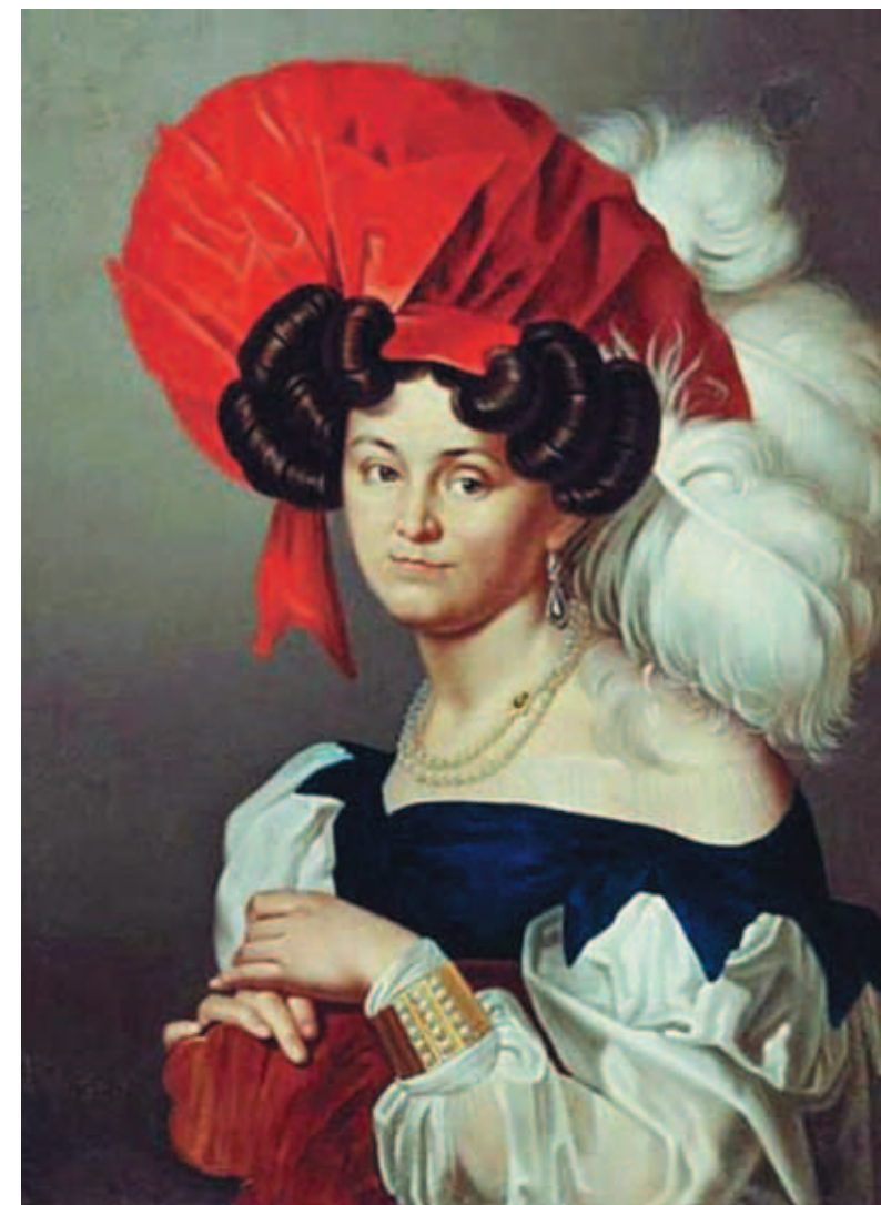
Графиня А. А. Орлова-Чесменская. Акварель П.Ф. Соколова, 1830-е годы

Конечно, письма еще нуждаются в дальнейшем исследовании и детальном комментарии.