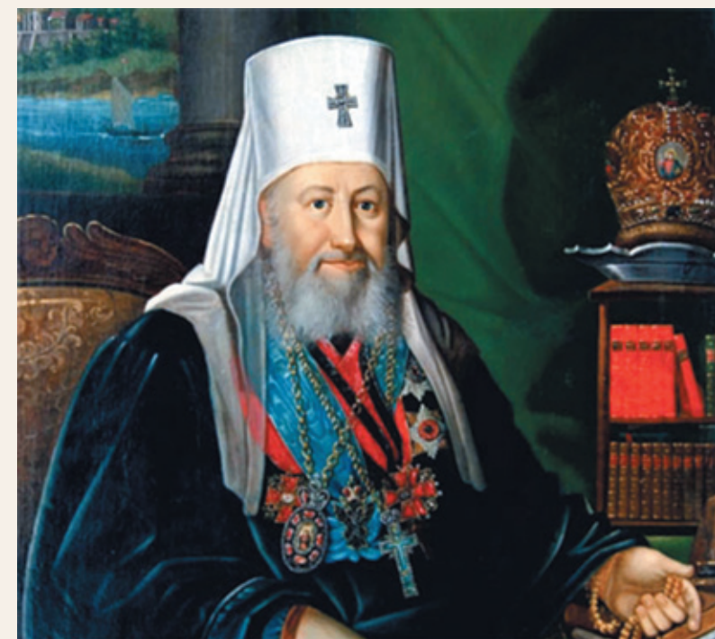
Митрополит Евгений (Болховитинов). Портрет

Настойчивость его и железная сила воли были непреклонны. Его характер выражался и в его наружности. Высокий, худощавый, с большими темными глазами, светившимися умом и энергиею, с голосом громким, звучным, который возвышался до громового – когда епископ был под влиянием сильного волнения, тогда собеседники невольно вздрагивали. Большею частью епископ был угрюм