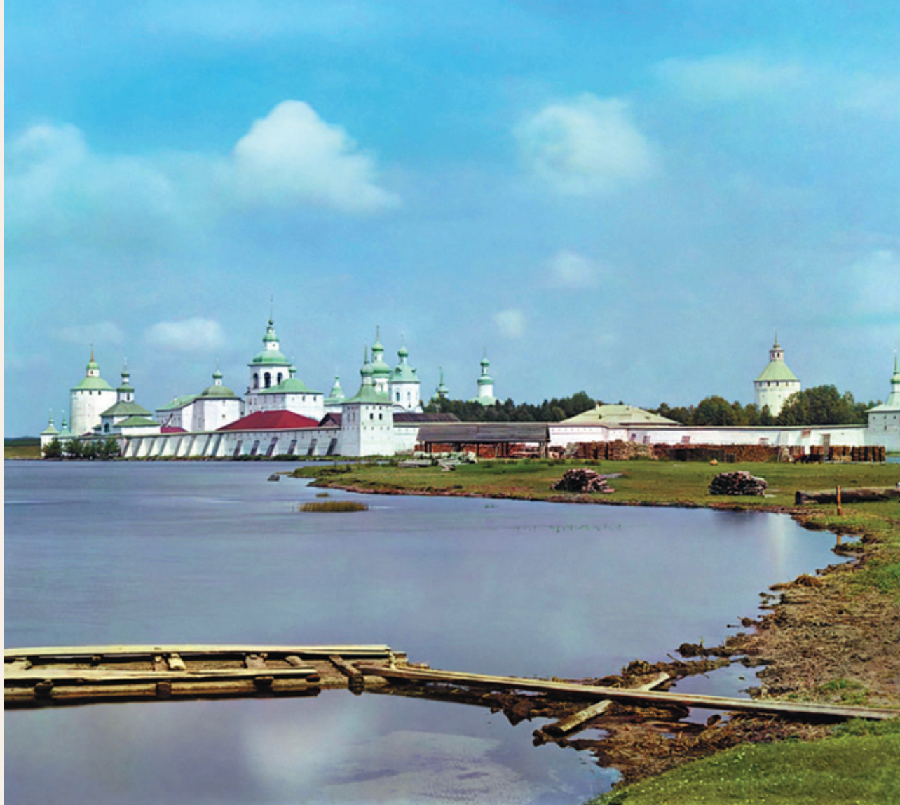
Кирилло-Белозерский монастырь. Фото С. М. Прокудина-Горского 1909 года

рархии». На самом же деле он мечтал лишь о строгом монашеском уединении, так как, отправляясь из Пензы, отослал в Св. синод все документы, забранные оттуда для дополнения своего труда, и исправленный печатный экземпляр истории.