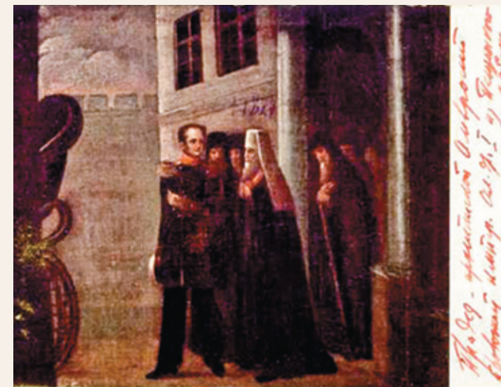
Подпись гласит: «Прадед – архиепископ Амвросий провожает императора Александра I из Пензенского собора»

ливался у икон, коротко назначал, сколько государь должен положить поклонов. Может быть, он надеялся навлечь на себя неудовольствие государя, чтобы быть уволенным от управления епархией, которое его очень тяготило. Но он, несмотря ни на что, произвел на государя впечатление человека хотя сурового, но справедливого.