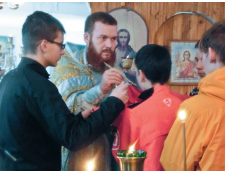
Лагерь «Осенний призыв-2014» в с. Павло-Куракино. Ноябрь 2014 года

матическим нормам, но по каким-то политическим или иным взглядам Церковь раскололась. А бывает и так, что еще и в догматическое учение вкрадываются какие-то изменения – это уже ересь. Псевдоправославные организации образованы совершенно неграмотными в отношении религиоведения людьми, и каждый чему хочет, тому и учит. Внешне вроде