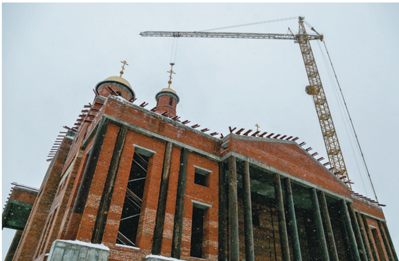
Подъем центрального купола на Спасский кафедральный собор. 28 декабря 2014 года

возможностей для нашего населения, в том числе, организовав какие-то спортивные клубы и лагеря.