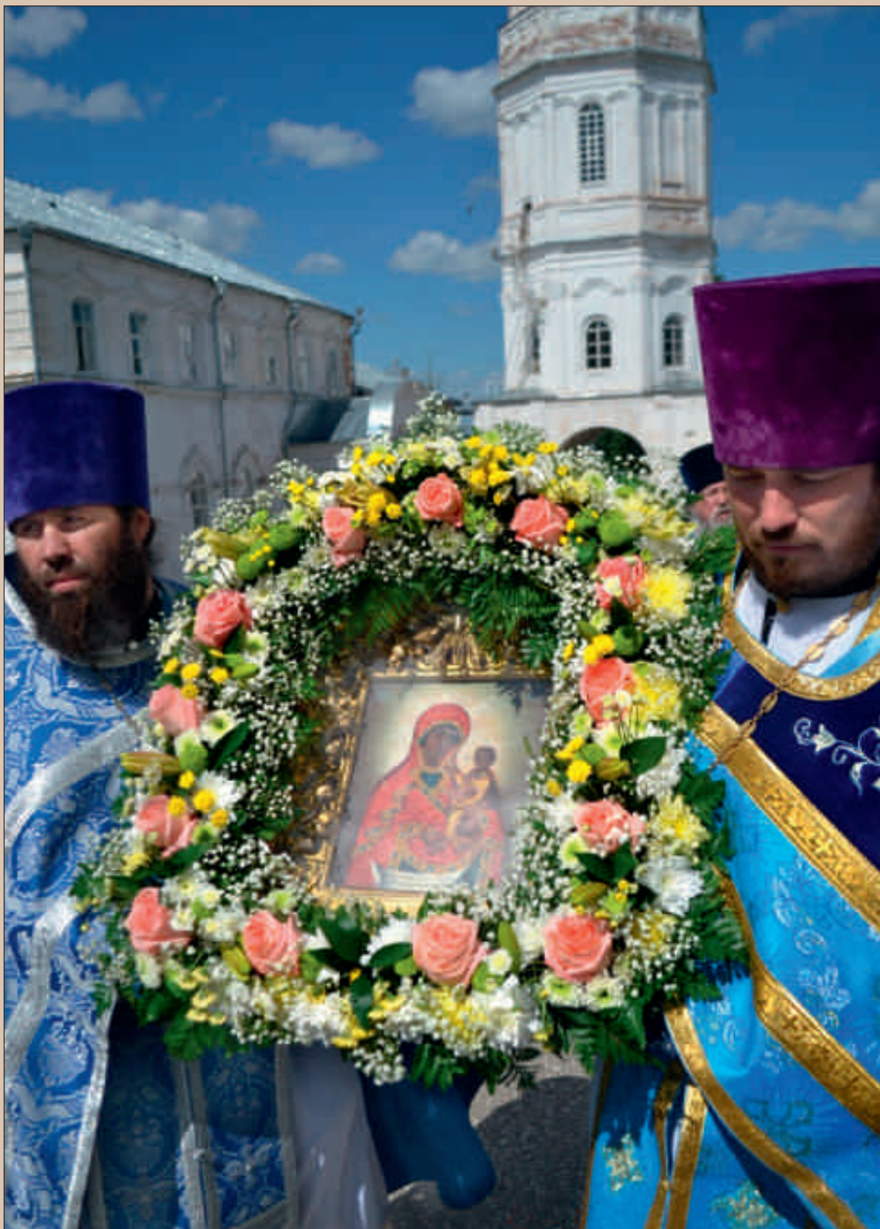
Крестный ход вокруг Тихвинского собора с Керенской-Тихвинской иконой Божией Матери. С. Вадинск. 9 июля 2014 г.