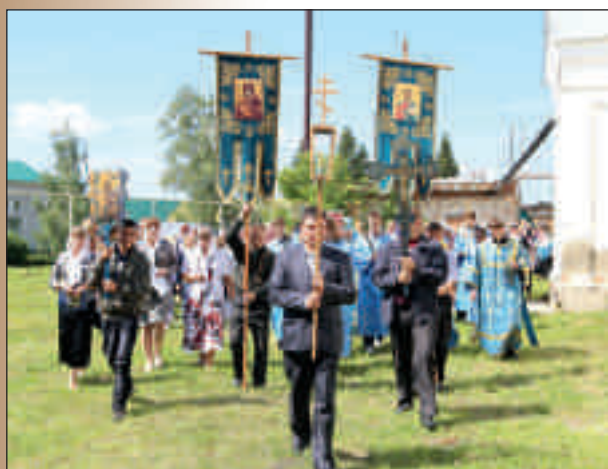
Праздник Боголюбской иконы Божией Матери в с. Маис. 1 июля 2014 г.