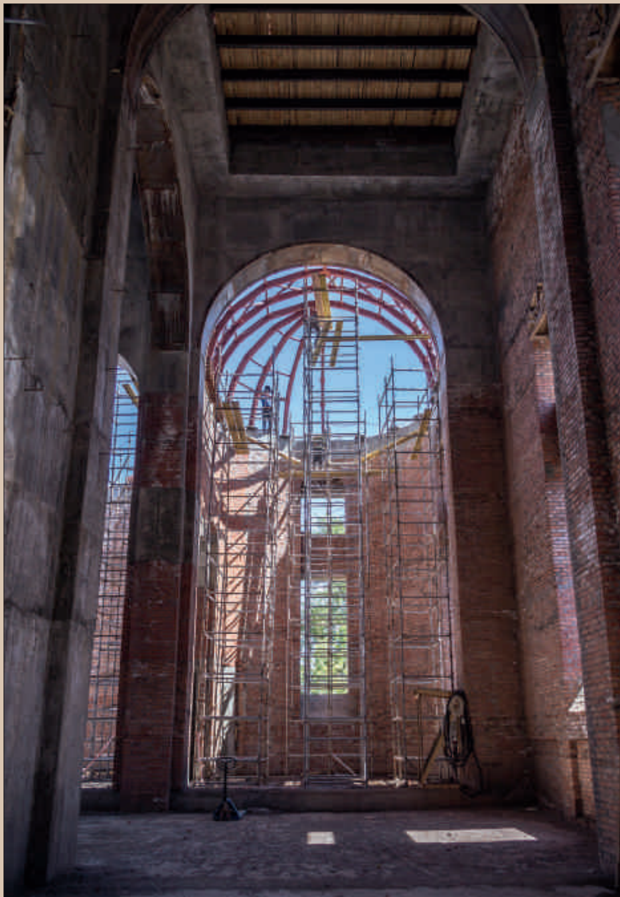
На стройке Спасского кафедрального собора. Монтаж свода алтаря. 1 июля 2014 г.