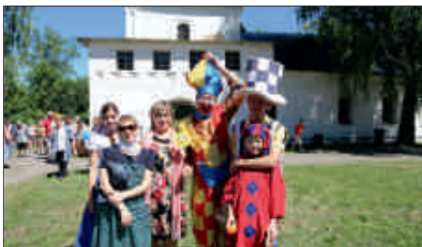
Сверху: епископ Нестор на великом освящении храма прп. Сергия Радонежского в Покровском Шиханском женском монастыре. 5 июля 2014 г.