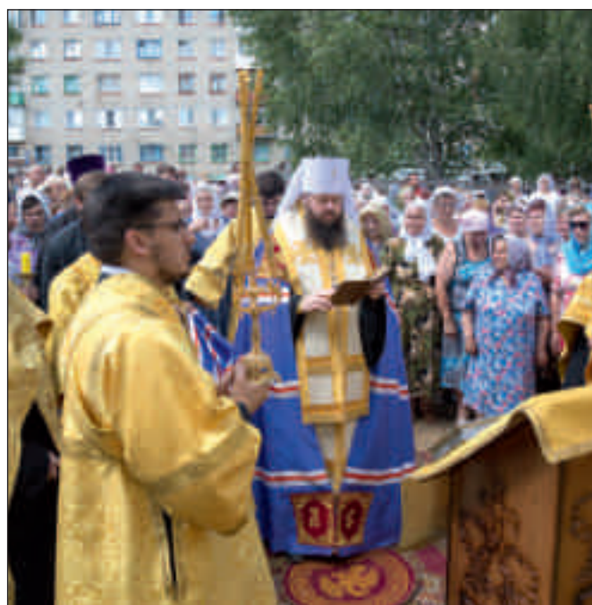
Освящение центрального купола и креста на Александро-Невский храм в г. Каменка. 15 июля 2014 г.

крыть крышу и построить котельную, после чего рабочие приступят к чистовой отделке. 12 сентября, в день перенесения мощей Александра Невского, в храме планируется провести первую службу, а на 6 декабря, день памяти святого, намечено освящение.