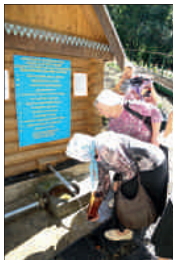
Никольский родник в с. Матвеевка.