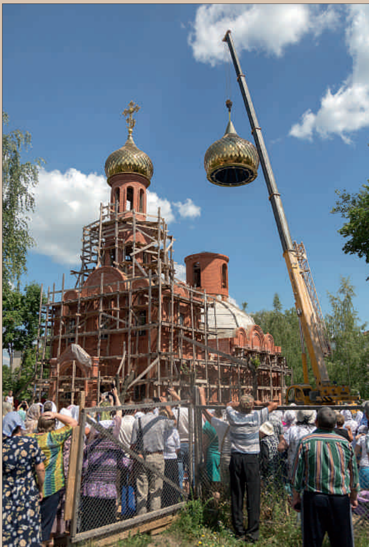
Подъем купола на Александро-Невский храм в г. Каменка. 15 июля 2014 г.