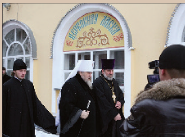
Божественная литургия в Успенском кафедральном соборе. Митрополит Вениамин прощается с духовенством, сотрудниками епархии, представителями власти, журналистами, прихожанами. 5 января 2014 года