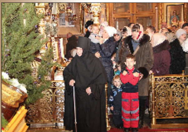
Божественная литургия в Успенском кафедральном соборе Пензы. 19 января 2014 года