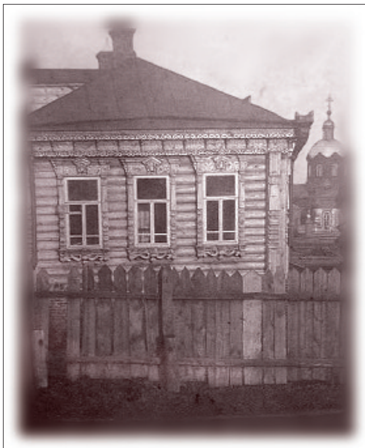
На снимке виден прежний лунинский храм – церковь Всемилошного Спаса села Трубетчины (ныне часть Лунина). Снесен в 40-х гг. Единственное сохранившееся изображение. Найдено священником Павлом Кургановым. Публикуется впервые.