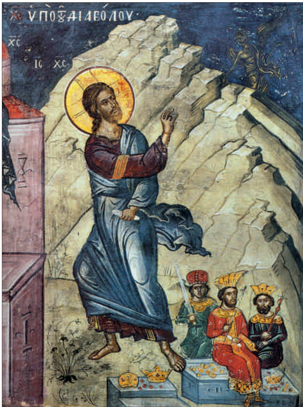
Искушение Христа диаволом в пустыне. XVI в. Греция. Афон. Монастырь Дионисиат