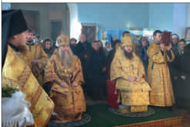
Всенощное бдение в Вознесенском кафедральном соборе Кузнецка. 23 февраля 2013 г.