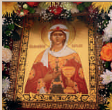
Святая великомученица Варвара.

Икона. Димитриевская церковь. Пенза. 17 декабря 2012 г.