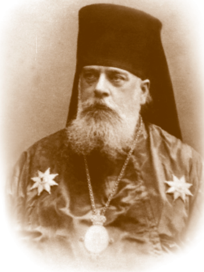
Священномученик Серафим Чичагов

мало известная кузнечанам. Правящий архиерей тепло поблагодарил собравшихся на молитву и рассказал, кем для него является святой Серафим: «Самое главное для меня – пример его мужества. Как человек одарённый, он не потерял простого человеческого достоинства. Никогда не скрывался и не убегал от подвига, который готовил для него Господь. Я искренне говорю о том, что пример священномученика Серафима Чичагова является для меня примером мужества и стойкости во Христе».