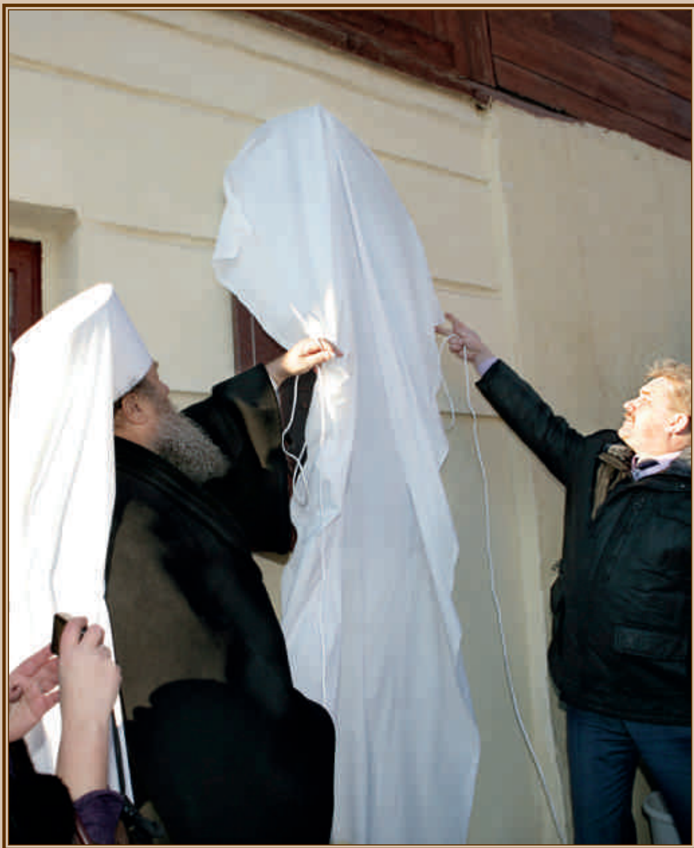
Митрополит Пензенский и Нижнеомовский Вениамин и председатель Правительства Пензенской области Юрий Иванович Кривов открывают мемориальную доску М.М. Киселёвой на улице Красной в Пензе. 19 декабря 2012 г.