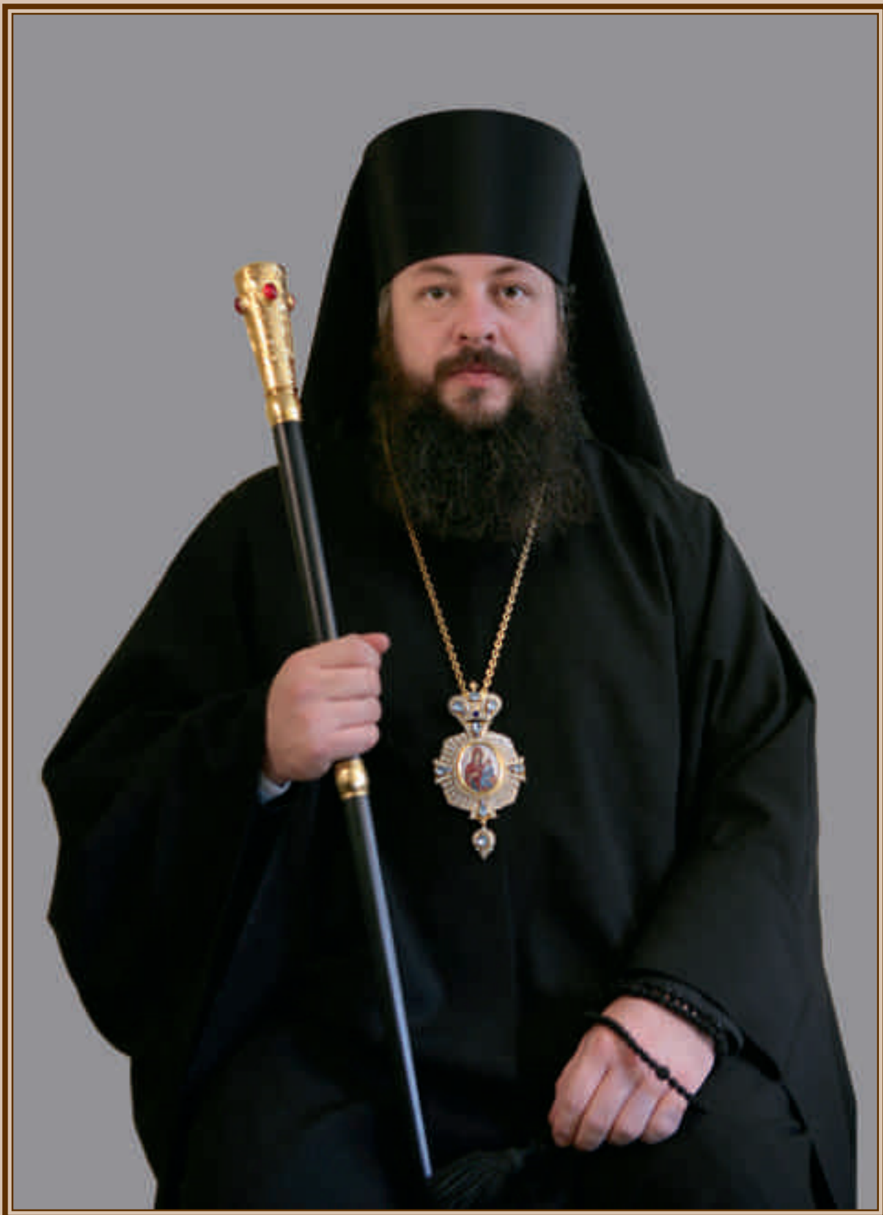
Преосвященный Серафим, епископ Кузнецкий и Никольский