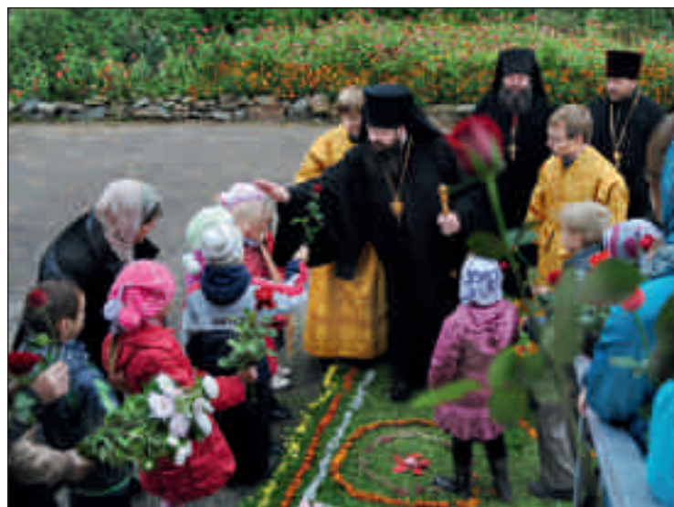
Митрополит Вениамин, глава администрации г. Кузнецка С.А. Златогорский, представители власти поздравили епископа Серафима со вступлением в управление Кузнецкой епархией. 21 сентября 2012 года