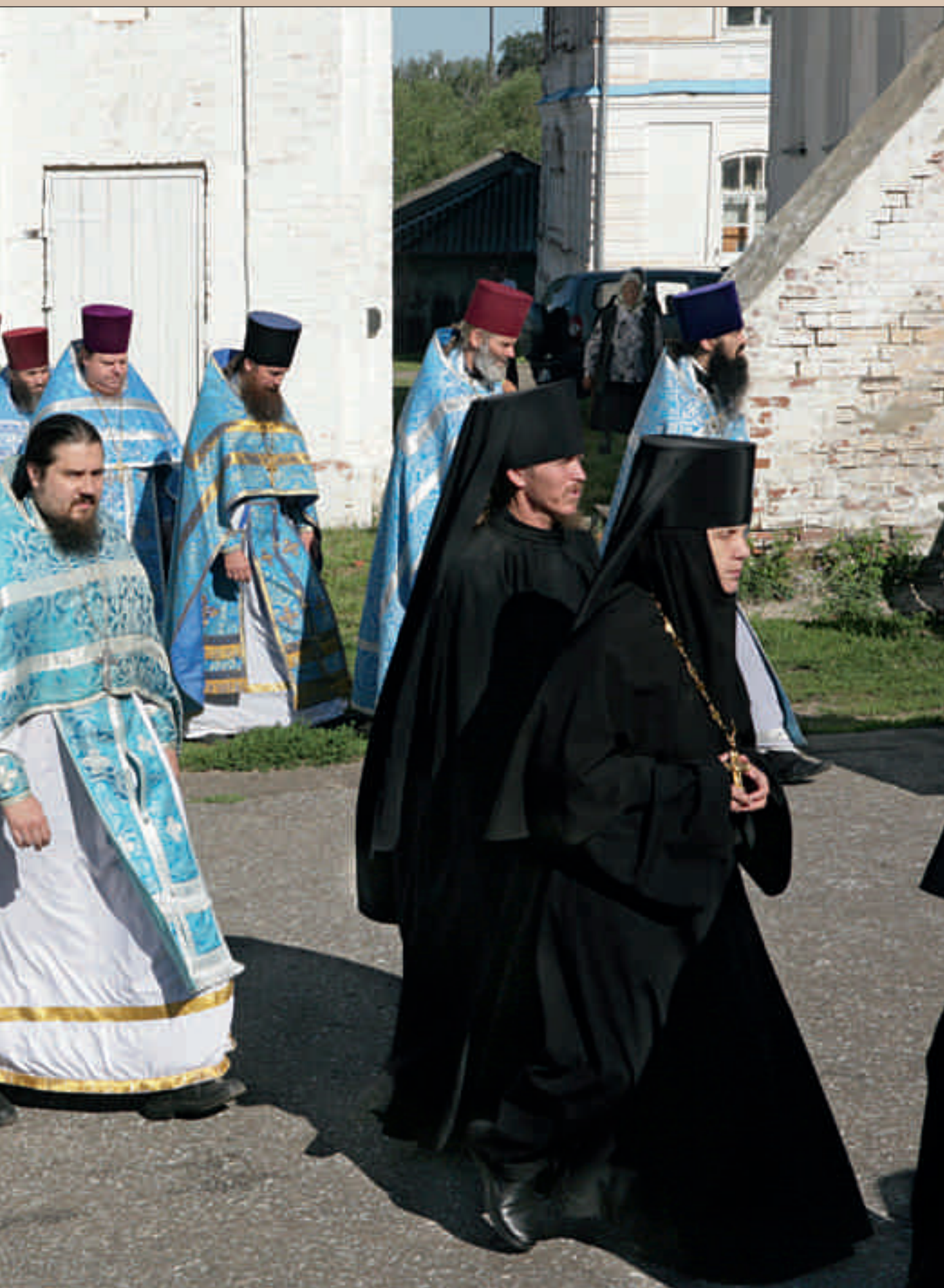
Крестный ход в Тихвинском Керенском монастыре. Райцентр Вадинск. 9 июля 2012 года