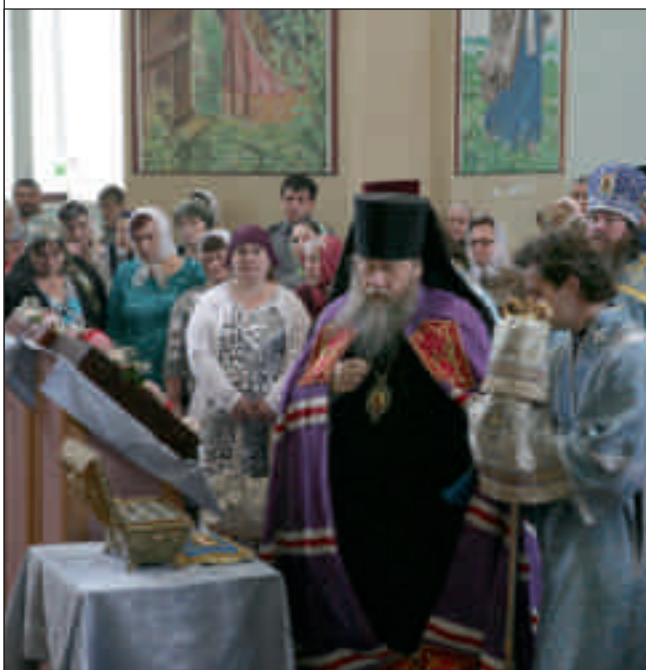
Боголюбская церковь села Маис Никольского района