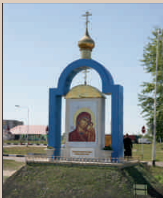
Придорожная икона. Город Кузнецк

В семейную жизнь – с Божиим благословением ..... 37