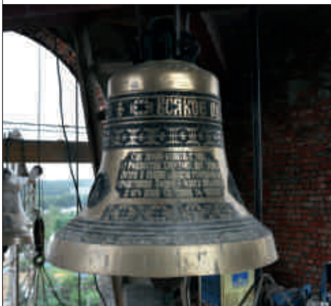
Освящение купола и креста колокольни храма Петра и Павла в микрорайоне Арбеково г. Пензы. 27 июня 2012 года