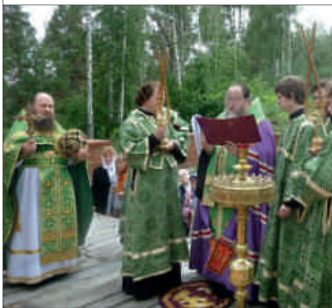
Шиханский монастырь в Ахматовке Никольского района. Вид на церковь

С. 12–13: Закладка нового храма в обители. 9 июня 2012 года