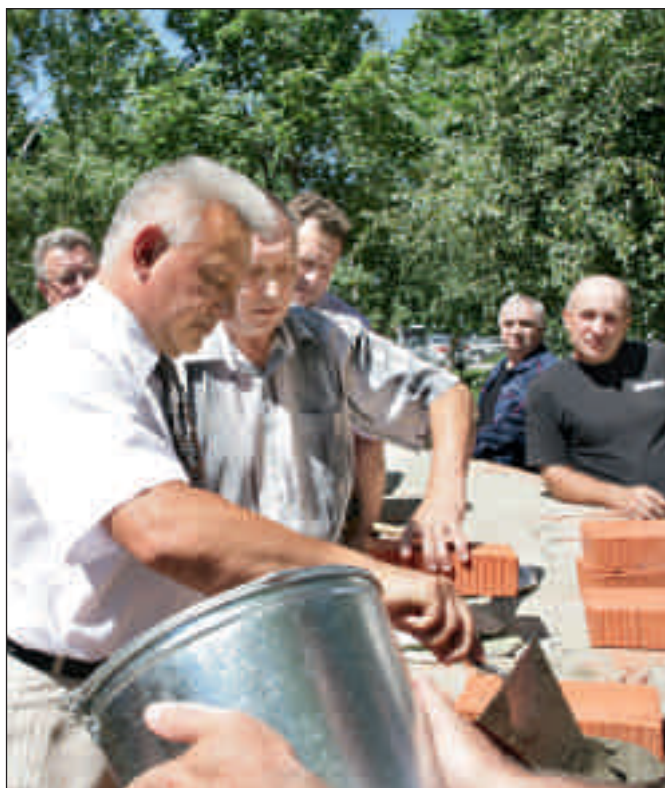
С. 24–25: Закладка храма во имя Александра Невского в Каменке. 23 июня 2012 года

власть будет способствовать появлению новых храмов, а не ресторанов или казино. Для нашего города сегодня исторический день, и для каменцев – большая радость, потому что вместе с любовью к Богу к городу приходит процветание. Хочу всех вас поздравить с этим знаменательным событием и вручить будущему храму икону Христа Спасителя. А ко всем каменцам хочу обратиться с просьбой активнее помогать строительству, Бог больше даст, откликаясь на нашу жертву. Мы можем и к ноябрю храм построить, в 2-3 смены станем работать – и подведём храм под купол.