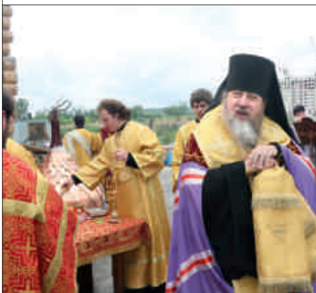
Епископ Пензенский и Кузнецкий Вениамин освящает купола и кресты храма мученицы Наталии в дальнем Арбеково г. Пензы. 11 июня 2012 года