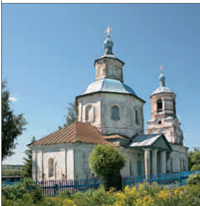
Архиерейское богослужение в Спасо-Преображенской церкви с. Николо-Пёстровка Иссинского района. 21 мая 2012 года