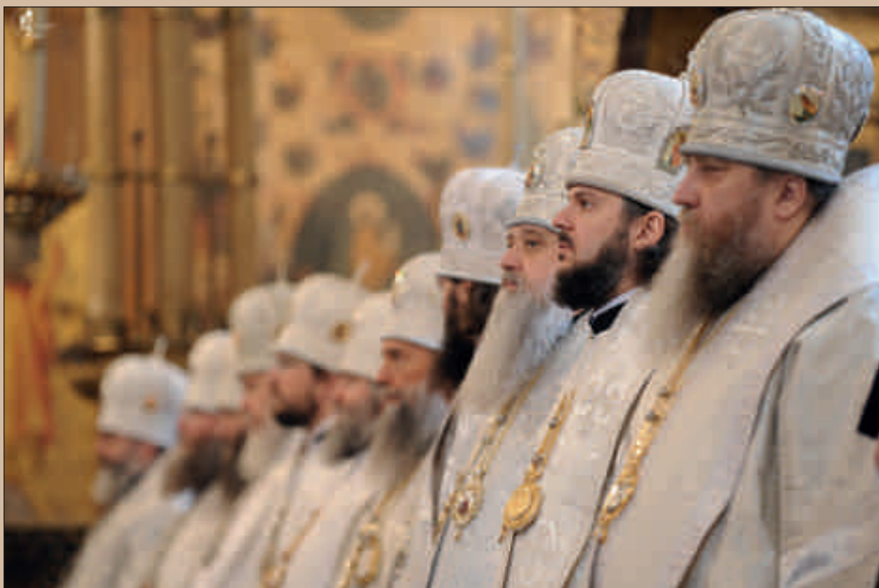
С. 26–27: Патриаршая служба в Успенском соборе Московского Кремля. 24 мая 2012 года