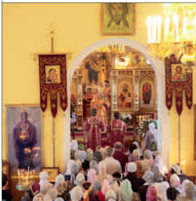
Архиерейское богослужение в Никольской церкви микрорайона Терновка г. Пензы. 22 мая 2012 года