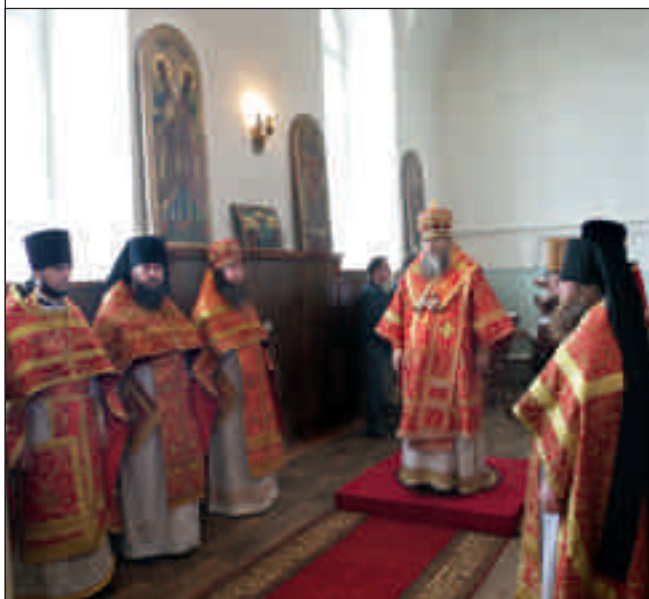
Архиерейское богослужение в Троицкой церкви с. Кевдо-Мельситово Каменского района. 12 мая 2012 года