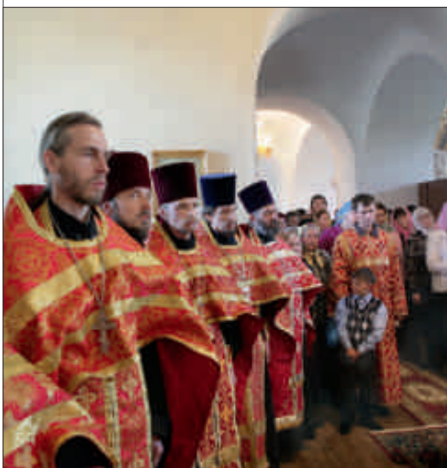
Последний молебен перед великими святынями – Ризой и Гвоздём Господними. Димитриевская церковь г. Каменки. 4 мая 2012 года

десять дней тысячи и тысячи людей смогли к ним подойти и поклониться. Давайте постараемся сохранить благодать, которую каждый получил от соприкосновения со святынями.