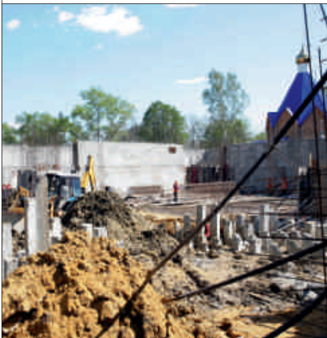
Строительство Спасского собора. Руководители города на строительной площадке. 3 мая 2012 года