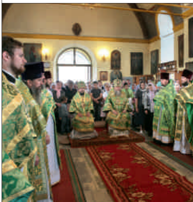
Архиерейское богослужение в Троице-Сергиевской церкви с. Соловцовка Пензенского района. 31 мая 2012 года