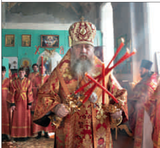
Архиерейское богослужение в Михайло-Архангельской церкви с. Симбухово Мокшанского района. 13 мая 2012 года