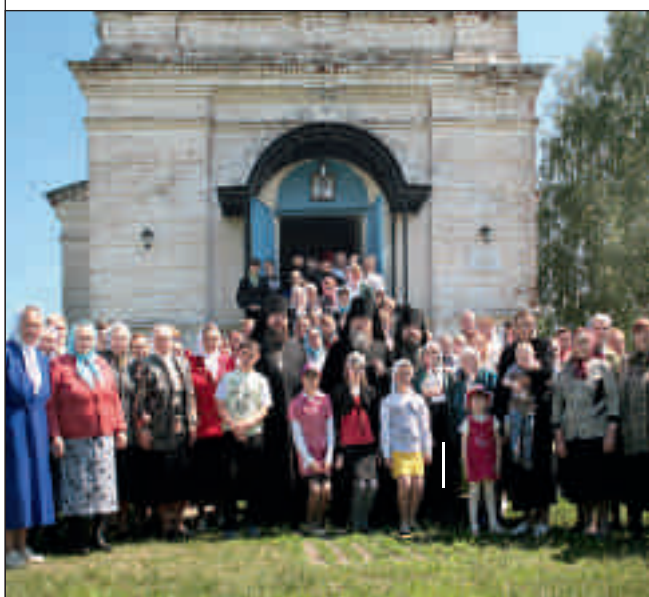
Архиерейское богослужение в Спасо-Преображенской церкви с. Николо-Пёстровка