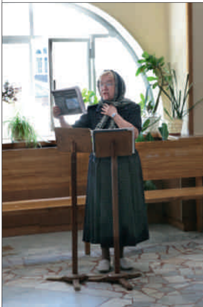
Защита дипломных работ выпускников православных курсов при Успенском кафедральном соборе Пензы. 20 мая 2012 года