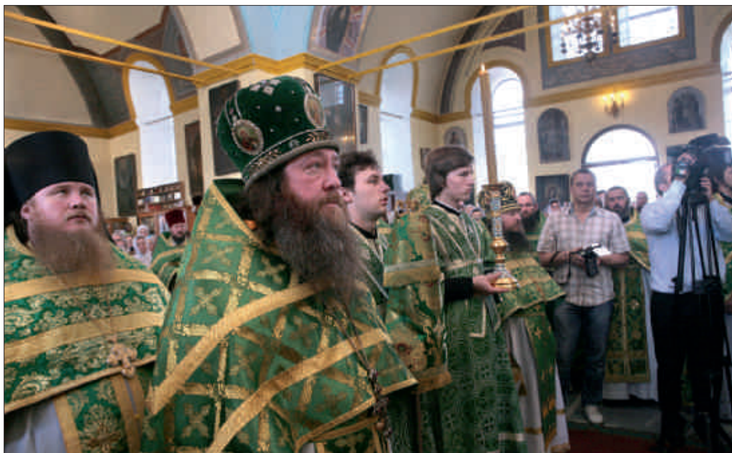
Архиерейское богослужение в Троице–Сергиевской церкви с. Соловцовка Пензенского района. 31 мая 2012 года