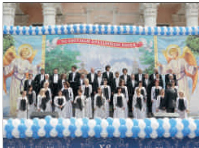
Епископ Вениамин среди участников праздничного концерта Выступление Пензенской губернаторской симфонической капеллы под управлением В.В. Каширского. Советская площадь г. Пензы. Светлая суббота. 21 апреля 2012 года

– Я сердечно поздравляю всех с великим радостным праздником Святой Пасхи и приветствую вас пасхальным возгласом: Христос воскрес!