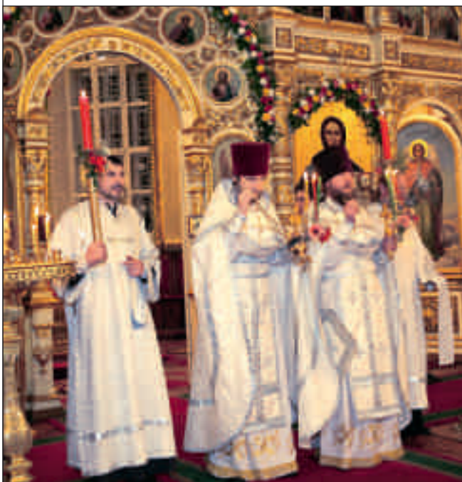
Начало Светлой заутрени. Крестный ход. Первое пасхальное приветствие. 14–15 апреля 2012 года