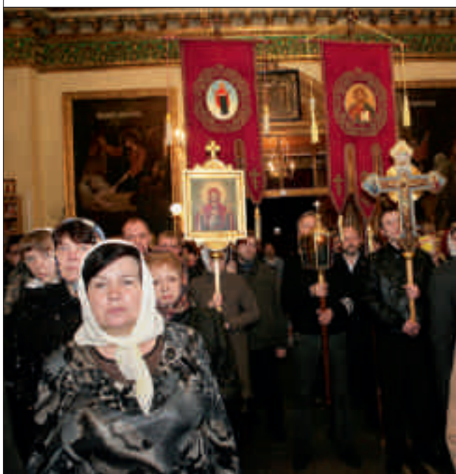
Духовенство уносит Святую Плащаницу в алтарь. Начало Крестного хода. Успенский кафедральный собор. 14 апреля 2012 года

домой. Для тех, кто не смог ночью прийти на пасхальное богослужение, в храмах, имеющих более одного престола, Божественные праздничные литургии по благословению правящего архиерея совершались утром – в 7 и 9 часов. На всех праздничных богослужениях зачитывали послания Святейшего Патриарха Кирилла и Преосвященного епископа Вениамина.