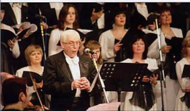
Митрополит Волоколамский Иларион открывает выступление Пензенской губернаторской симфонической капеллы

Симфоническая капелла исполняет «Страсти по Матфею» митрополита Илариона (Алфеева). 5 апреля 2012 года