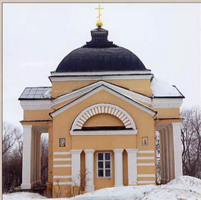
Церковь во имя преподобной Марии Египетской. Государственный Лермонтовский музей-заповедник «Тарханы». 2012 год

Без любви?.. (Из письма к сыну) ..... 40