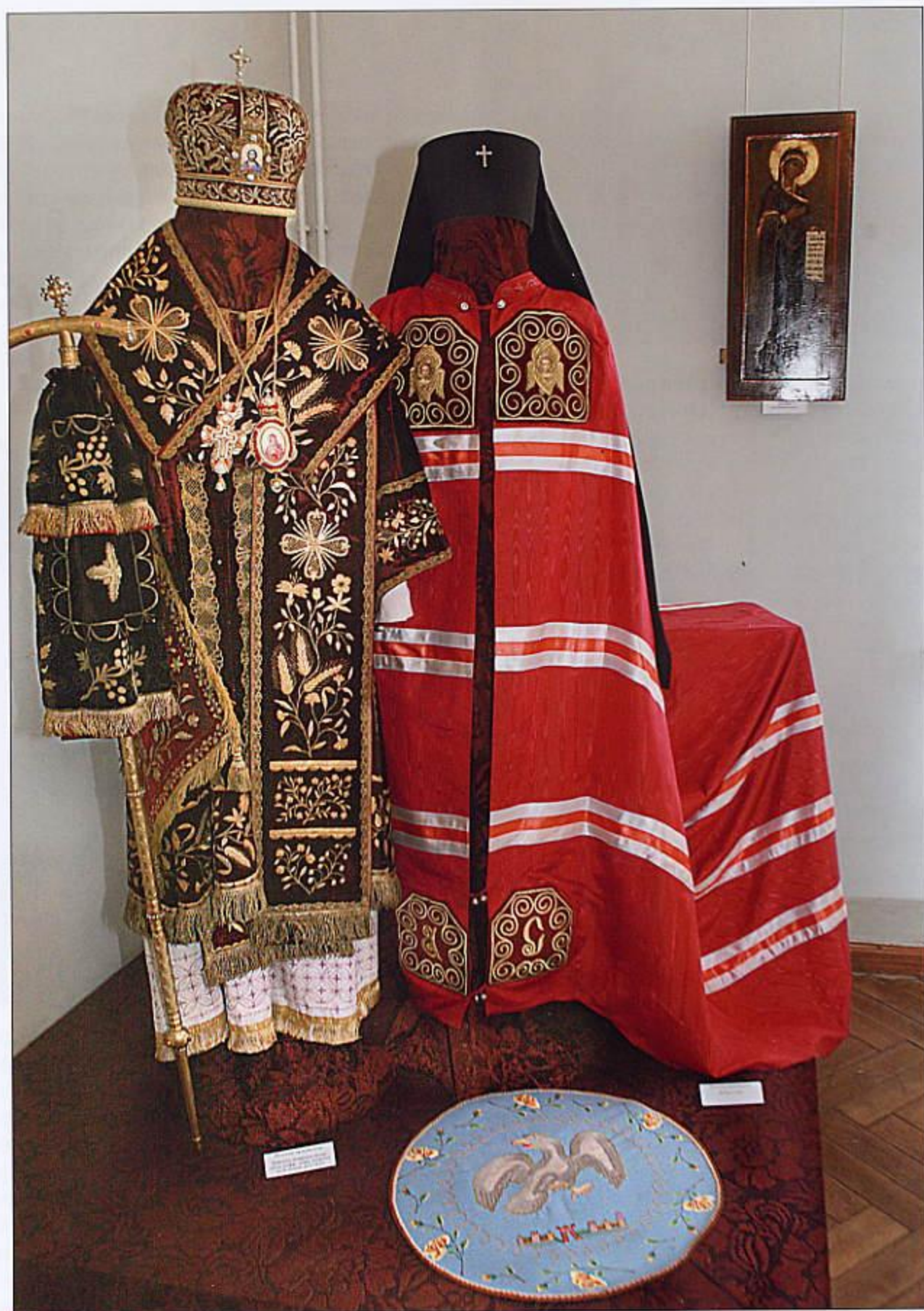
Архиерейские облачения, представленные на выставке в Картинной галерее