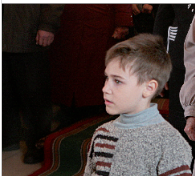
Божественная литургия в Благовещенской церкви. 7 апреля 2011 года