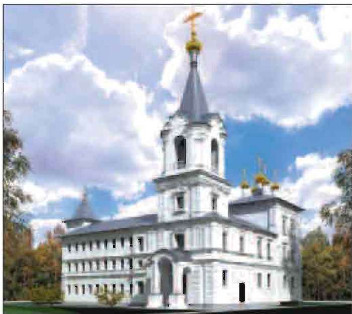
Эскизный проект архитектурного комплекса Спасо-Преображенского монастыря. Архитектурно-строительная мастерская Л.М. Ходоса. 2010 год

Спасо-Преображенская обитель вновь возрождается. Здесь вновь теплится лампада монашеской молитвы, совершаются божественные службы, иноки проходят послушания. И как согласно возрождение монашеской обители с возрождением главной святыни Пензы – Спасского кафедрального собора. Оба святых места посвящены Спасителю, Господу нашему Иисусу Христу. И возрождение этих святынь – залог возрождения Святой Руси!