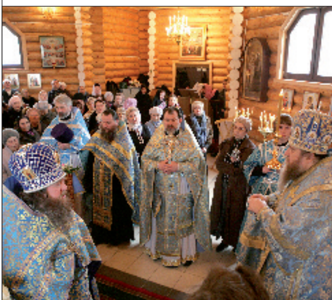
Церковь Благовещения Пресвятой Богородицы. Пенза. Советская площадь

Божественная литургия в Благовещенской церкви. 7 апреля 2011 года