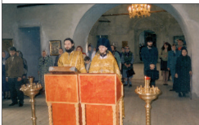
Архиепископ Пензенский и Саранский Серафим (Тихонов) совершает первую службу во вновь открытой Преображенской церкви Пензы. 18 августа 1995 года