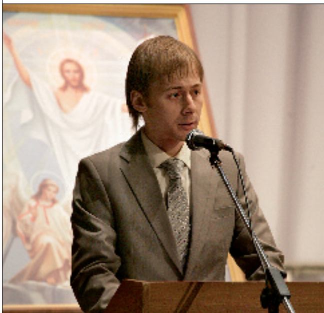
Епископ Пензенский и Кузнецкий Вениамин и епископ Бронницкий Игнатий