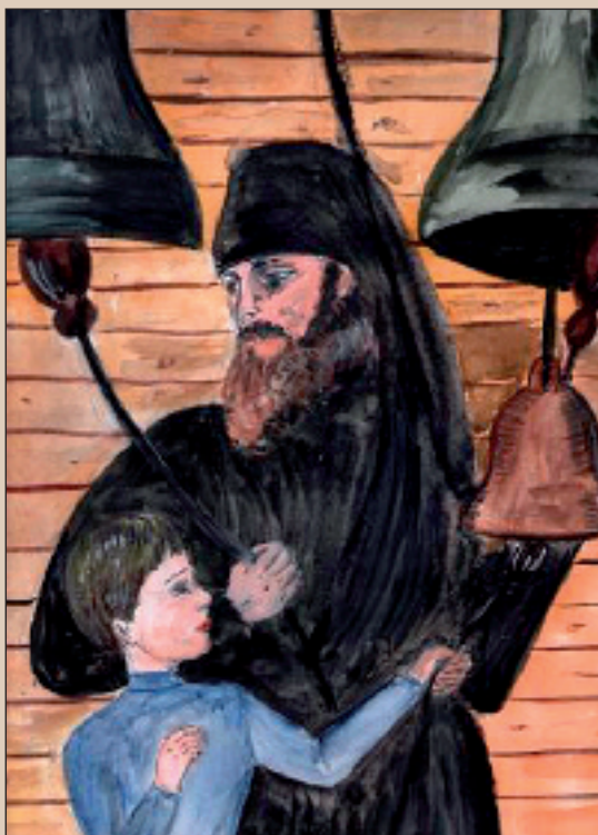
«Благовест». Рисунок. Дмитрий Демидов. Город Спасск