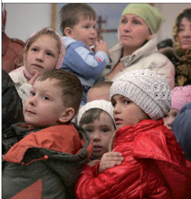
Церковь Космы и Дамиана с. Махалино Божественная литургия в Космодамиановской церкви. 16 апреля 2011 года