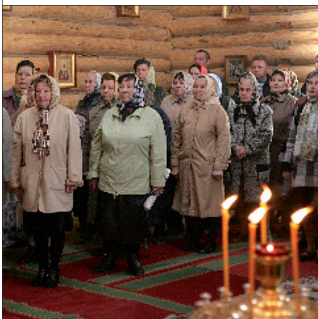
Церковь во имя преподобного Серафима Саровского. Пенза. 28 апреля 2011 года