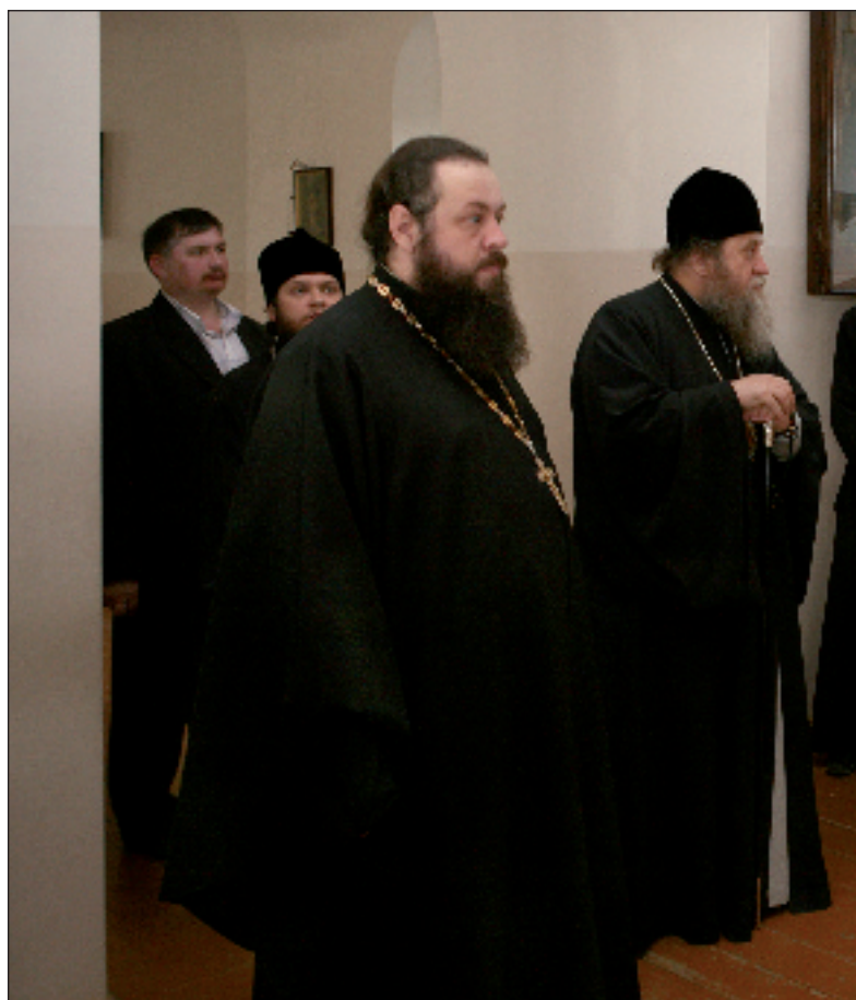
Реставрационно-строительные работы в верхнем, главном, приделе храма

Первое посещение Преображенской церкви епископом Вениамином. 19 сентября 2009 года