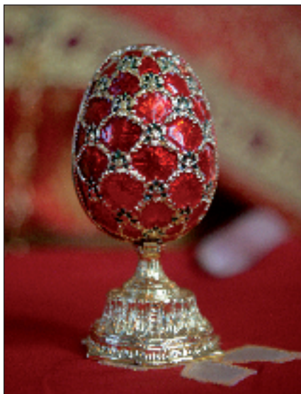
Пасха Христова. Божественная литургия. Успенский собор Пензы. 24 апреля 2011 года

«Иверская икона Божией Матери является одной из самых великих святынь Москвы, – сказал в своём слове владыка. – Сейчас, как и раньше, до революции, на Красной площади Москвы стоит часовня с этой святой иконой, около святого образа с утра до вечера совершается молебное пение с акафистом, мы просим Матерь Божию о заступничестве. Я всем вам желаю по молитвенному предстательству Царицы Небесной, чтобы Гос-