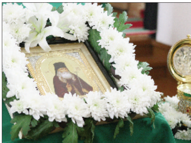
Епископ Пензенский и Кузнецкий Вениамин освящает плоды на праздник Преображения Господня. 19 августа 2010 года