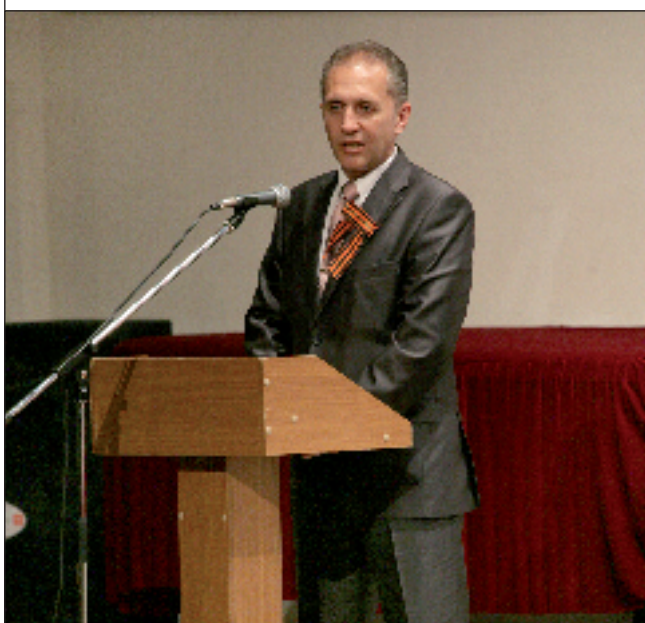
Президиум молодёжного форума. Пензенская областная филармония. 7 мая 2011 года Выступает вице-губернатор С.А. Златогорский