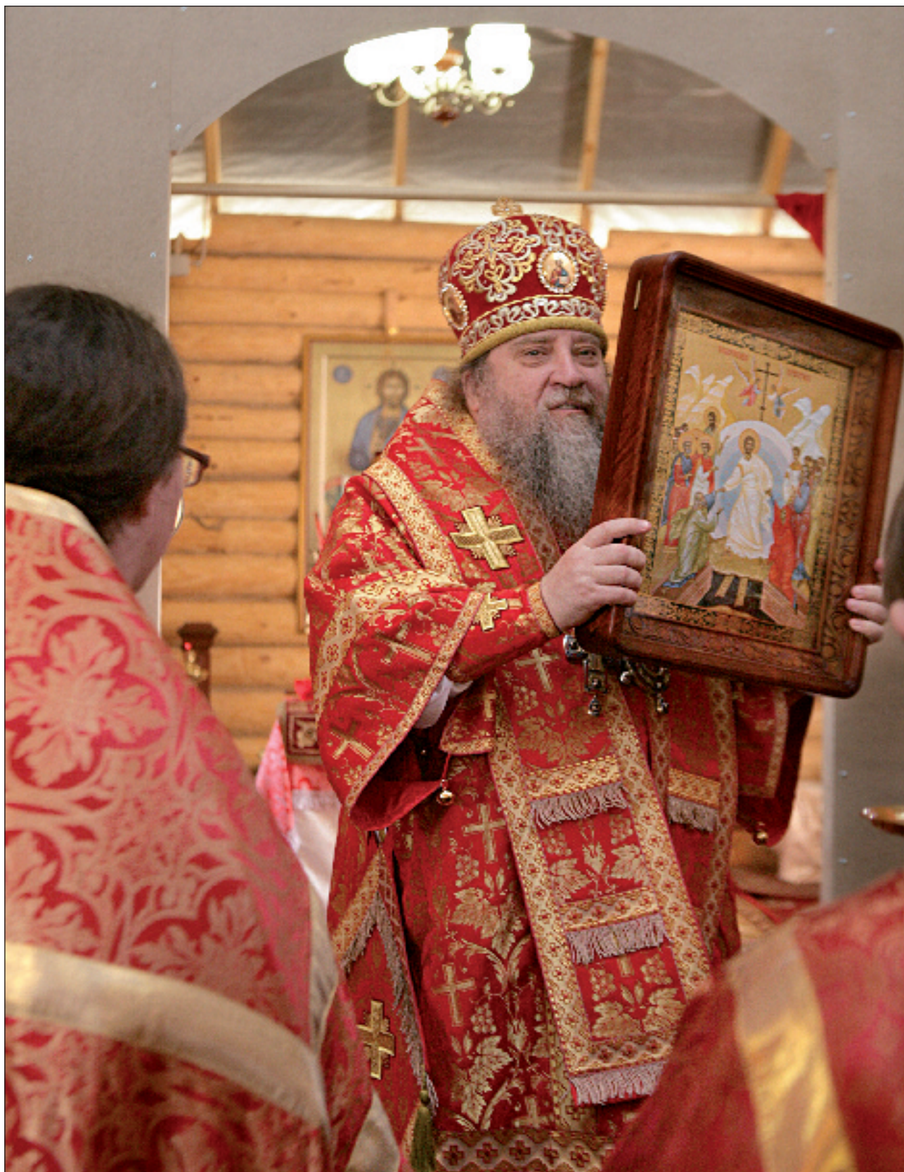
Епископ Пензенский и Кузнецкий Вениамин передаёт в дар приходу Серафимовской церкви подаренную губернатором икону Воскресения Христова. 28 апреля 2011 года