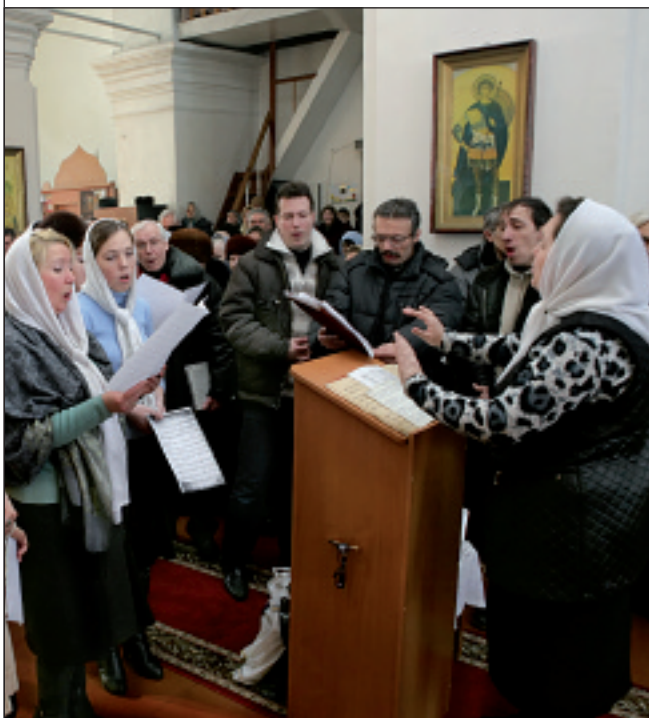
Никольский придел Воскресенской церкви перед освящением