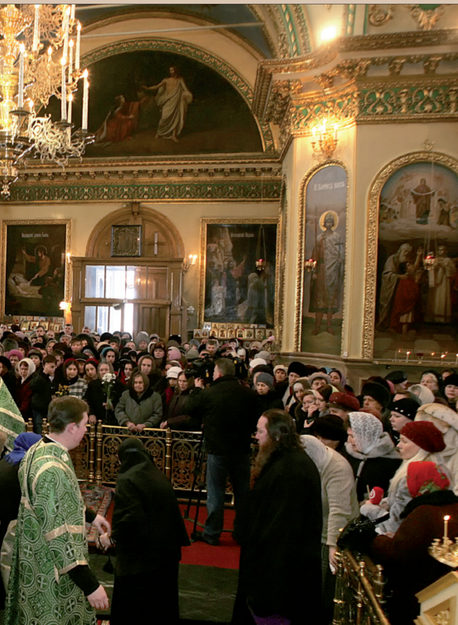
У мощей праведной Матроны Московской. Успенский кафедральный собор Пензы