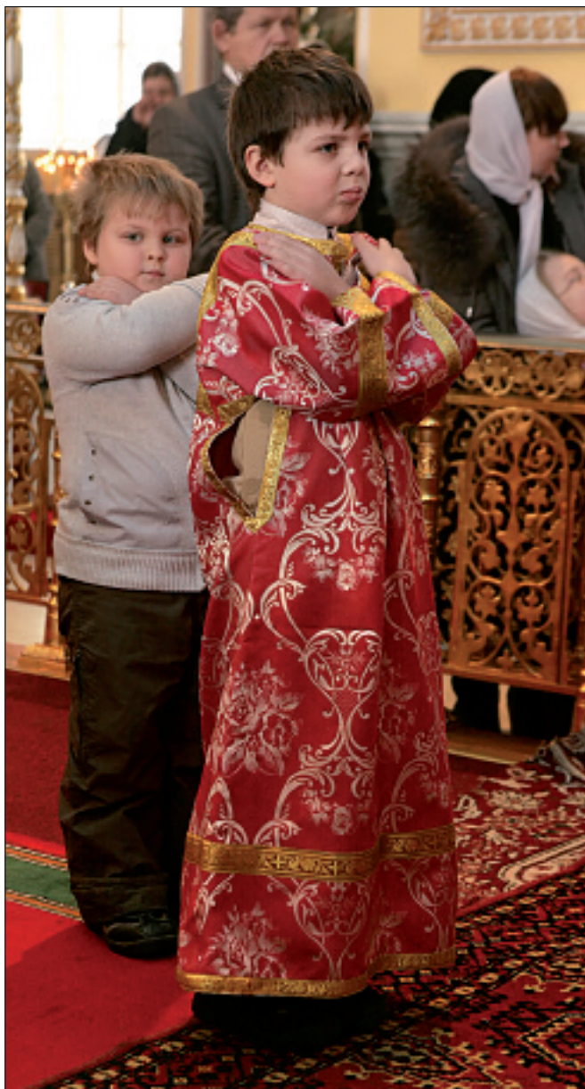
Молодые прихожане перед причастием в Покровском архиерейском соборе

Ещё больше людей, чем вечером 12 февраля, собрало праздничное богослужение в Покровском архиерейском соборе утром 13 февраля, в самый день праздника новомучеников и исповедников Российских, за Христа пострадавших, за веру Христову в годы гонений. В завершение богослужения верующие внимательно слушали владыку: