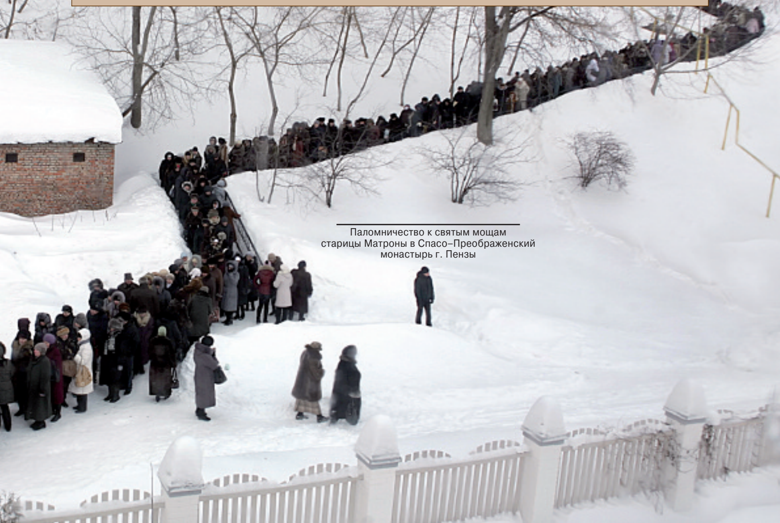
Паломничество к святым мощам старицы Матроны в Спасо-Преображенский монастырь г. Пензы