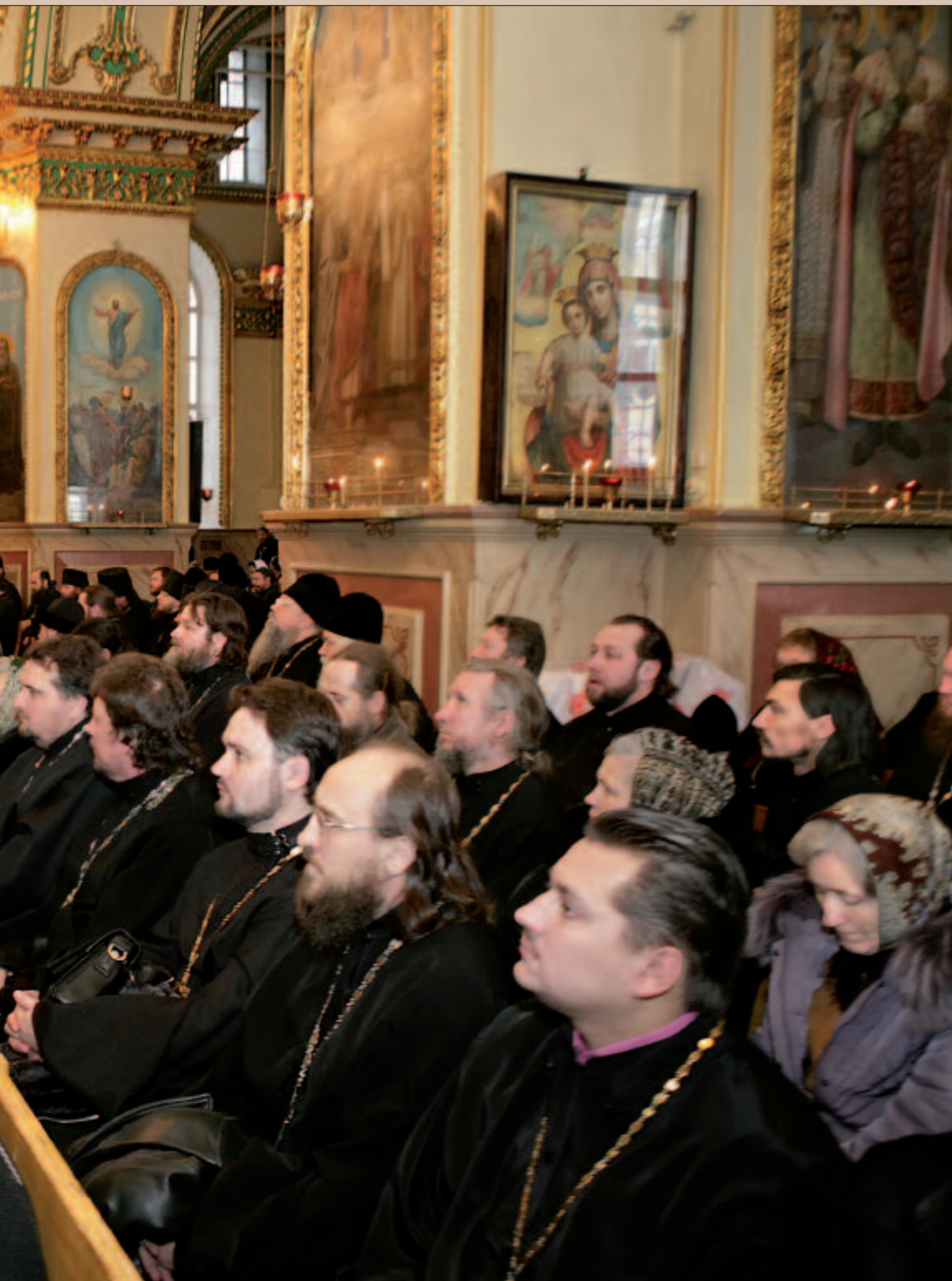
Участники епархиального собрания. Успенский кафедральный собор г. Пензы. 20 декабря 2010 года