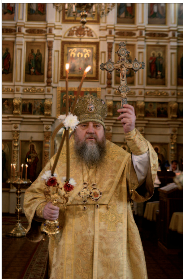
Епископ Вениамин совершает Божественную литургию в Покровском архиерейском соборе г. Пензы. 24 октября 2010 года