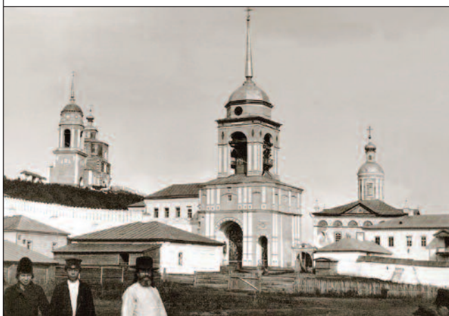
Старинные фотографии Казанского монастыря

верующих, пожертвования которых позволили возвести на монастырской территории каменные храмы, а также другие здания, образовавшие со временем прекрасный архитектурный ансамбль.