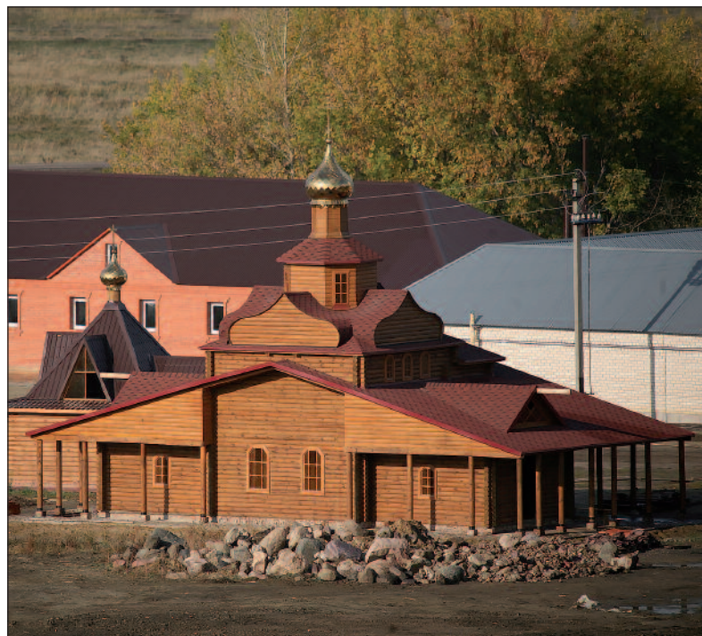
Часовня над источником и купальни. Современный вид

В 1856 году на пожертвования верующих чудотворная Казанская икона Божией Матери была украшена золотой ризой с серебряной короной, убранный бриллиантами, а ещё через три года помещена в серебряный киот с драгоценными камнями с полукруглым верхом.