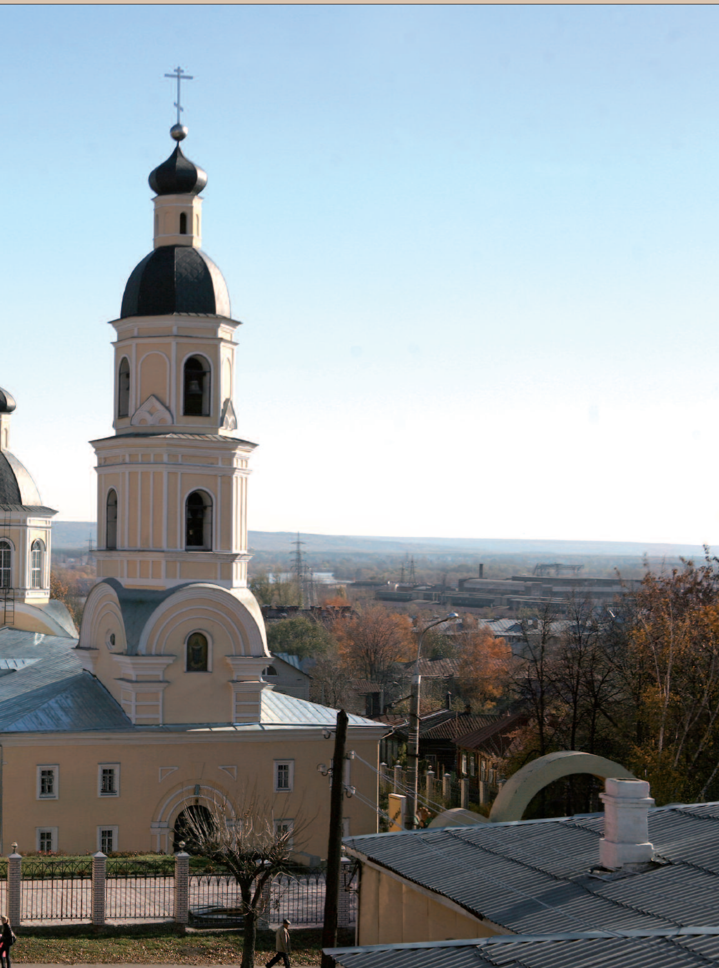
Покровский архиерейский собор г. Пензы