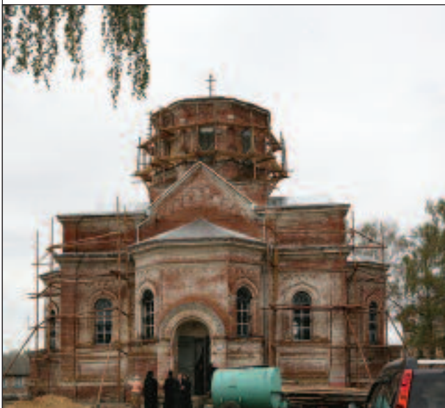
Епископ Вениамин освящает новое место под храм в Кижеватово