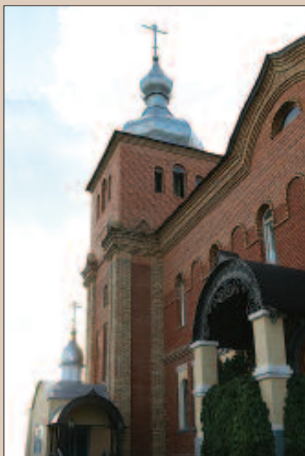
Пензенское православное училище 2010 г.

Письма святителя Иннокентия, епископа Пензенского и Саратовского ..... 37