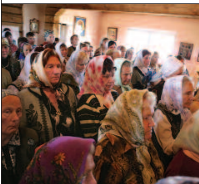
Никольский храм в Малой Сердобе