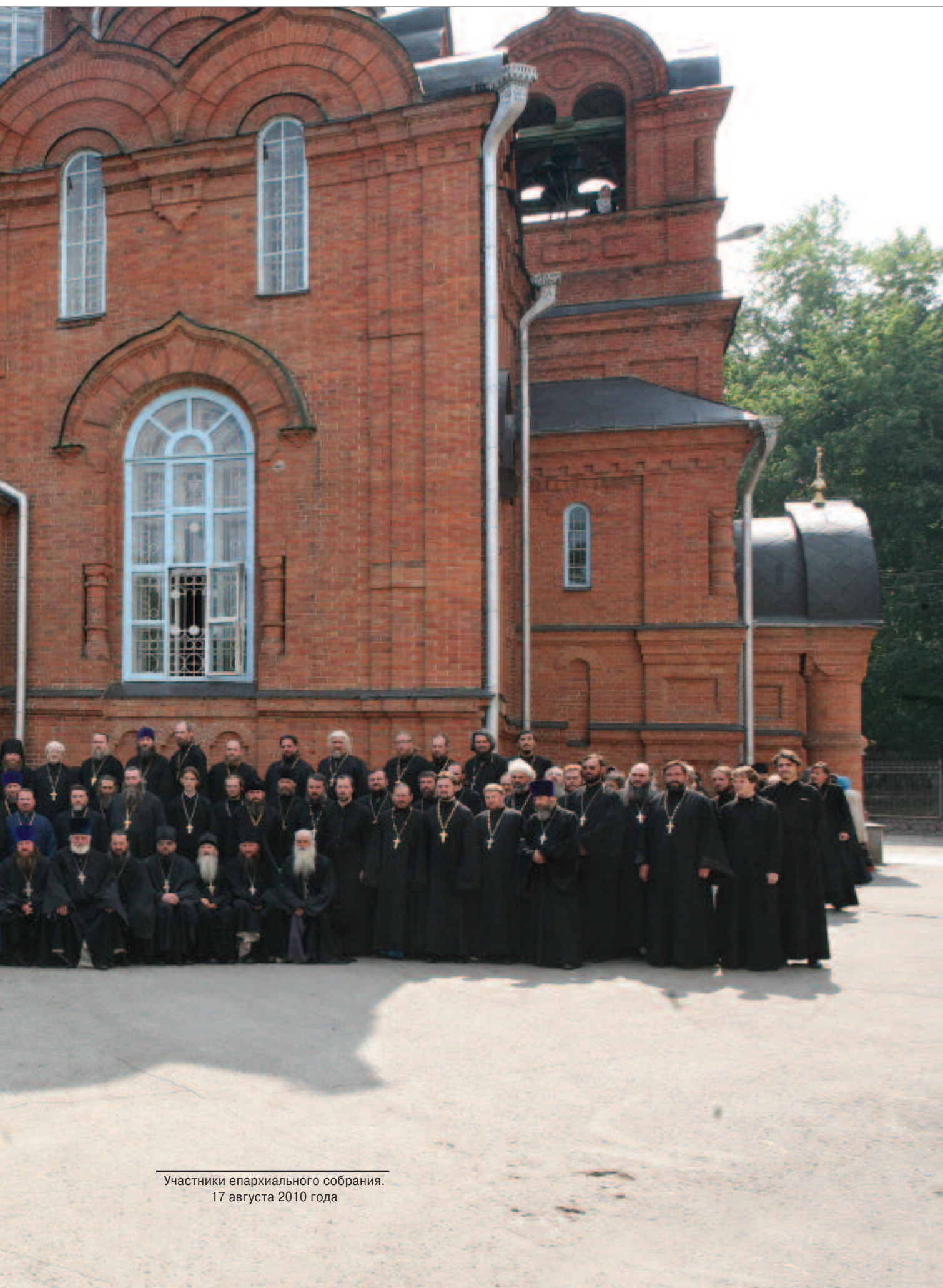
Участники епархиального собрания. 17 августа 2010 года