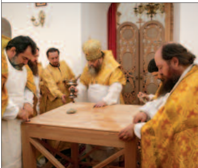
Освящение престола Преображенской церкви. 8 августа 2010 года

зе, во всей Пензенской епархии, потому что неисповедимыми судьбами Божиими на этом месте возродилась монашеская жизнь, воссоздан величественный престол в честь Преображения Господня, вновь затеплилась лампада молитвы, и мы сегодня стали причастниками великой благодати, которая здесь совершалась руками Божиими и Вашими.