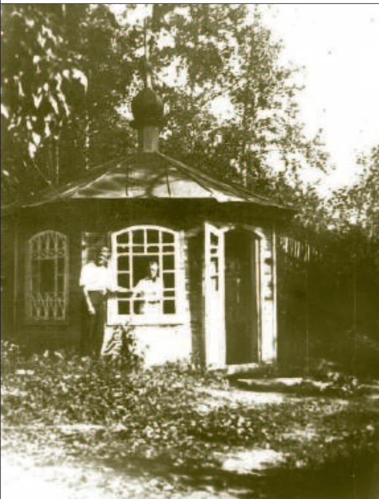
Пещерный монастырь. Фото. 1912 г.