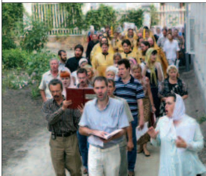
Освящение престола и крестный ход вокруг Преображенского храма. 8 августа 2010 года

Стр. 12–13: Крестный ход с мощами вокруг Спасо-Преображенской церкви Преображенского монастыря г. Пензы