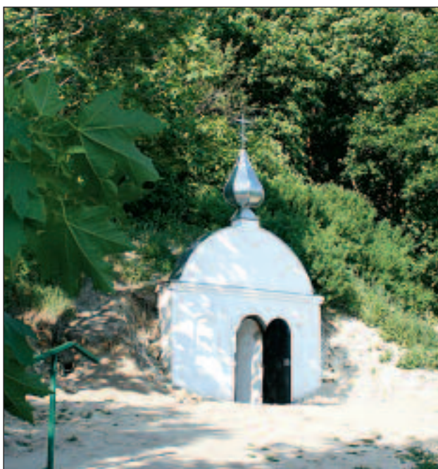
Алтарь пещерного храма во имя Святителя и Чудотворца Николая Вход в Антониево–Феодосиевы пещеры