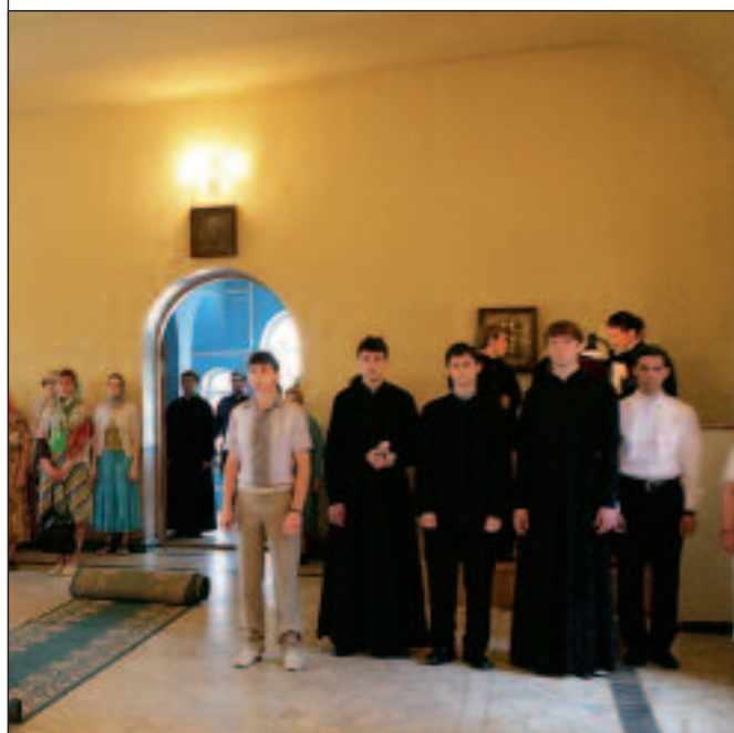
Епископ Вениамин за Божественной литургией в домовом храме Пензенского православного духовного училища в день выпуска. 14 июня 2010 года