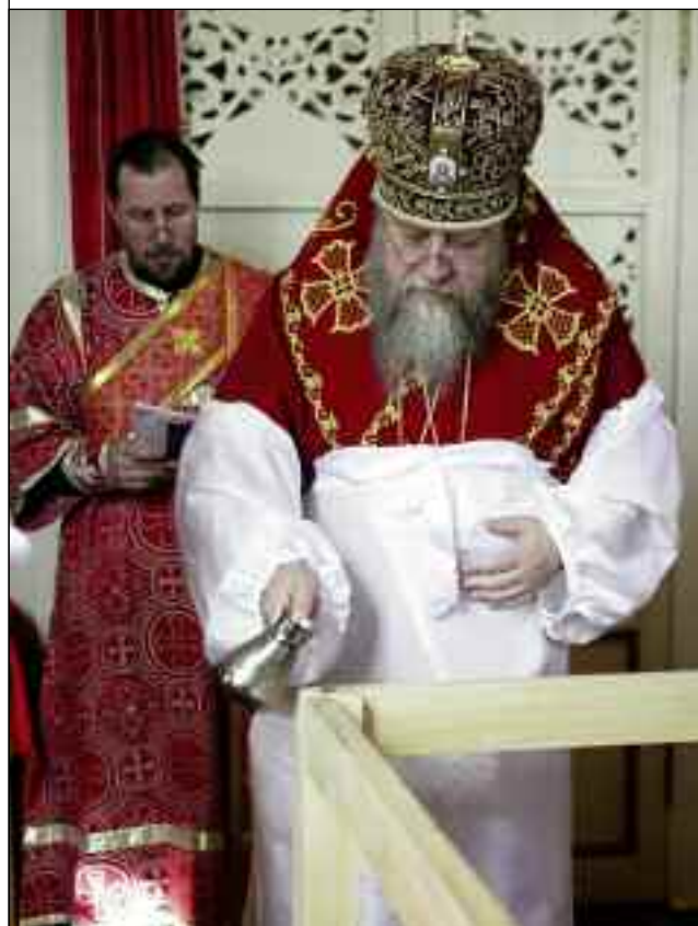
Церковь Рождества Христова с. Лещиново Нижнеломовского района