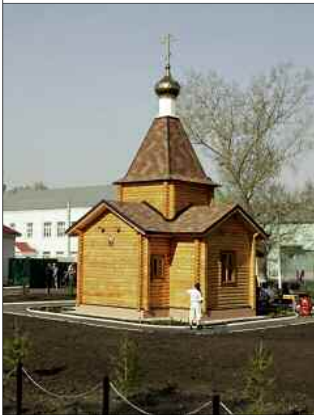
Строительство Георгиевской церкви в Бессоновке. 14 апреля 2010 года

В день освящения новой церкви. 7 мая 2010 года