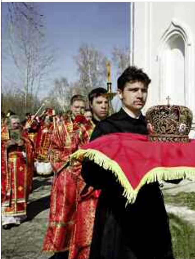
Крестный ход с мощами вокруг Рождественской церкви. 28 апреля 2010 года

жу деток, они пришли на короткое время и убежали, молодых людей не много, а в основном вижу наших сверстников и сверстниц, которым пришлось пережить страшные гонения на Церковь, помните и хрущёвские гонения? И сейчас, когда Господь даровал нам вновь возможность свободно молиться, спасаться, мы не можем найти в себе силы прийти в храм и сделать это. А ведь совсем недавно было: люди копили деньги с пенсии, чтобы съездить в ближайший храм – причаститься. А у вас, дорогие братья и сёстры, такой прекрасный, восстановленный вами храм. Я думал, что сегодня войду сюда – и нельзя будет руки поднять, столько будет молящихся. Я вас прошу: вспомните слова Господа – идти в мир и проповедовать Евангелие всей твари 1 (Мк. 16, 15). Поэтому вы должны проповедовать и Евангелие, и Божии заповеди и в семьях своих, и на работе, и деткам, и внукам. Не надо думать, что, мол, вырастет ребёнок и сам пойдёт в храм. Никто не знает времени, когда Господь может призвать любого из наших близких, это может случиться в мгновение ока, и они предстанут пред Господом. И кто будет в ответе за то, что они не научились слову Божию? Поэтому, дорогие мои, я вас всех прошу: приводите в храм детей и внуков, старайтесь им читать Евангелие, рассказывать о святых угодниках, чтобы они полюбили Бога, полюбили Святую Церковь, храм этот святой, чтобы они чаще радовали Бога молитвой в храме, исповедью и причастием Святых Христовых Таин. Мы все приходим в церковь, как в лечебницу, чтобы получить отпущение грехов.