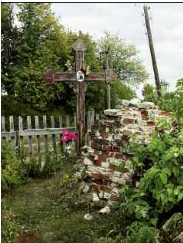
Священноисповедник Иоанн Оленевский. Фото. Конец XIX – начало XX века

Руины Введенской церкви. Место, где проходил своё служение священноисповедник Иоанн. 2009 год