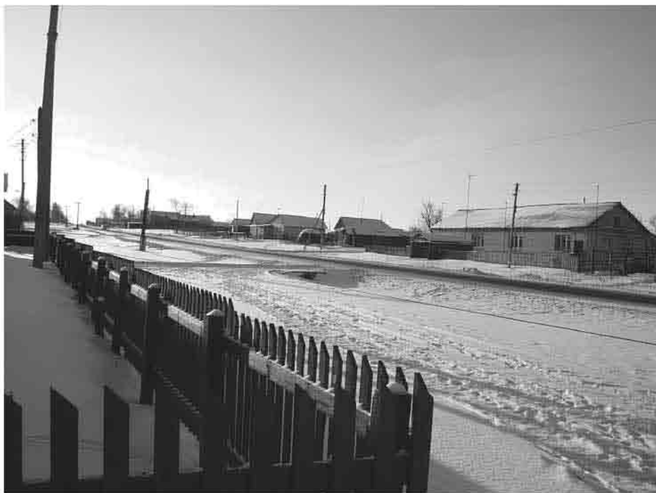
Оленевка в наши дни. 2007 г.