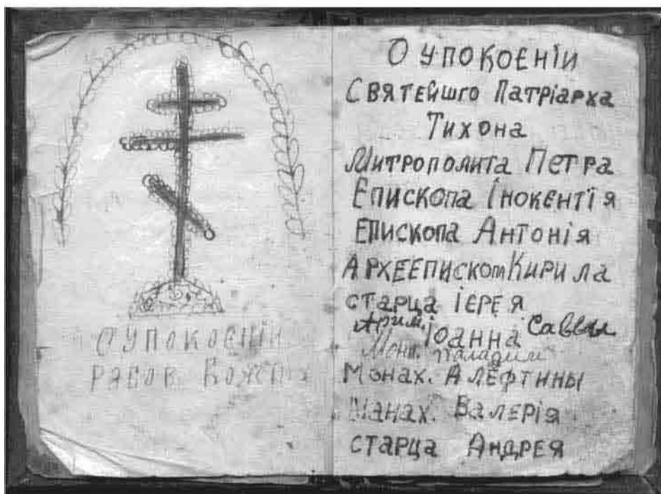
Помяник верующего Пензенской епархии. 1960-е гг.