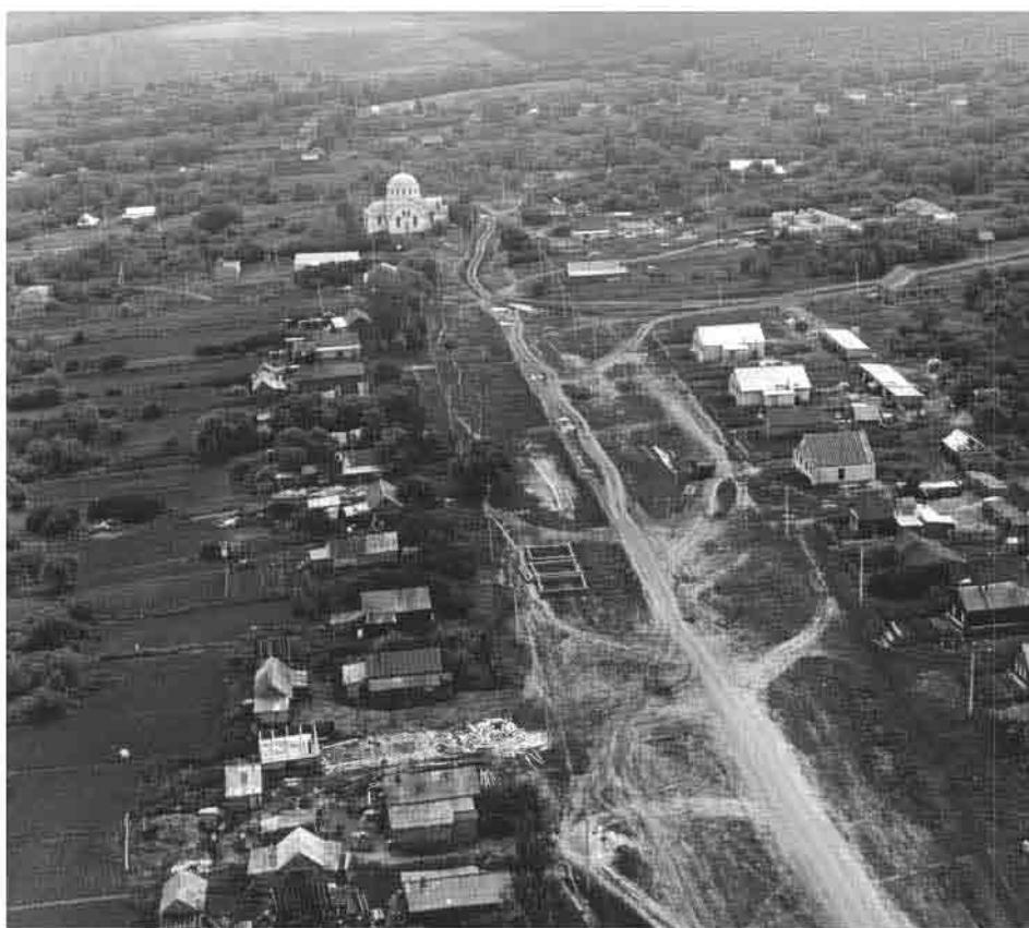
Соловцовка. Конец 1980-х гг.