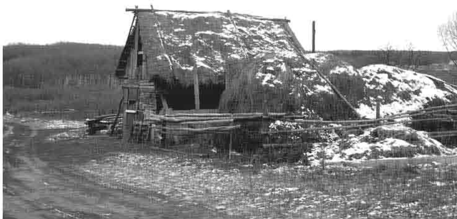
Оленевка. Последний дом под соломенной крышей. 2007 г.