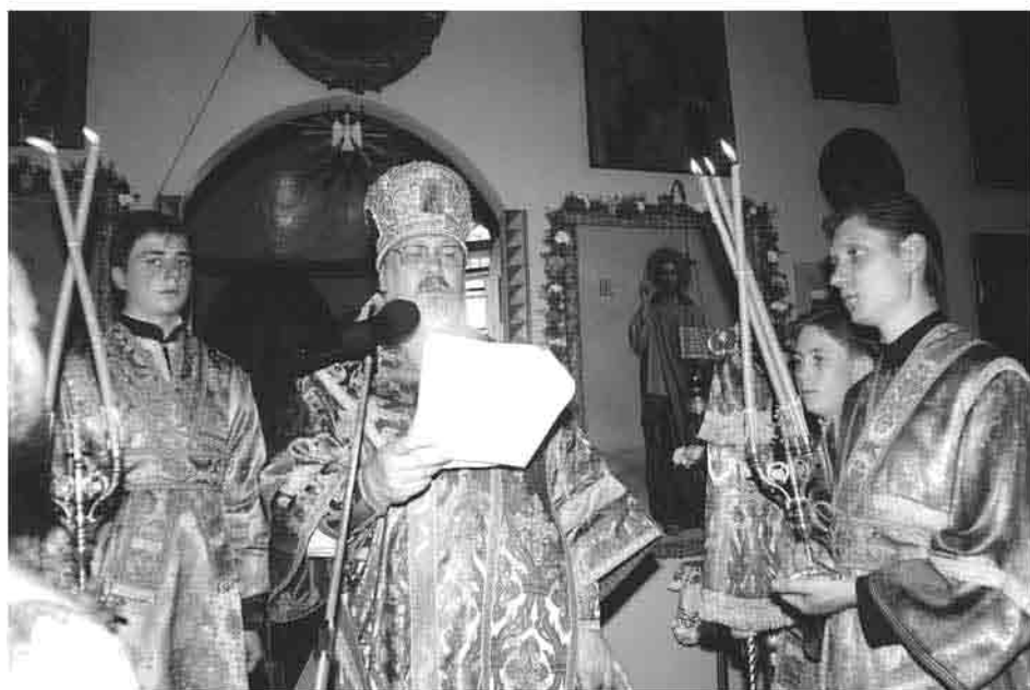
Соловцовка. 31 мая 2001 г.

Александр начал капитальные работы по реставрации храма. Здание было општукатурено и окрашено, заново переделаны полы, налажена система отопления, устроен первый иконостас. Их же совместными трудами был окультурен источник святой Параскевы, где установлена часовня и оборудованы две купальни. Он руководил процессом перезахоронения останков старца, для чего был сделан новый гроб, а у алтаря храма приготовлена могила-склеп, выполненный черной кафельной плиткой. Все работы требовали привлечения целой автоколонны строительной техники, а еще много человеческих сил, ума и любви. Наконец, огромных трудов и усилий требовала организация самого праздника. За некоторое время до того была заказана икона святого старца, сделана рака, над которой сооружен изящной работы деревянный резной балдахин (не был утвержден). Торжества были согласованы со многими ведомствами, в том числе правительством Пензенской области, Управлением федеральной службы безопасности. Гостям были разосланы специально изготовленные приглашения с изображением Троице-Сергиевского храма.