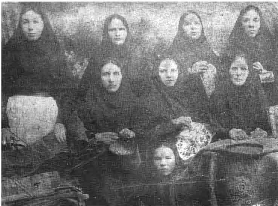
Монахини Пензенского Троицкого монастыря. Начало XX в.

где день, где ночь», но опять не получаю ответ. Через некоторое время сказал: «Да. Раз выйдешь и два выйдешь, и не один мужик тебе