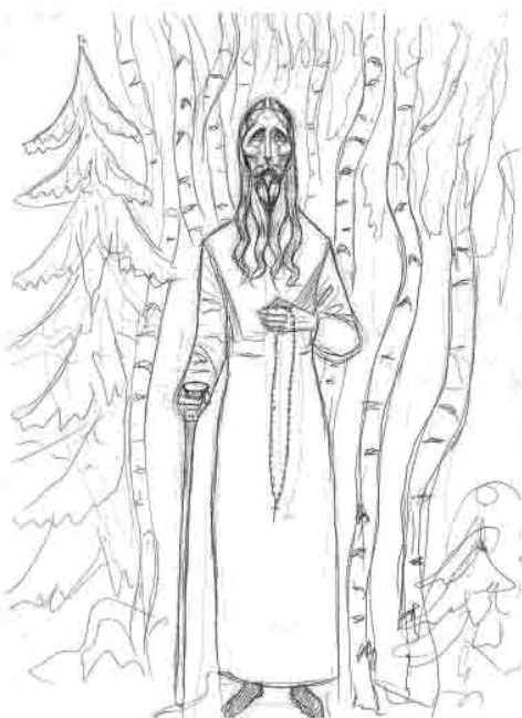
Наедине с Богом