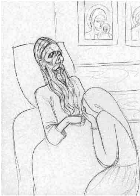
В келье у старца Иоанна

Просители заходили в келью чаще по одному, подходили под благословение к старцу, причем часто на коленях, многие плакали, сокрушаясь о грехах. Старец клал на голову приходящего свою