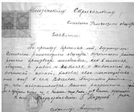
Прошение оленевской религиозной общины. 1929 г.

Все эти разрушительные действия приходу села Оленевка пришлось испытать в самой полной мере, поскольку Введенскую церковь власти считали главным «очагом религиозного дурмана». Говоря же по-христиански, храм был оплотом православия в Пензенской епархии и местом испрекрашающегося паломничества к оленевскому старцу. Именно поэтому огонь церковной жизни в Оленевке власти старались погасить в первую очередь. Именно поэтому храм был закрыт одним из первых и уничтожен до основания. Именно поэтому все, что связано с именем Иоанна Оленевского, старательно искоренялось, выжигалось каленым железом, и теперь с таким титаническим трудом приходится собирать крупицы о его святой жизни, исполненной христианских подвигам.