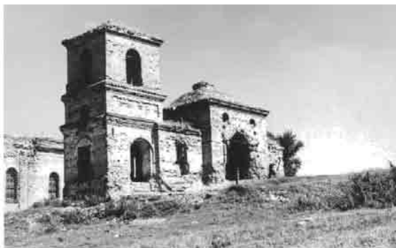
Большая Валеевка. 1970 г.