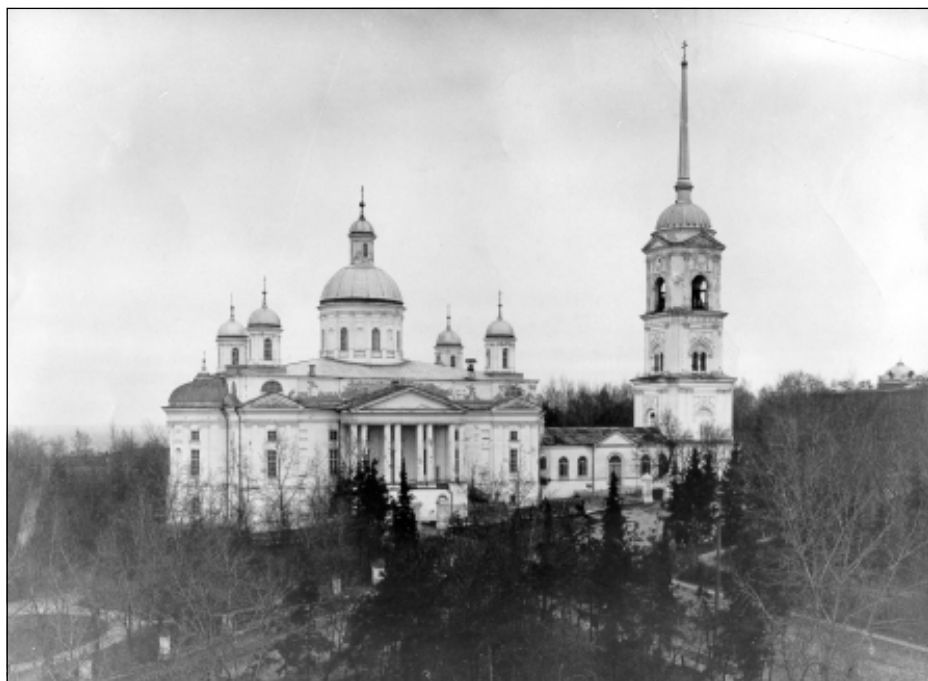
Пензенский Спасский кафедральный собор. Фото 1920-х гг.