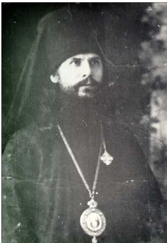
Епископ Августин (б. протоиерей А. А. Беляев) расстрелян в 1937 г. в Калуге