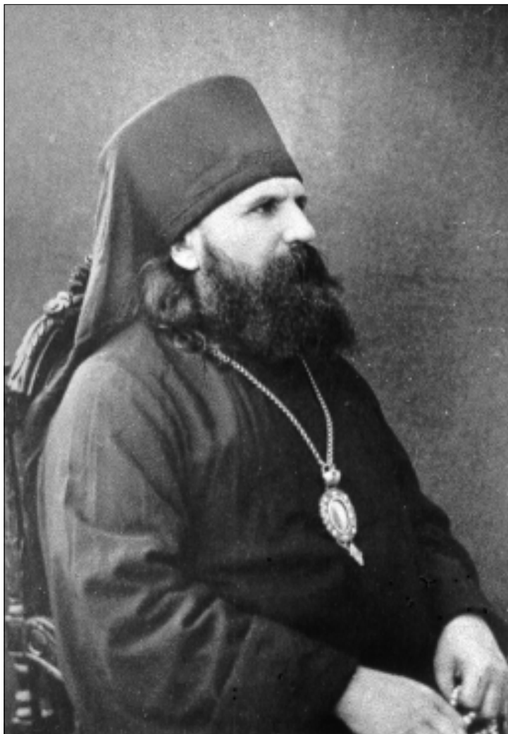
Епископ Иоанн (Поммер)