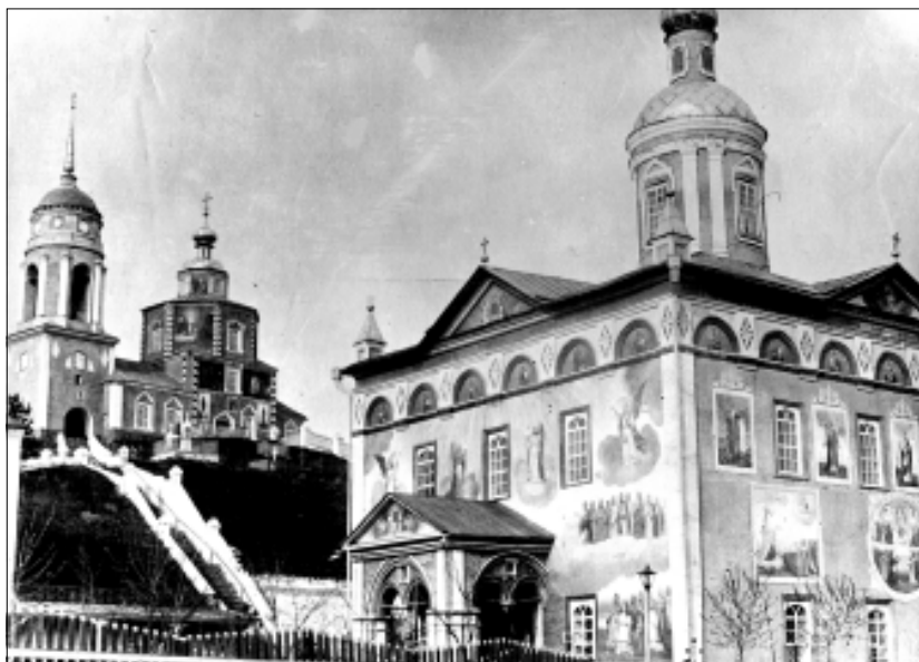
Нижнеломовский Казанский мужской монастырь