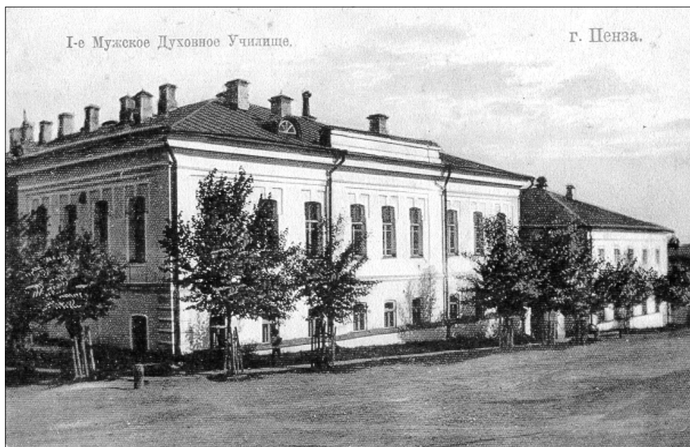
Пензенское духовное училище