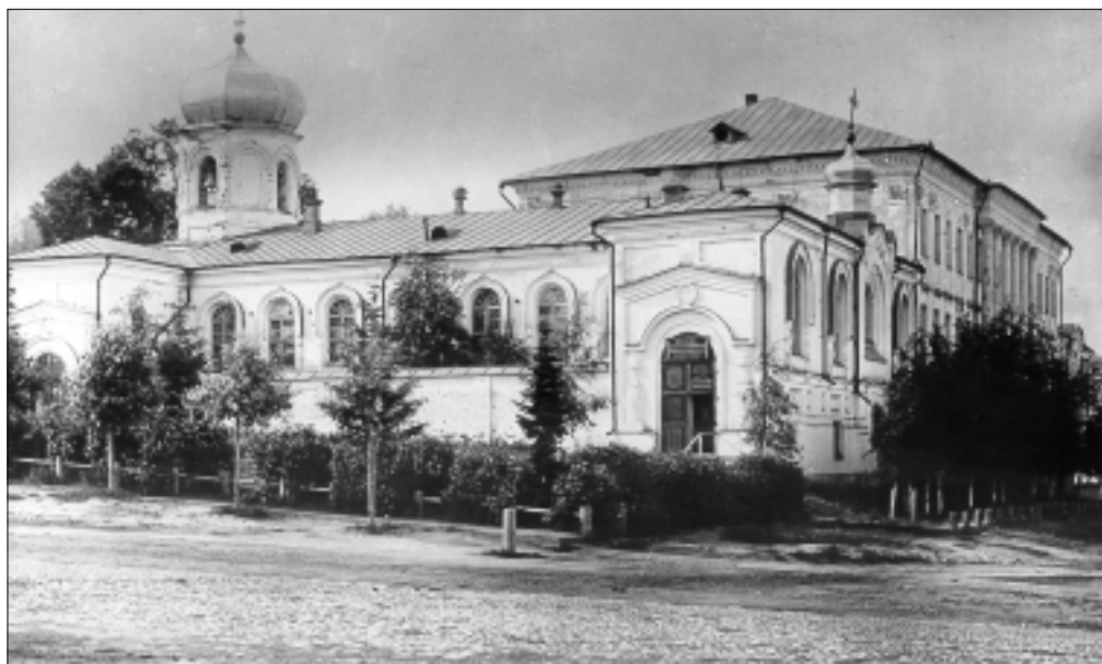
Крестовая Воскресенская церковь архиерейского дома