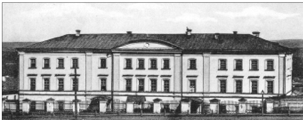
Духовная семинария после перестройки