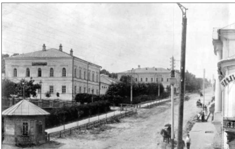
Вид на духовную консисторию с северо-востока после перестройки