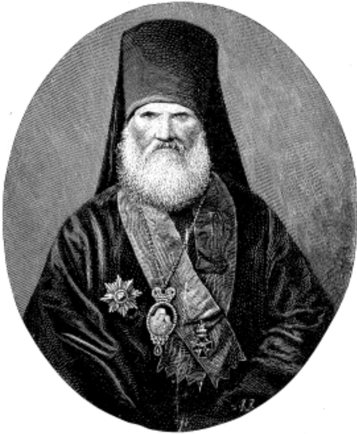
Архиепископ Варлаам (Успенский)