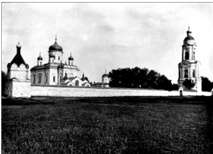
Пензенский Спасо-Преображенский мужской монастырь. Слева – Троицкий (Вифлеемо-Воскресенский храм).