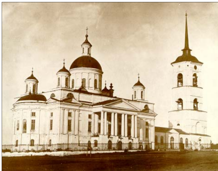
Пензенский Спасский кафедральный собор

Приехав в места своего детства, он поселился в небольшой келье Кирилло-Белозерского монастыря и весь предался затворнической жизни, перестав общаться с кем бы то ни было, кроме Бога. Назначенную ему Синодом пожизненную пенсию в размере 2000 рублей он отдал на нужды монастыря, на бедных, на содержание своих родителей и двух сирот в училище. Он стал вести еще более строгую жизнь, чем вел, часто отказываясь даже от простой монастырской пищи, за день съедал одну просфору и пил лишь настой ромашки. Уединением, постом и молитвой он смирил все проявления своей страстной и деятельной природы, так необходимые ему когда-то для борьбы с дурными страстями и наклонностями других. Теперь, отбросив все земное, он сосредоточился на одном – на вечности, на