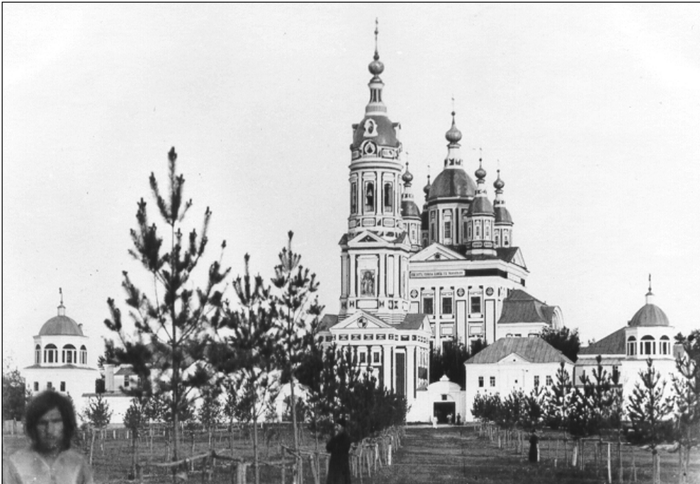
Наровчатский Троицкий Скнов монастырь