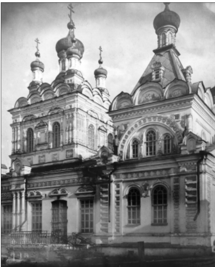
Троицкий храм Пензенского Троицкого женского монастыря