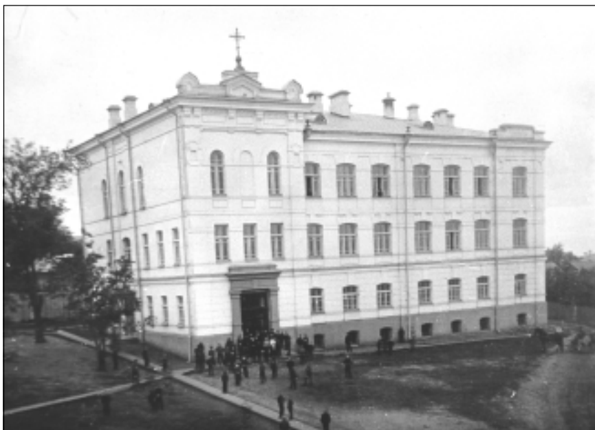
Тихоновское духовное мужское училище