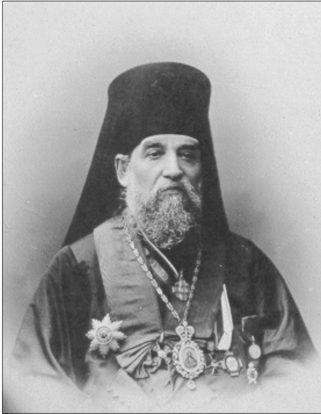
Епископ Митрофан II (Симашкевич)