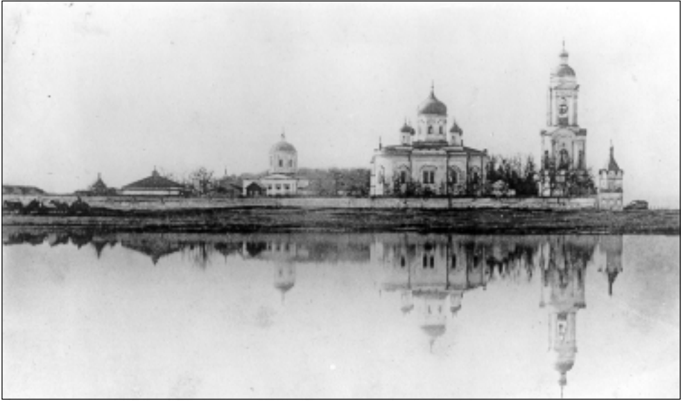
Пензенский Спасо-Преображенский монастырь