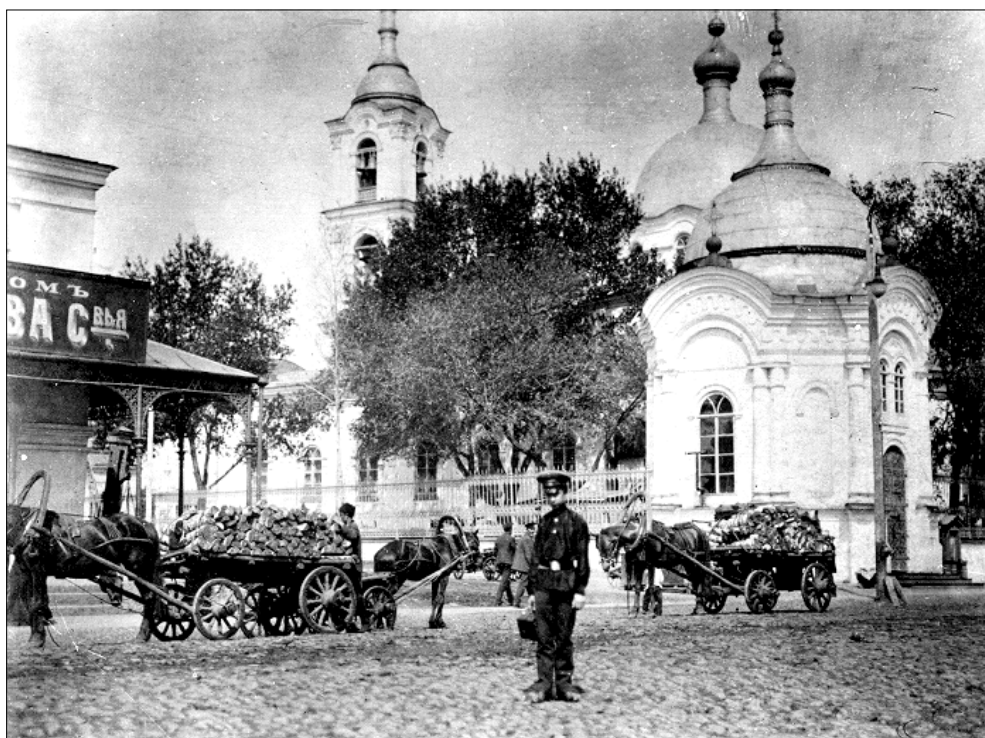
Часовня при Петропавловской церкви в г. Пензе