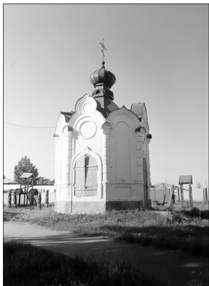
Часовня в Чембаре