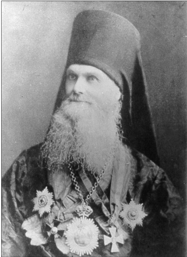
Епископ Антоний II (Николаевский)