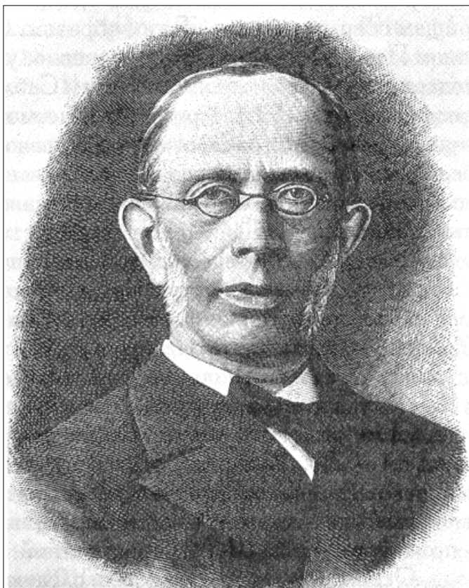
Обер-прокурор Святейшего Синода К. П. Победоносцев