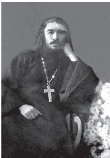
Иерей Николай Прозоров, священномученик