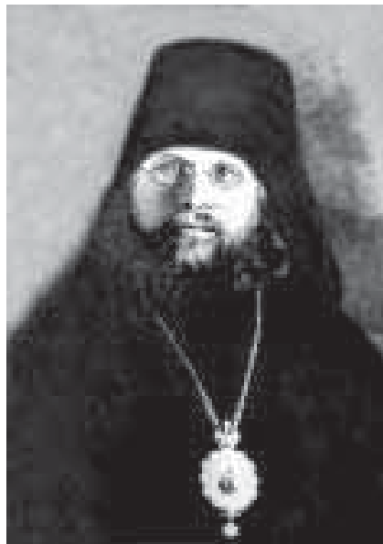
Архиепископ Серафим (Самойлович)

Мировая общественность содрогнулась от событий в СССР. На страницах зарубежной прессы осуждались злодеяния большевиков. Над Советским Союзом нависла угроза международной