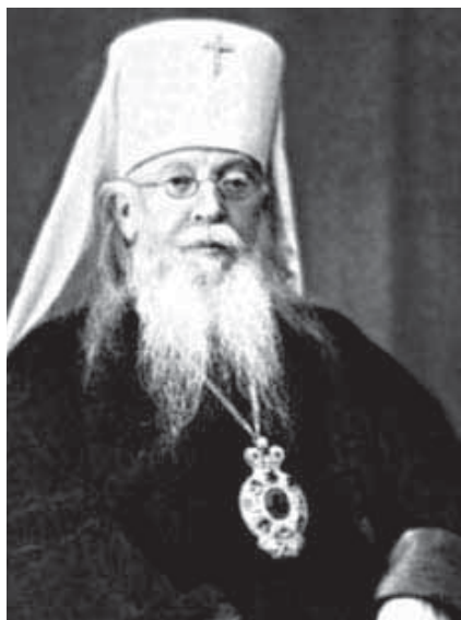
Митрополит Ярославский Агафангел (Преображенский), исповедник

(1926–1930 гг.), церковь Сошествия Святого Духа (1929–1931 гг.), Духосошестввенская церковь в Троицком монастыре (1928–1931 гг.), Казанская (1930–1931 гг.), Преображенская (до 1929–1931 г.), Сергиевская на Мироносицком кладбище (в 1931 г.) и один из храмов Спасо-Преображенского монастыря (1931 г.). Последним гнездом раскольников в Пензе была церковь Митрофана Воронежского, где обосновался «епископ» Викторин (Поляков).