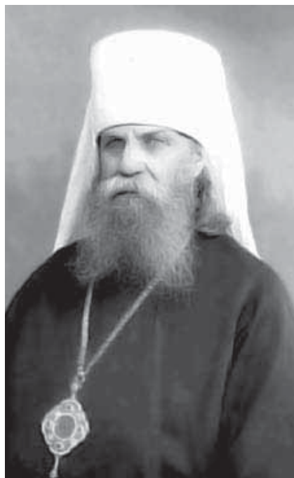
Митрополит Крутицкий Петр (Полянский), священномученик

В самой же Пензенской епархии григорианский раскол имел довольно длительную историю, исчезнув лишь в середине 30-х годов. Во власти григорианцев побывали Введенская церковь