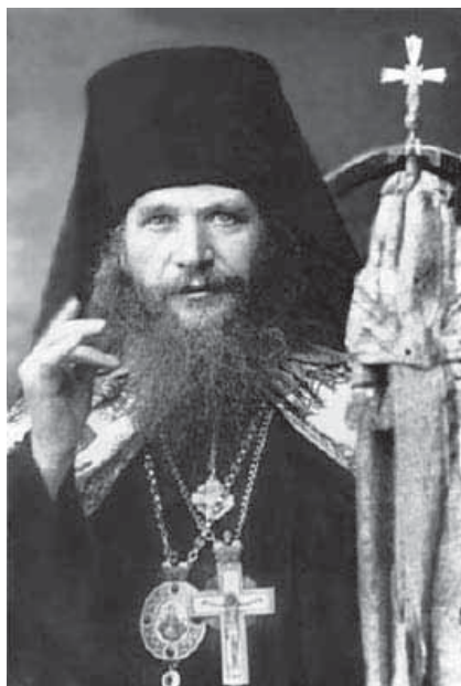
Епископ Павлин (Крошечкин), священномученик