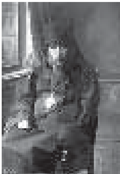
Архиепископ Корнилий (Соболев)