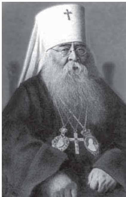
Митрополит Сергей (Страгородский)

30 марта 1927 года из заточения был освобожден митрополит Сергей (Страгородский), исполнявший до ареста обязанности