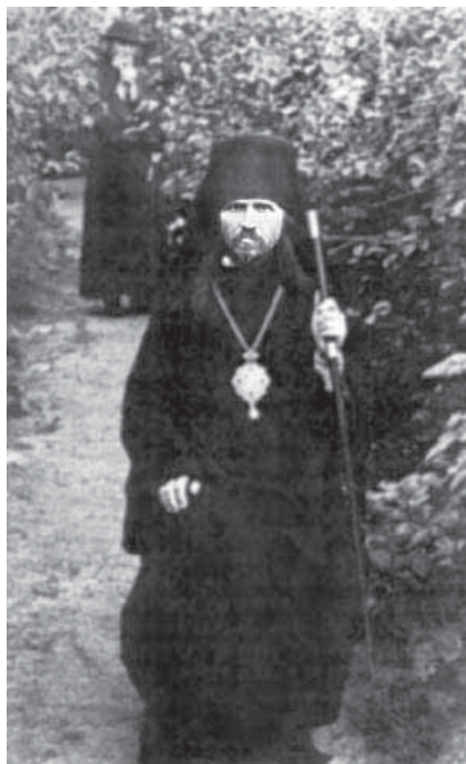
Архиепископ Фаддей (Успенский), священно- мученик. Кузнецк. 1928 г.

Кирилла (Смирнова), митрополита Казанского. Однако довести дело первостепенной важности до конца не удалось: в Москве Владыка Павлин был отслезен и арестован ГПУ, но документы, касающиеся выборов, чекисты заполнить не смогли.