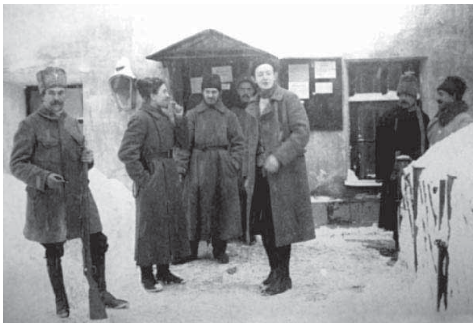
Работники советского концлагеря

нужного места, их сразу же посылали обратно, и весь день проходил в изнурительной ходьбе. Особо грубое обращение заключенные отмечали в Городищенском лагере, где в 1920 году содержалось 100 заключенных 43 (лагерь был рассчитан на 120 человек). В марте того же года колония пережила вспышку сыпного тифа 44 . Позднее, в 1929 году, Городищенская колония продолжила свое