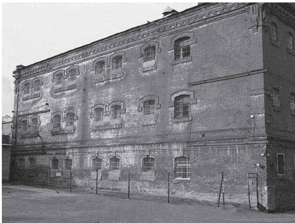
Корпус Пензенской губернской тюрьмы

За первое полугодие в 1920 году в четырех основных тюрьмах Пензенской губернии* содержалось до 6000 тысяч человек, среди которых были приговоренные к расстрелу, осужденные на 20 и более лет заключения в концлагерь. Основной проблемой в тюрьмах молодой республики стала проблема питания. Норма