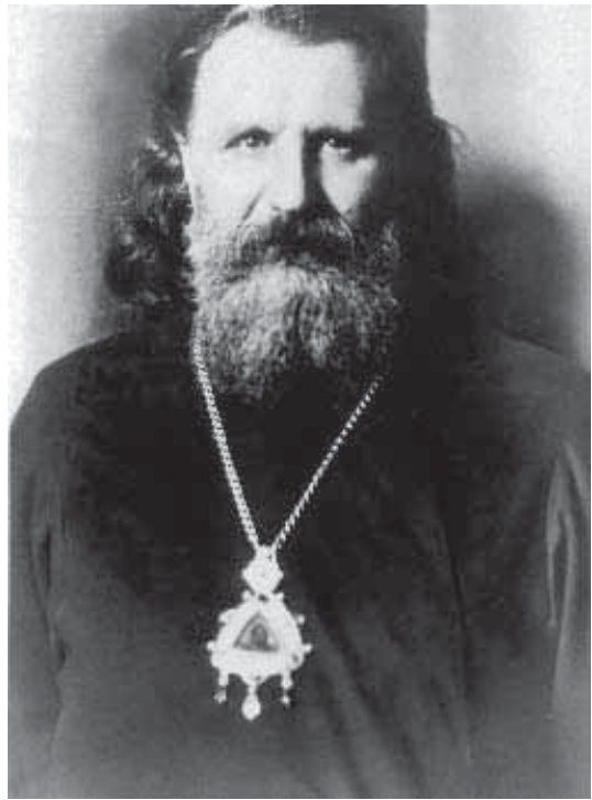
Архиепископ Пензенский и Саранский Иоанн (Поммер), священномученик

Новый архиерей запрещал в священнослужении обновленческих иереев и тех, кто своим поведением бесчестил духовный