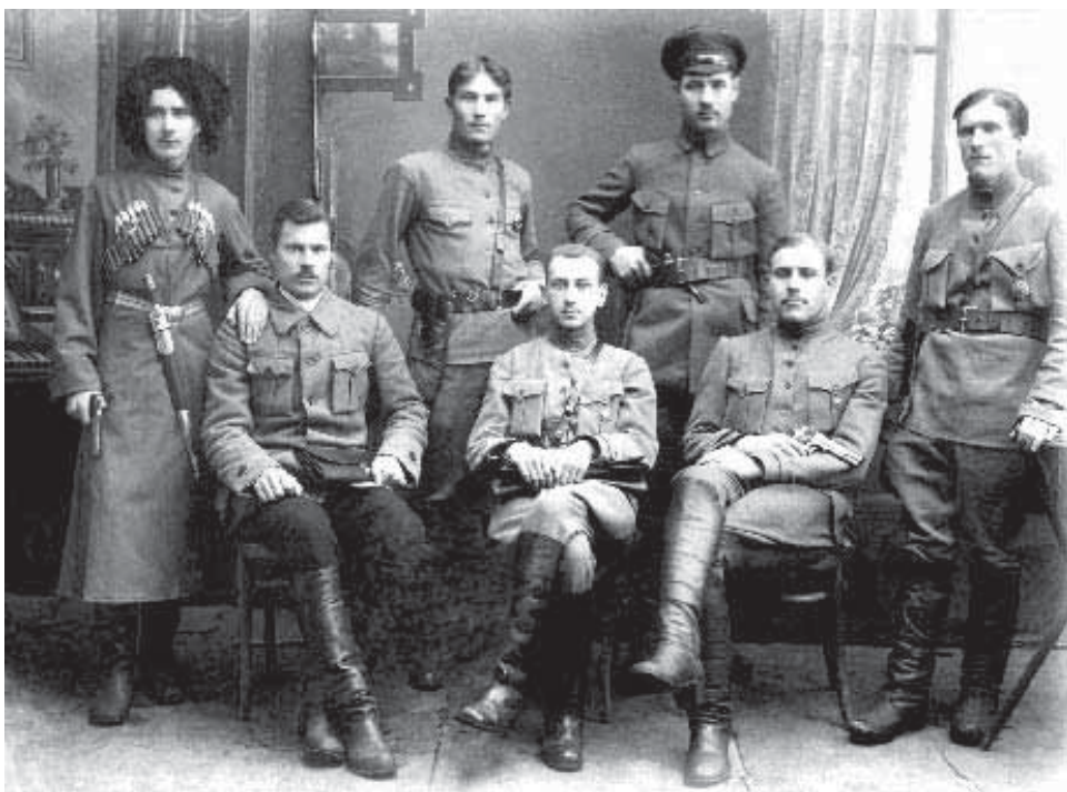
Сотрудники Пензенской ЧК

В сентябре большевики разработали практическую инструкцию, в которой предоставлялось право расстреливать всех