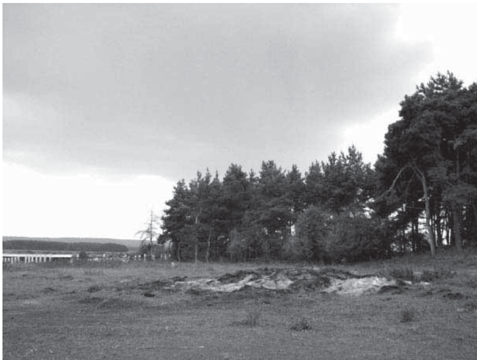
Шелюга. Место массовых расстрелов в Наровчатском уезде

Только за один сентябрь 1918 года тюрьмы до отказа наполнились дворянами, царскими слугами, белыми офицерами, духовенством, помещиками, крестьянами, уголовниками. Начальство переполненной Пензенской тюрьмы обратилось в ЧК с просьбой направлять арестованных в освободившиеся воинские казармы