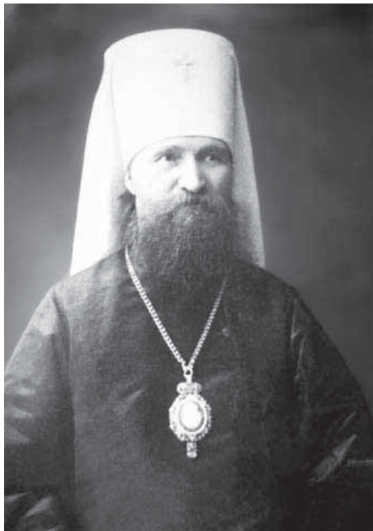
Митрополит Киевский и Галицкий Владимир (Богоявленский), священномученик

По такому сценарию 25 января 1918 пролилась кровь одного из первых новомучеников Российской Православной Церкви, митрополита Киевского и Галицкого Владимира (Богоявленского). Владыка был выведен за территорию Киевской Лавры пятью