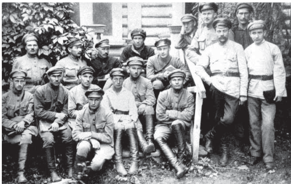
Начальники уездных ЧК

Большевики загоняли Церковь в катакомбы, они лишали ее имущества, денег, права юридического лица, голоса. 16 января 1918 года в стране было упразднено военное духовенство, а вся казна, находившаяся в ведомстве протопресвитера армии и флота,