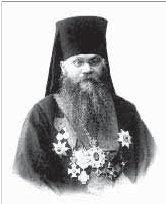
Епископ Пензенский и Саранский Тихон (Никаноров), священномученик

27 декабря 1919 года (ст. ст.) в Воронеже был замучен архиепископ Тихон (Никаноров), который по свидетельствам очевидцев был повешен на Царских вратах Благовещенского собора. Владыка Тихон в бытность свою много потрудился на Пензенской