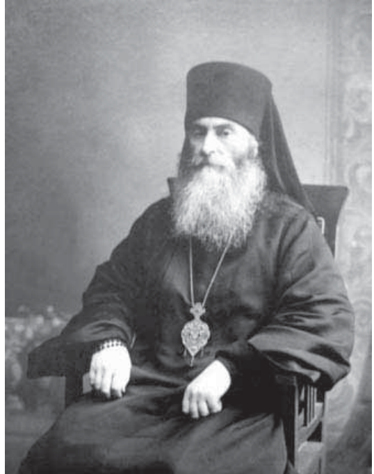
Бывший пензенский архиепископ Владимир (Путята)

К великому сожалению, Пензенская епархия стала как бы колыбелью обновленчества в том смысле, что именно здесь оно появилось впервые после революции и приняло в лице Путяты наиболее уродливые формы. Когда в феврале 1918 года законным архиереем в Пензу был назначен епископ Феодор (Лебедев), Путята автоматически стал родоначальником обновленческой «епархии». В дальнейшем этот скверный очаг не замирал, он в