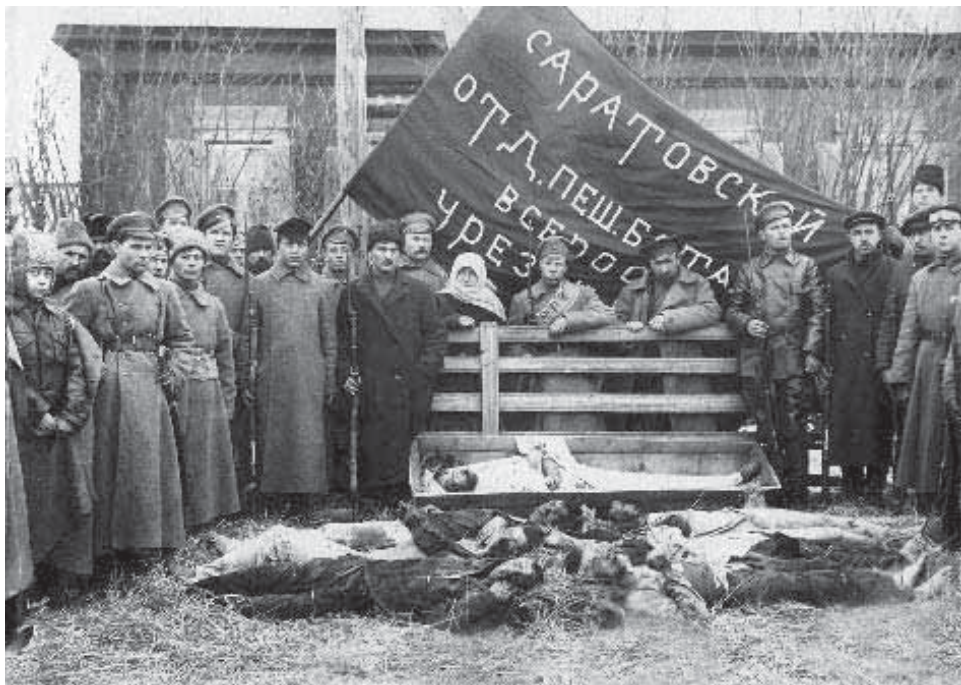
Жертвы красного террора в Саратовской губернии