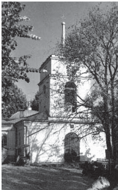
Церковь Свт. Митрофана Воронежского

арестовали еще 22 декабря 1937 года, и теперь власти готовили общество к «таинственному исчезновению» лучших клириков епархии.