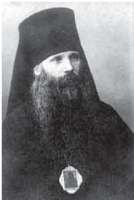
Епископ Пензенский Ираклий (Попов)

ре. В 1904 г. послушник Илия был пострижен в монашество с именем Ираклий. 12 февраля 1905 г. рукоположен в сан иеродиакона, а 5 сентября 1910 г. – в сан иеромонаха. Служил в Троицкой Лавре до 1919 года, где заведовал школами и типографией.