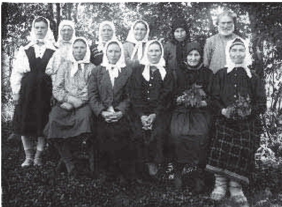
Община верующих Молочного источника