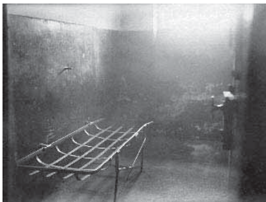
Одиночная камера Самарской тюрьмы. 1932 г.