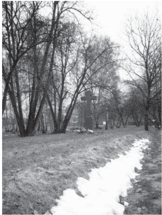
Бутовский полигон. Насыпь и крест на месте погребальных рвов

Но по слову Евангельскому «...нет ничего тайного, что не сделалось бы явным, ни сокровенного, что не сделалось бы известным и не обнаружилось бы» (Лук. 8, 17). Вот уже несколько лет как мир узнал о чудовищном злодеянии большевиков в подмосковном поселке Бутово. Только за период с 8 августа 1937 г. по 19 октября 1938 г. на Бутовском полигоне были расстреляны 20.761 человек, среди них неисчислимое количество православных епископов, священников, монахов и мирян, совершивших удивительный подвиг стояния в вере. Митрополит Серафим (Чичагов), возглавив-