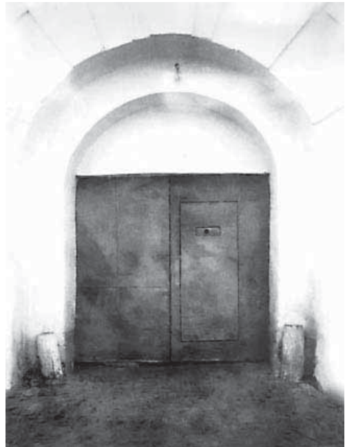
Ворота Наровчатской тюрьмы