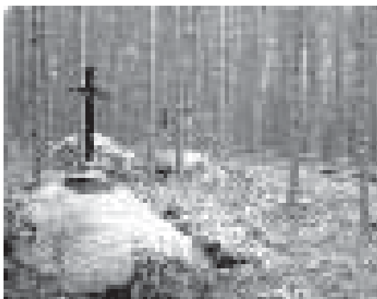
Одно из кладбищ Беломорканала