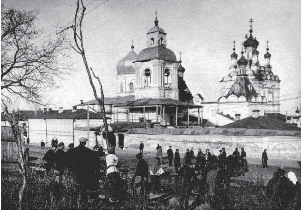
Снятие крестов в Пензенском Троицком женском монастыре