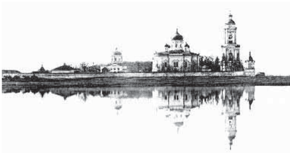
Спасо-Преображенский мужской монастырь