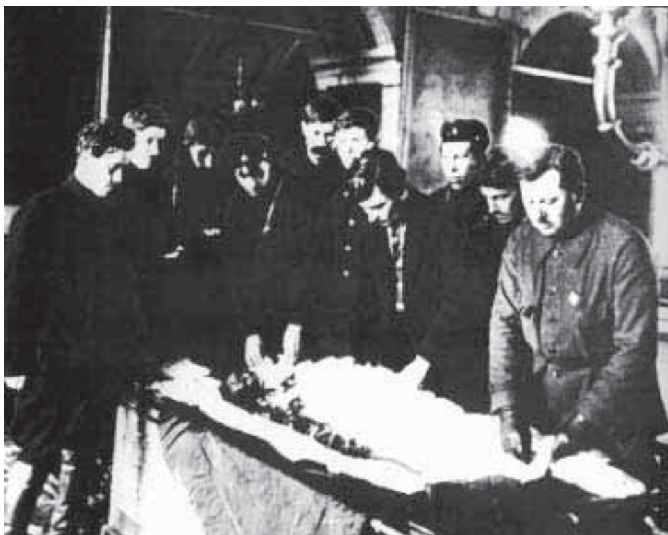
Осквернение мощей преп. Серафима Саровского. 5 апреля 1927 года

Освещая события тех лет, нельзя не сказать об актах вскрытия мощей святых угодников Божиих, произошедших в разных