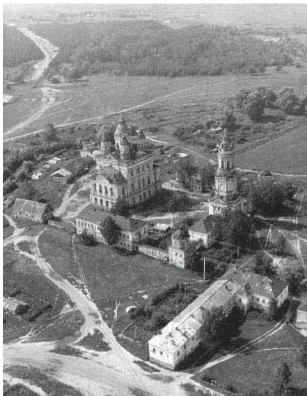
Разоренный Троицкий Сканов монастырь. 1990 г.