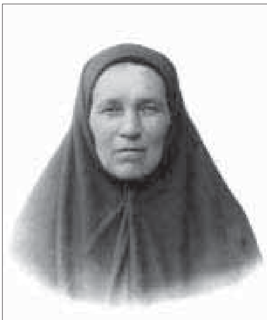
Монахиня Чембарского уезда

В июне 1928 г. началась окончательная ликвидация Чагринского монастыря Самарской губернии, в котором с 1880 года подвизался святой и праведный о. Александр Чагринский, уроженец села Аблязово Саратовской губернии (ныне Кузнецкого района Пензенской области). 6 человек из религиозной общины были арестованы ОГПУ за контрреволюционную агитацию.