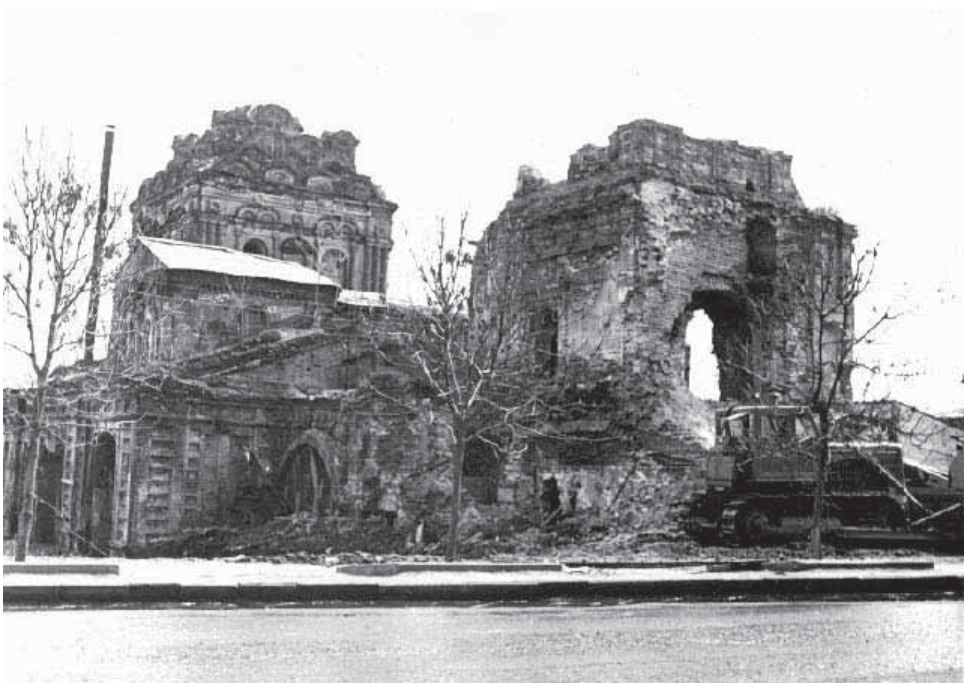
Руины Троицкого монастыря. 1971 г.