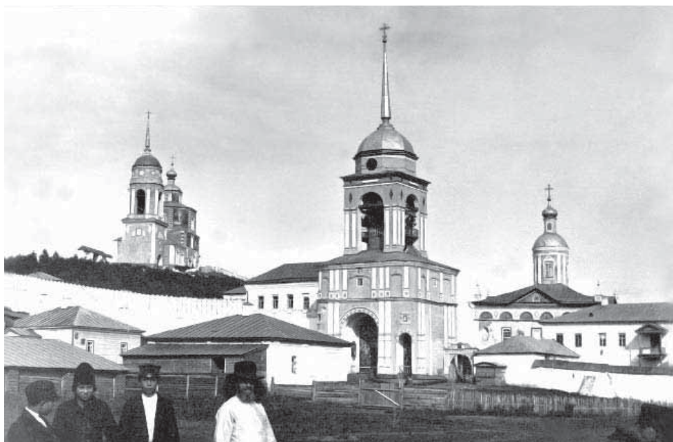
Нижнеломовский Казанский монастырь

ваться чудотворной. К началу XX века в числе совершившихся 109 чудес, было и чудо сокрытия ликов Богоматери и Богомладенца, как знамение грядущего поругания, а затем их появление 127 . Постановлением местного Уисполкома от 16 августа 1920 года Нижнеломовский мужской монастырь был упразднен, монахи были изгнаны или арестованы 128 . Позднее почти весь архитектурный ансамбль обители был одномоментно взорван. Камни от