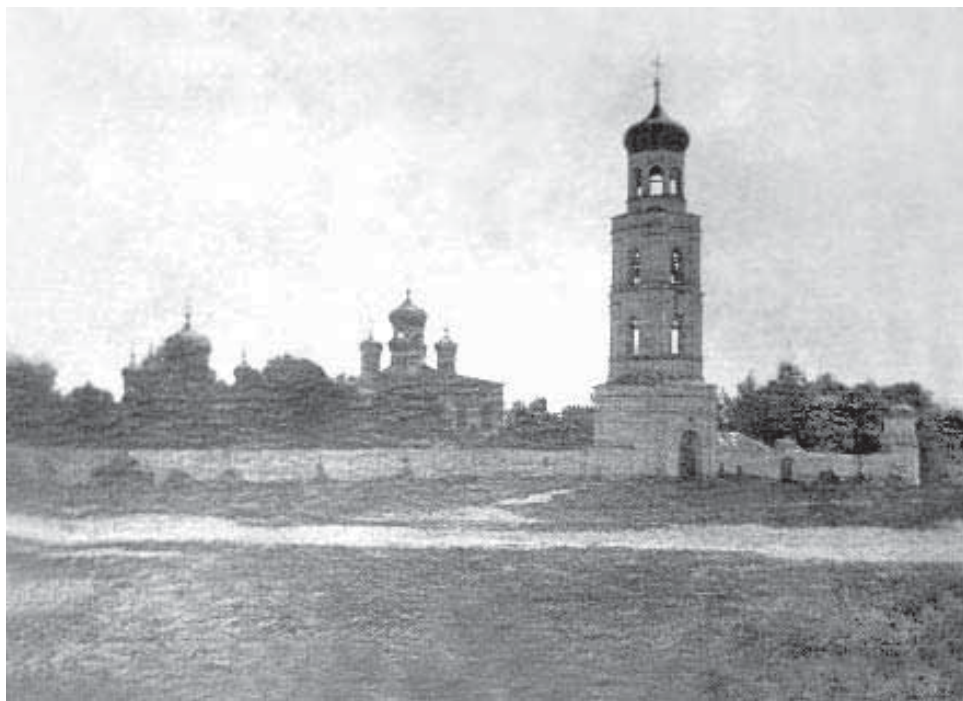
Владимирская Вясская пустынь

Шиханский Покровский женский монастырь Городищенского уезда был, в прямом смысле, стерт с лица Земли. В 1927 году одну из монастырских церквей использовали под колхозную контору «Заветы Ильича», а с 1930 г. в обители устроили хлебный ссыпной пункт. Но затем, ввиду удаленности и невозможности использования монастыря под культурные учреждения, его наме-