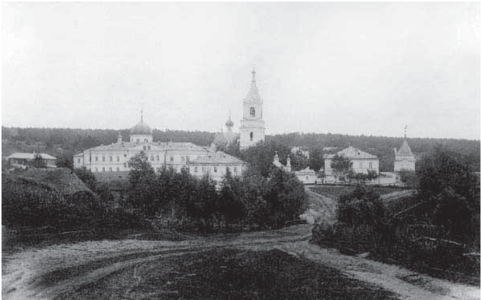
Керенский Тихвинский женский монастырь

В июле 1928 года зимнюю церковь Керенского монастыря передали под клуб. 12 июля там состоялось первое собрание со-