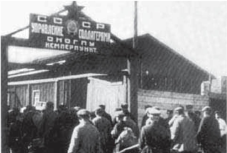
Пересыльный пункт в Кемь