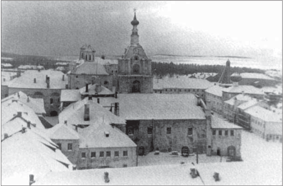
Соловецкий лагерь особого назначения