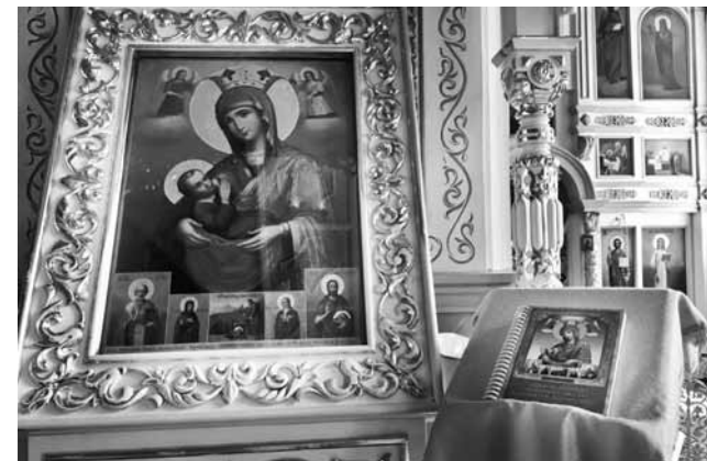
Чудотворный образ Пресвятой Богородицы «Млекопитательница»

– В ходе реставрационных работ нам удалось обнаружить икону Божией Матери «Млекопитательница», написанную в Ильинском скиту на Афоне, – рассказывает настоятель собора. – Она была освящена от чудотвор-