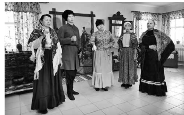
Ансамбль «Казачья слобода».

На его базе работают несколько различных объединений: библиотека, воскресная школа, молодежное общество, студия-мастерская «Марья-искусница», социальная служба. В центре проводятся библейско-богословские беседы «Разговор у печки», бесплатные занятия по психоло-