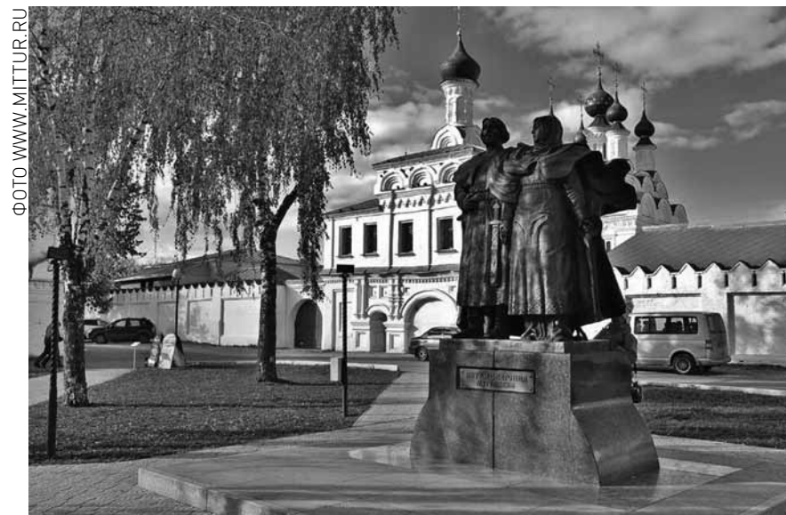
Троицкий монастырь и памятник блгвв. князьям Петру и Фервонии. Город Муром. Владимирская область.

Алина КАЛИНИНА, фото twitter.com/MuseumVok