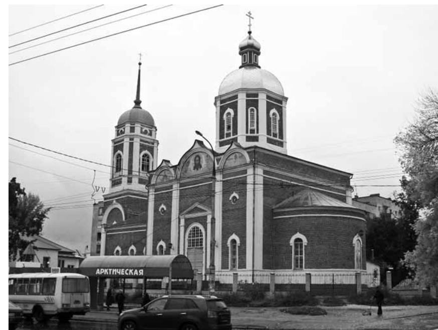
Христо-Рождественский храм г. Липецка

Приговор был приведен в исполнение 2 ноября 1937 года в 24 часа. Место погребения священномученика неизвестно.