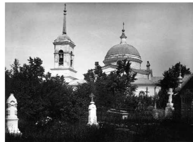
Воскресенская кладбищенская церковь г. Саратова. Фото нач. XX в.