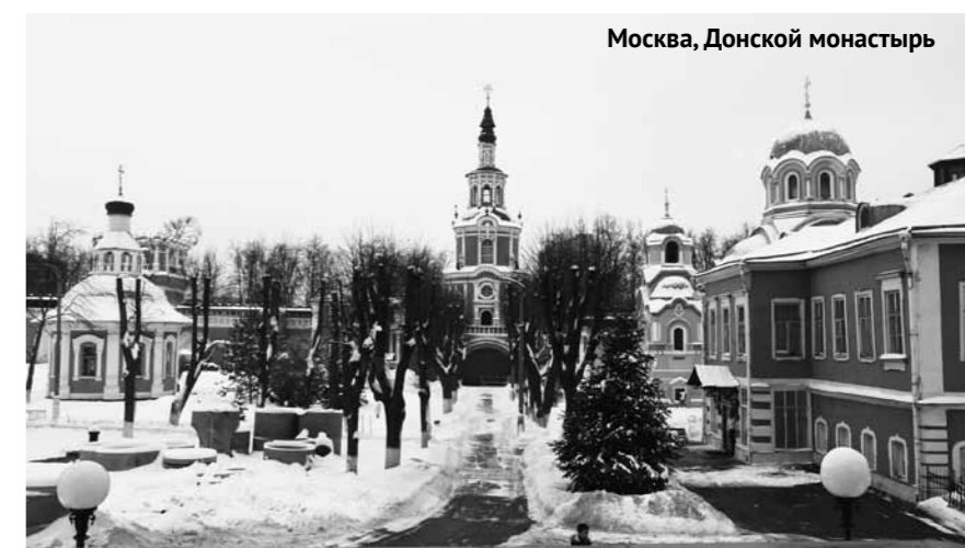
Москва, Донской монастырь

22 декабря. Пензенская область. Сердобский район. Сазанье: Казанская Алексиево-Сергиевская