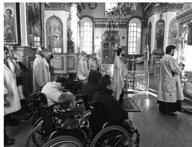
Тот самый молебен в Успенском кафедральном соборе у мощей святителя Иннокентия Пензенского за неделю до открытия «Новых берегов»

В первый же день пребывания на новом месте Ольга с детьми поняли, что сделали правильный выбор. В их квартире все сделано максимально удобно под потребности человека с инвалидностью.