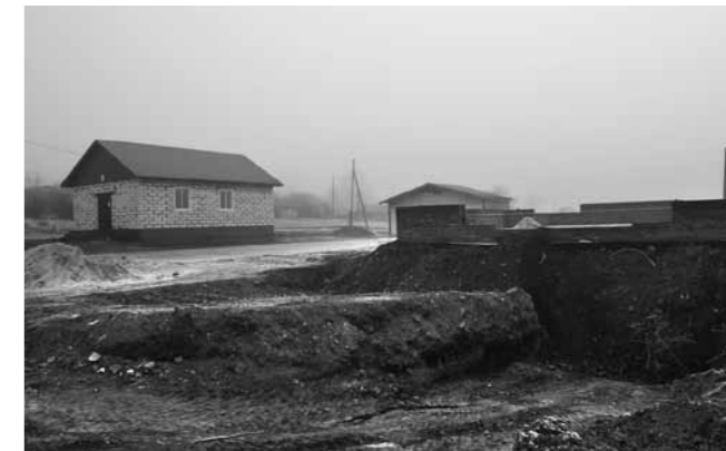
Строительство нового храма заморозили до весны. Богослужения пока проводятся в молитвенном доме

Паломники вновь зачастили в Кочетовку. Пусть пока здесь нет никаких условий, молитвенный дом тесный и не всегда может одновременно вместить всех членов паломнической группы. Главное, есть возможность коснуться святыни, выпить и набрать с собой воды из святого источника.