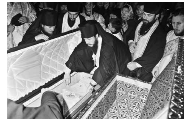
Перенос мощей святителя из гроба в раку. В центре – иеромонах Серафим (Домнин), будущий митрополит Пензенский и Нижнеомовский

зался его свидетелем. Мне кажется, все верующие пензенцы переживали тогда духовный подъем, ведь у них появился свой небесный заступник перед Господом.