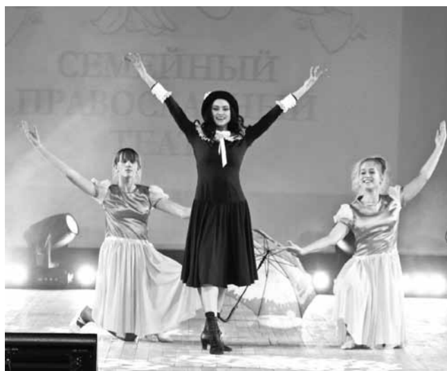
Выход Мэри Поппинс