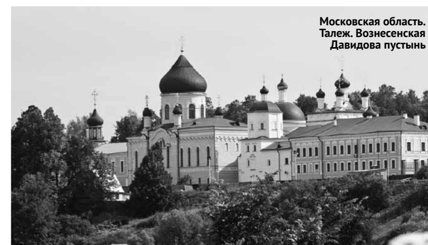
Московская область. Талей. Вознесенская Давидова пустынь

19 – 20 октября. Республика Мордовия. Темников: Рождество-Богородичный Санаксарский монастырь: к мощам св. прп. Феодора, прав.